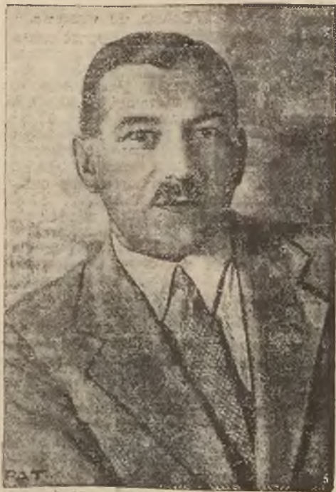
Minister Skarbu Władysław Marjan Zawadzki, dotychczasowy wicepremier.