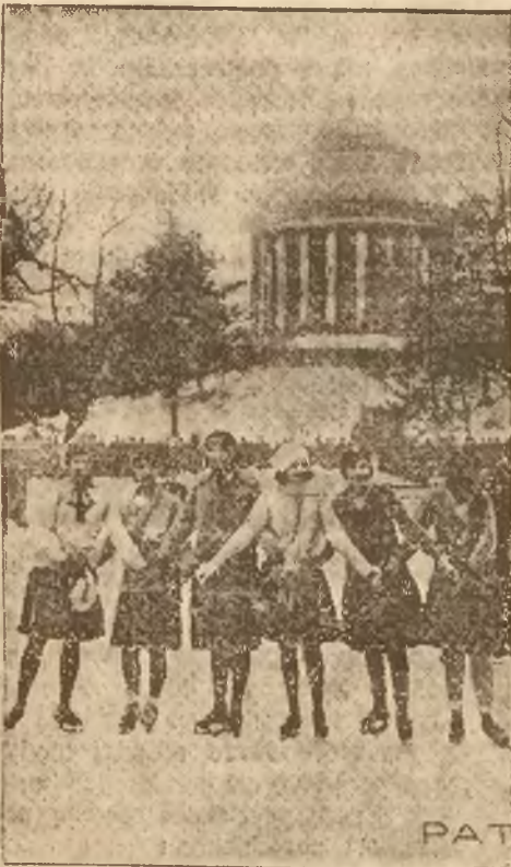
Rozkosze zimy. Wszędzie, gdzie można było wyzyskać trochę miejsca na ślizgawki, gromady dzieci, młodzieży i dorosłych używają przyjemności „osemiłowania“ i „holendrowania“. Zdjęcie: ślizgawka w ogrodzie Saskim w Warszawie.

Począwszy od dnia 25 grudnia Lwowskie Towarzystwo Łyżwiarskie wprowadziło na swoim torze przy ul. Pelczyńskiej l. 53, orkiestrę wojskową, która koncertuje jak w latach ubiegłych.