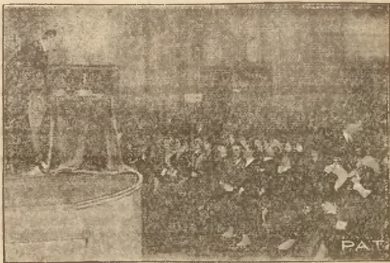
Marinetti otwiera zjazd poetów włoskich. Tworca futuryzmu włoskiego F. T. Marinetti otworzył zjazd t. zw. trzeciego cyklu poezji włoskiej. Zjącie: przemówienie Marinetti'ego

Tendencja utrzymana, usposobienie ożywione.