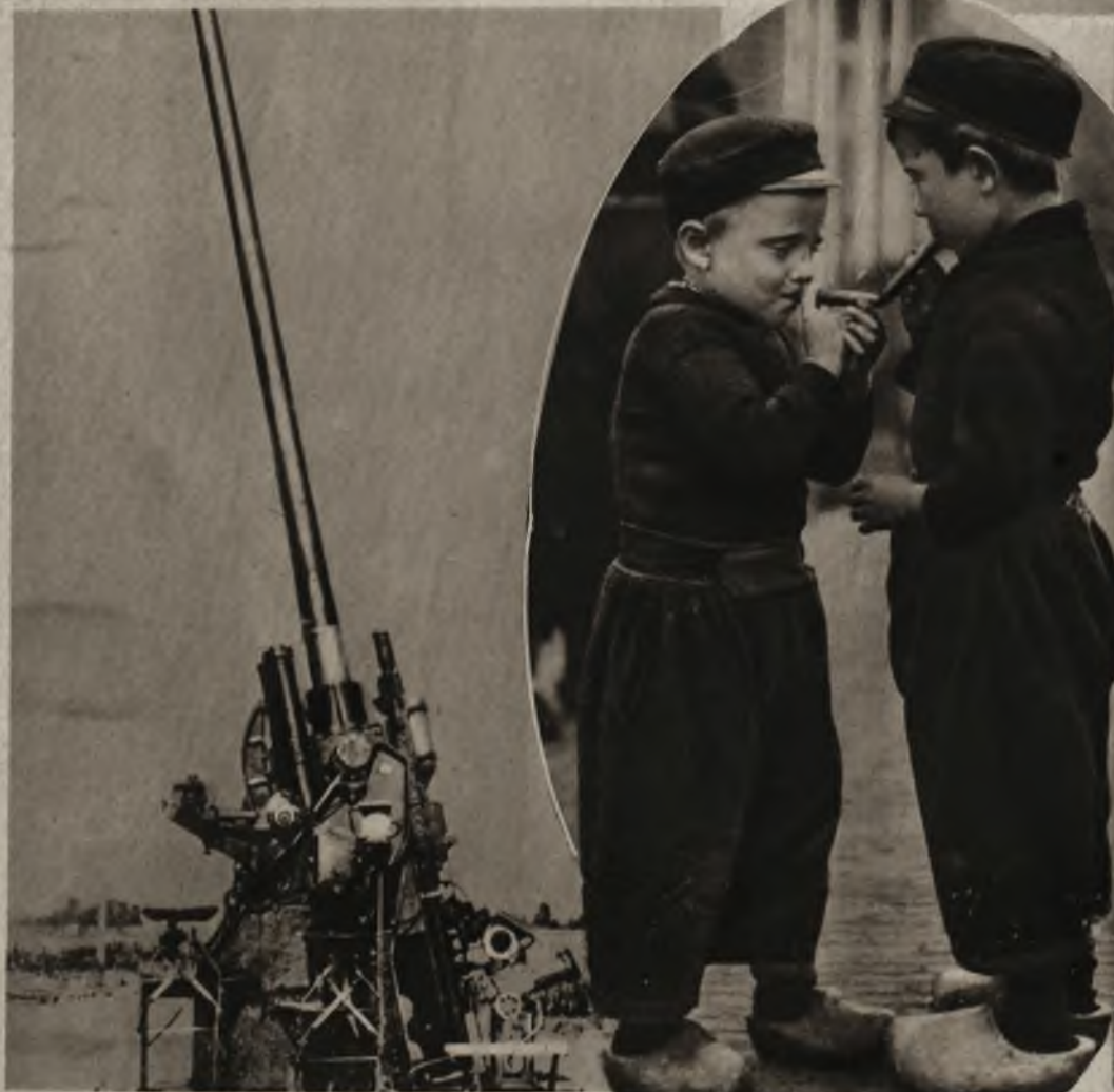
Najnowsza amerykańska armata do obrony przed samolotami, wygląda jak olbrzymia luneta.

W Holandji cygara są tańsze niż w wszystkich innych krajach europejskich. Dlatego nawet ci młodzi chłopcy nie nadwyręcają swego budżetu używając tej wątpliwej przyjemności.