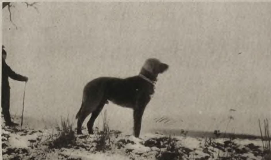
Piękna sylwetka „Szacha“ settera irlandzkiego, obserwującego uciekającego szaraka.