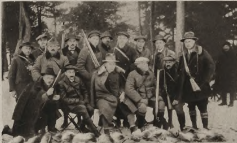
Lwowaki klub myśliwski „Ponowa“ na polowaniu w Mińszowicach.