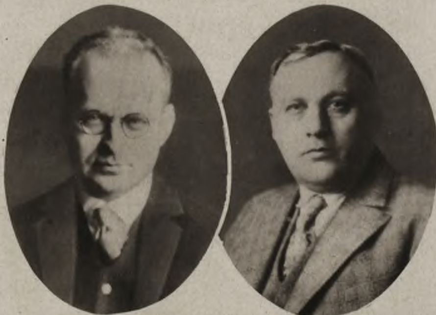
Dwaj najgroźniejsi rywale na berlińskim turnieju szachowym Nimcowicz i Bogolubow na prawo.