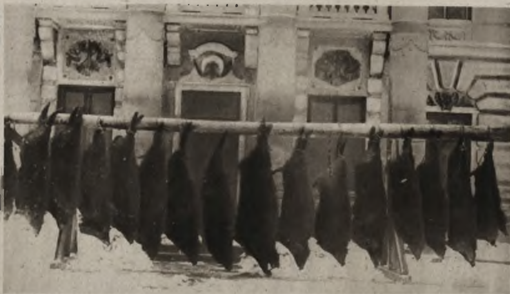
Wspaniały rezultat dwudniowych łowów w Koropcu nad Dniestrem u hr. Stefana Badeckiego. W pięć strzelb 17 dzików.