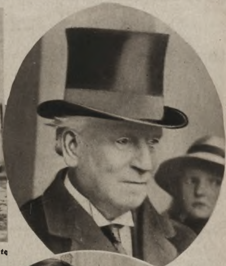
Na prawo: Zmarły przed paru dniami Herbert Asquith lord Oxford, długoletni premier i przywódca partji liberalnej.