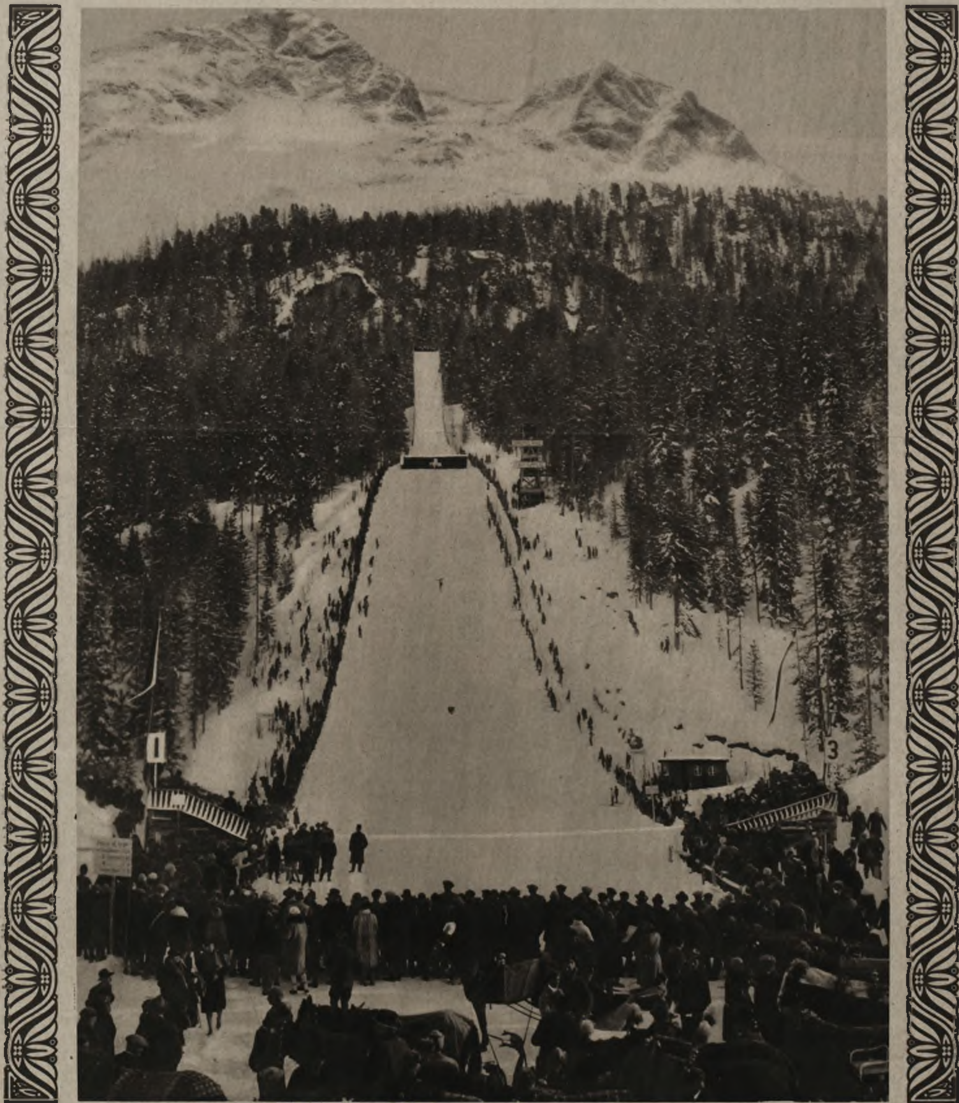
Skocznia olimpijska w St. Moritz.