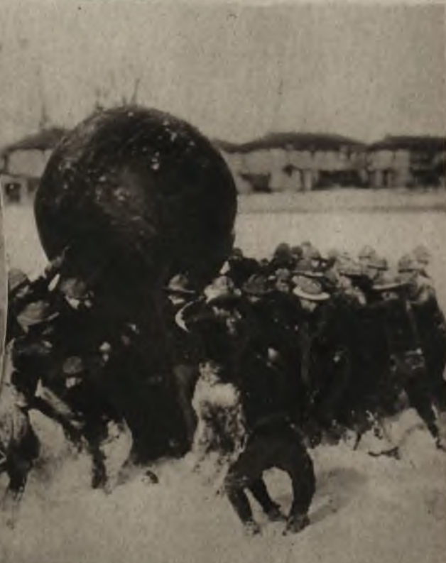
Uczniowie szkoły oficerskiej w Chester w Ameryce grający w piłkę olbrzymią (push-ball).