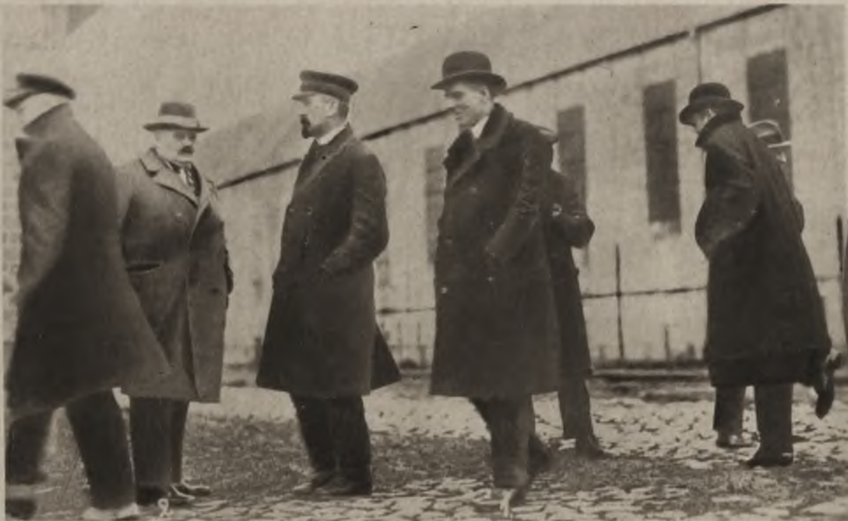
General włoski, Nobile (1) towarzysz wyprawy polarnej Amundsona, zamierza jeszcze raz podjąć tę wyprawę, i wyjechać ze Słupaka (Pomorze pruskie).