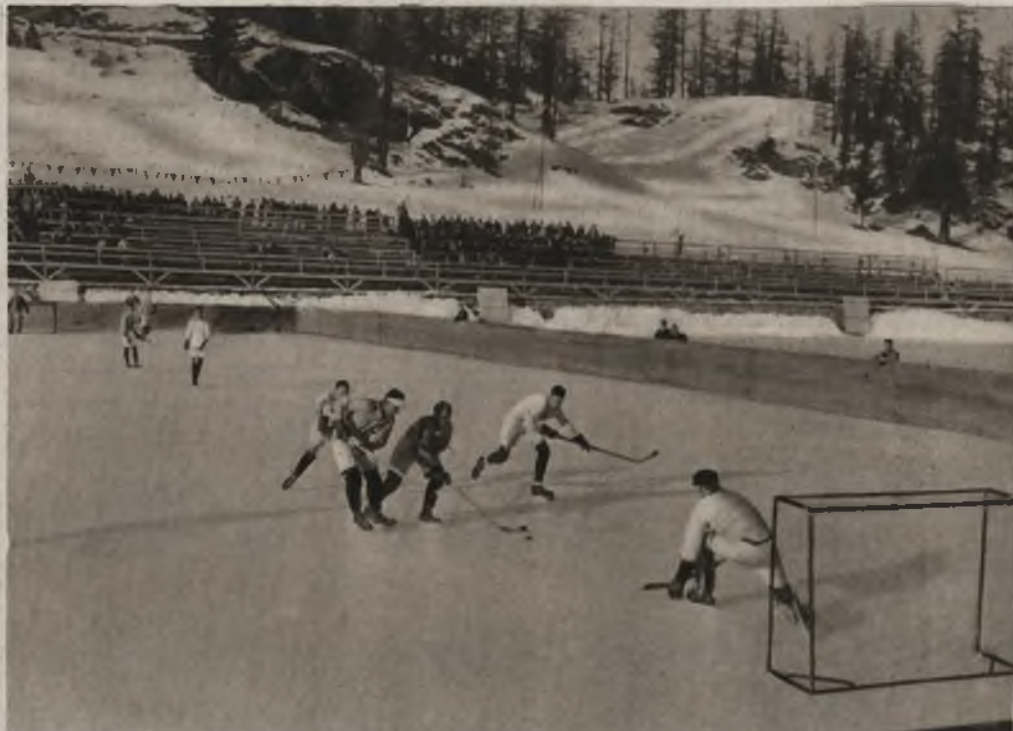
Moment z meczu hockeyowego Polaka—Szwecja 2:2.