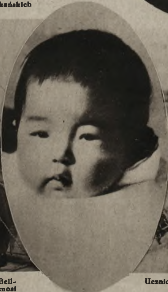
Księżniczka Hisa Sachito najmłodsza córka cesarza japońskiego.