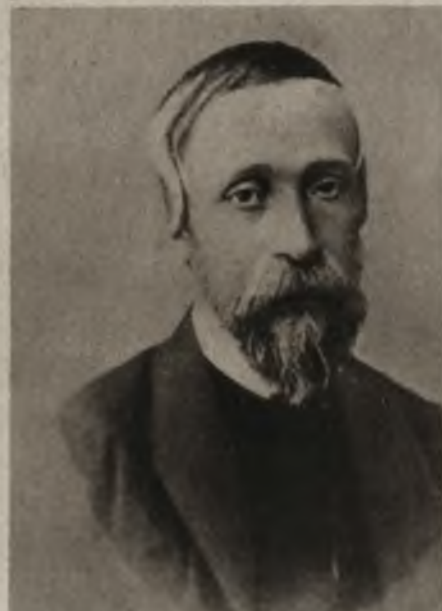
Na prawo: Wynalazca lampy naftowej. W bieżącym roku mija 75 lat od chwili gdy ś. p. Ignacy Łukasiewicz po raz pierwszy przedstawił ropę naftową używając naftę świetlną. W rocznicę epoki Polaka, zamieszczamy Jego podobiznę.