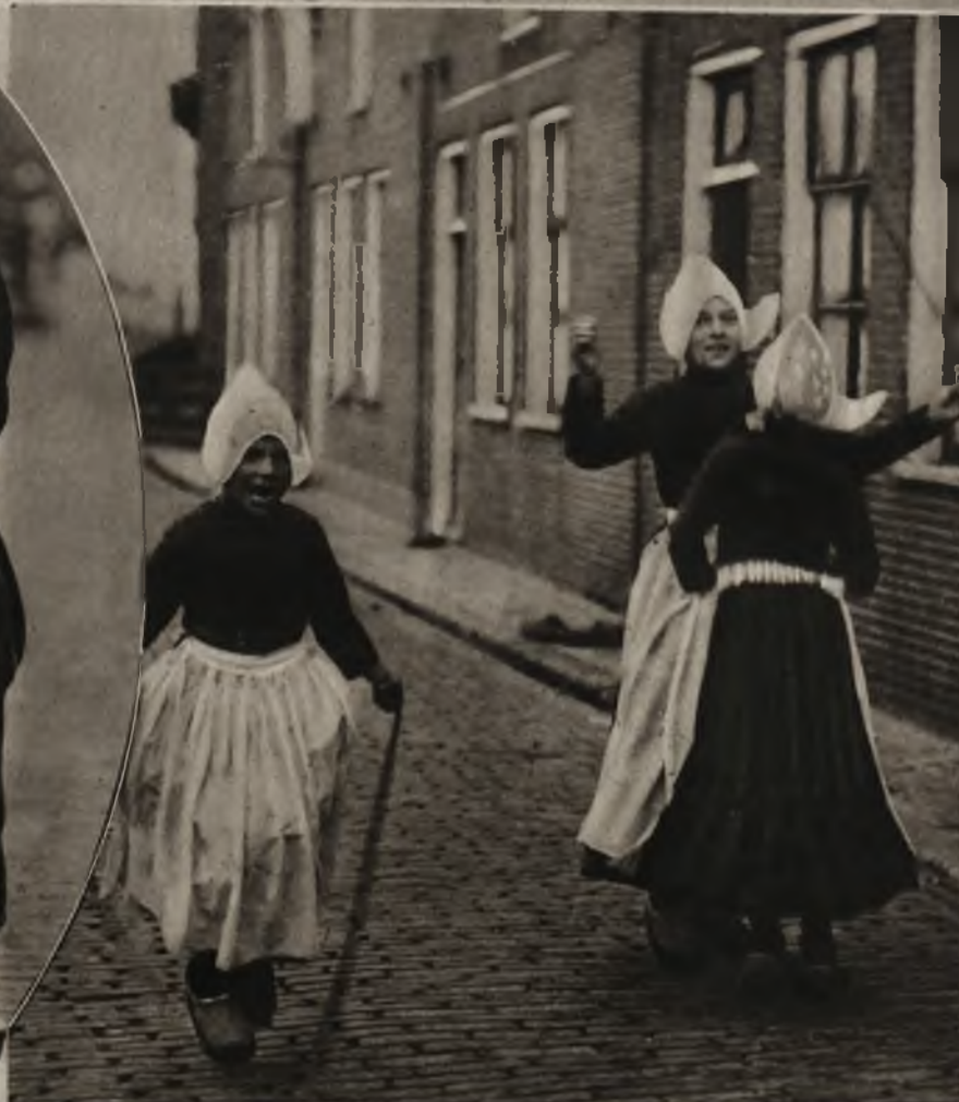
Trzy małe Holenderki akaczą przez sznurak w swych narodowych strojach.

W Holandji cygara są tańsze niż w wszystkich innych krajach europejskich. Dlatego nawet ci młodzi chłopcy nie nadwyręcają swego budżetu używając tej wątpliwej przyjemności.