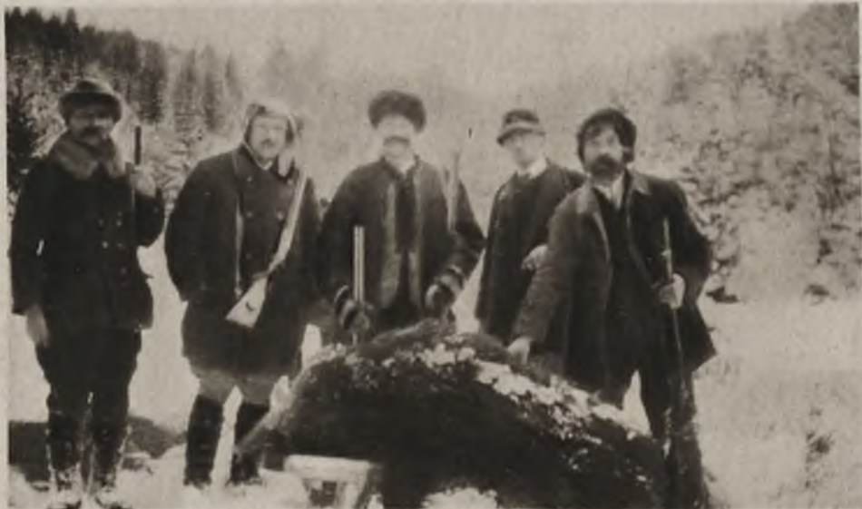
Z knieji skolskiej bar. Groedłów w Karpatach Wschodnich. Po miocie, w którym św. Hubert myśliwemu przyjął.