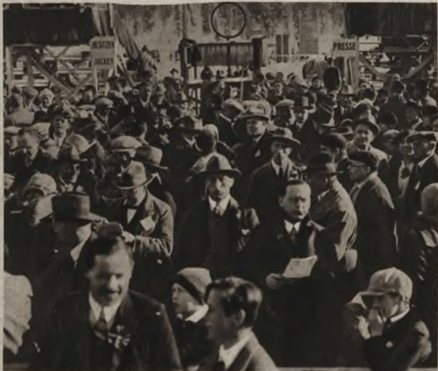
Na torze wyścigowym na jeziorze St. Moritz.