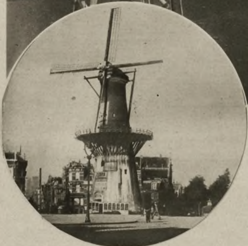
W Rotterdamie, w centrum miasta znajduje się starodawny młyn, który jako ciekawy zabytek przeszłości oszczędzany jest przez zarząd miasta.