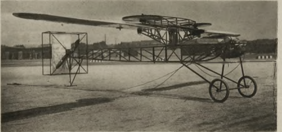
Samolot śrubowy. Na lotnisku berlińskim czynione są obecnie próby z samolotem rotacyjnym, który wznosi się i opada pionowo.