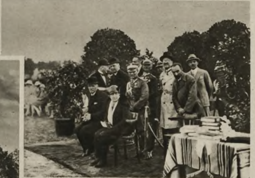
Z pobytu prezydenta Rzplitej w Wielkopolsce. U góry p. prezydent ze świtą w ogrodzie botanicznym w Poznaniu. U dołu p. prezydent przypatruje się zawodom w „Polo” na Błoniach Grunwaldzkich.