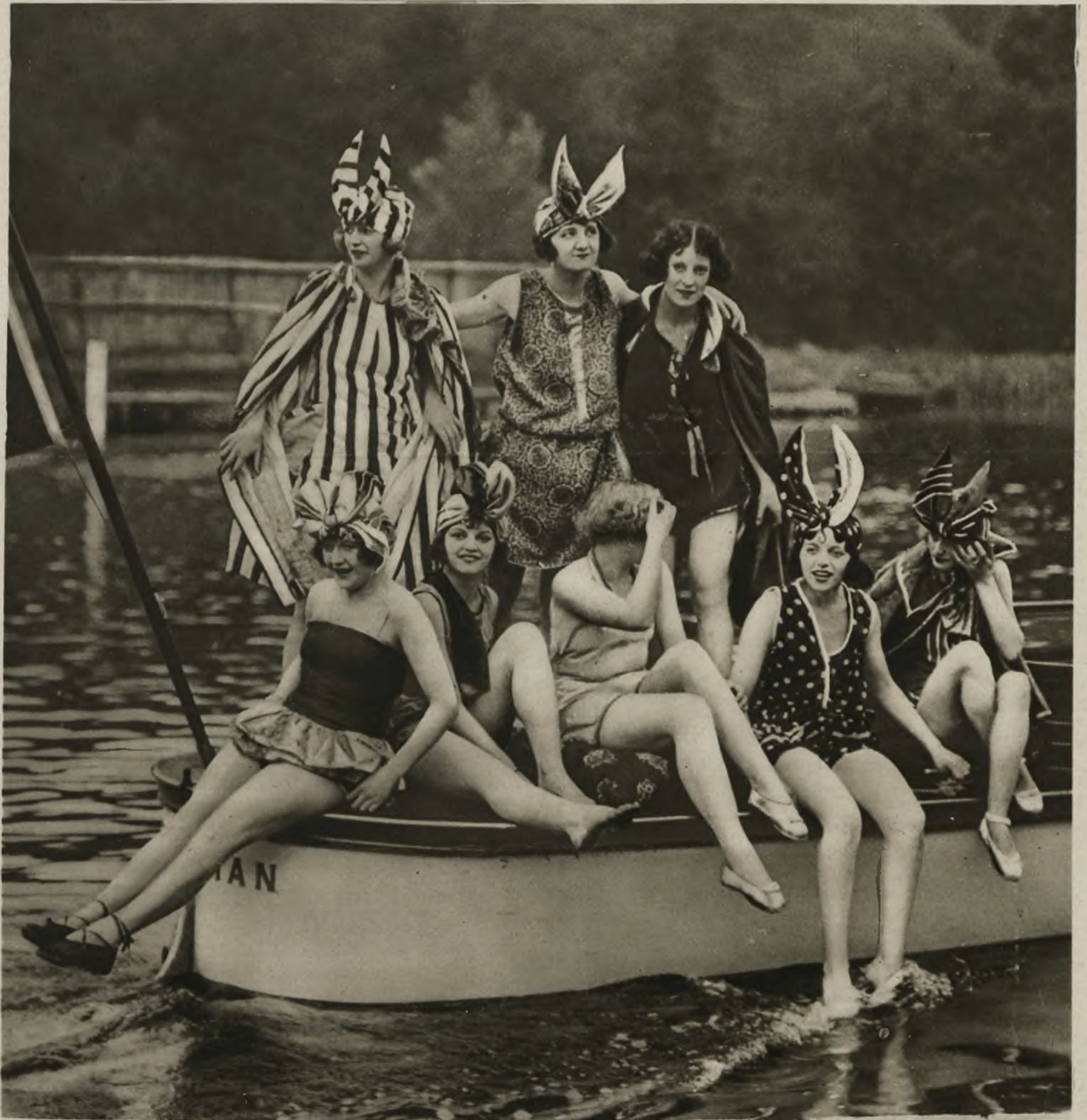
Grupa aktorek londyńskich biorących udział w konkursie strojów kąpielowych urządzonym na Tamizie.