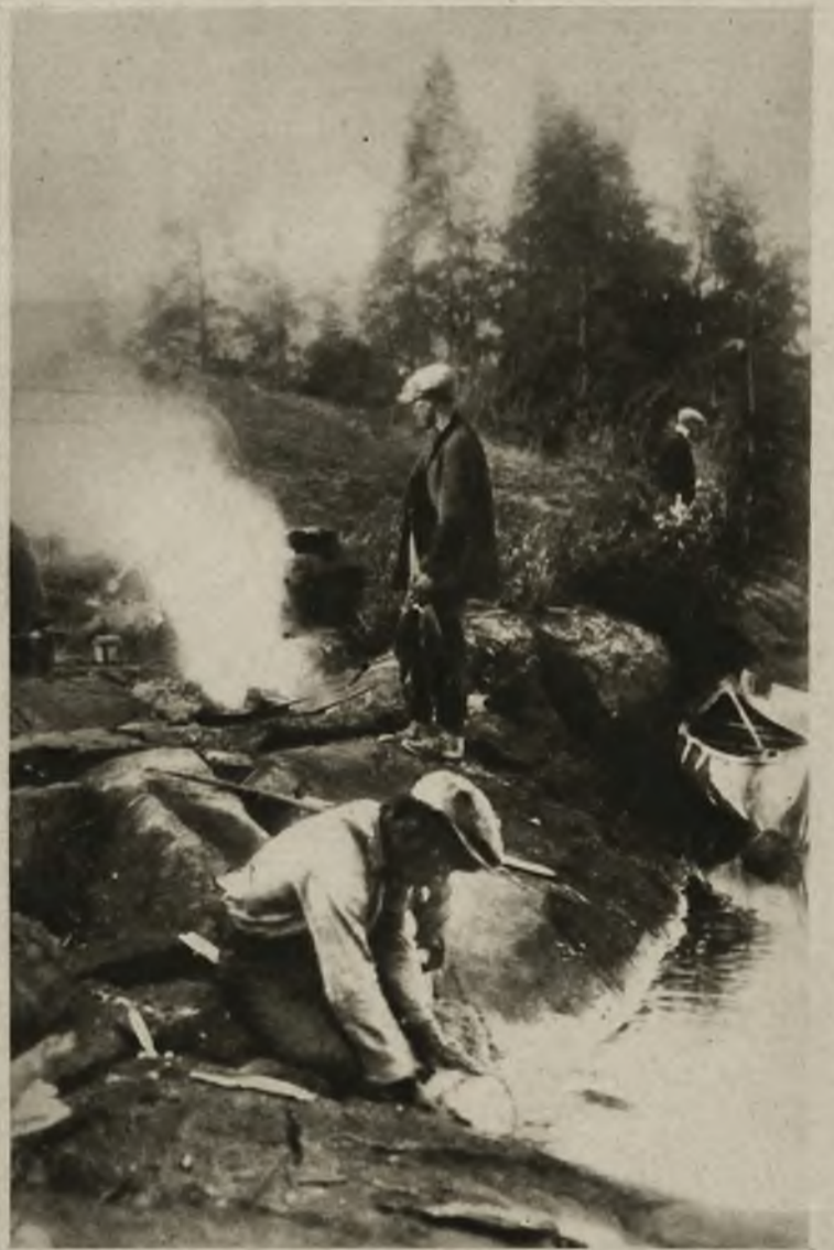
Obrazek z „campingu” lodzią. Posilek przy ognisku przed noclegiem.