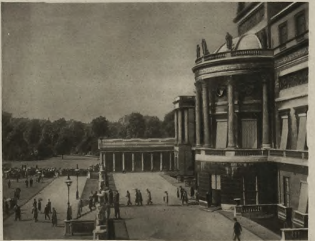
Kilka razy do roku wydaje król angielski przyjęcie w pałacu Buckingham, na którym zjawia się elita świata dyplomatycznego, naukowego i artystycznego. Na zdjęciu widzimy ogród przed pałacem z licznymi przechadzającymi się gośćmi.