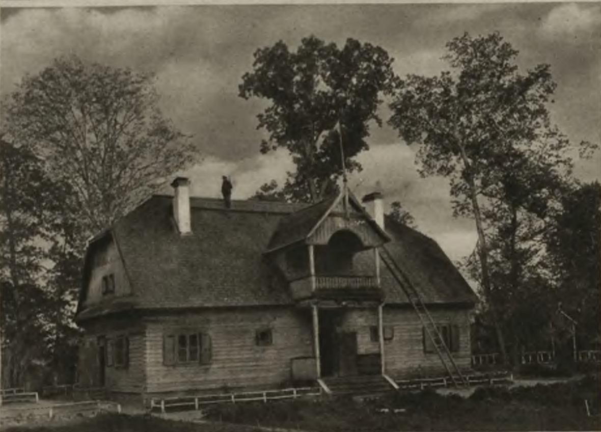
Z życia Korpusu Ochrony Pogranicza. U góry: patrol na Stuczcy, będącej granicą polsko-rosyjską. U dołu: strażnica w Jelnie w powiecie dziśnieńskim.