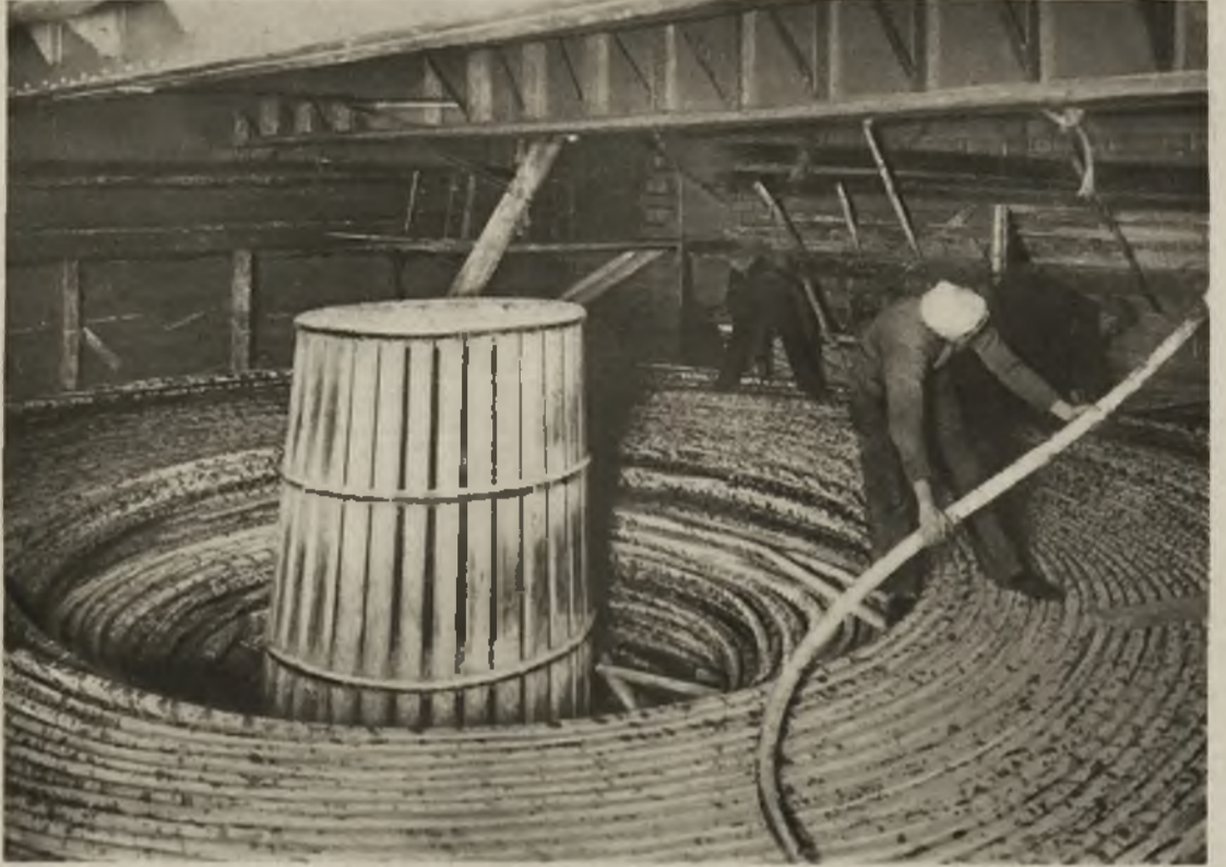
Dnia 7 sierpnia b. r. mija 70 lat od założenia pierwszego kabla telegraficznego z Anglii do Ameryki północnej. Tego to dnia nadano pierwszy telegram na drugą półkulę. Zdjęcie nasze przedstawia wnętrze okrętu kablowego, zawierającego setki kilometrów kabla. Na lewo początek kabla na wybrzeżu.