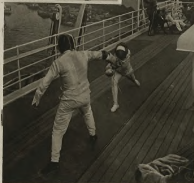
Na prawo: Trening szermierzy amerykańskich na pokładzie parowca „President Roosevelt”, który służy amerykańskiej drużynie jako mieszkanie w amsterdamskim porcie.