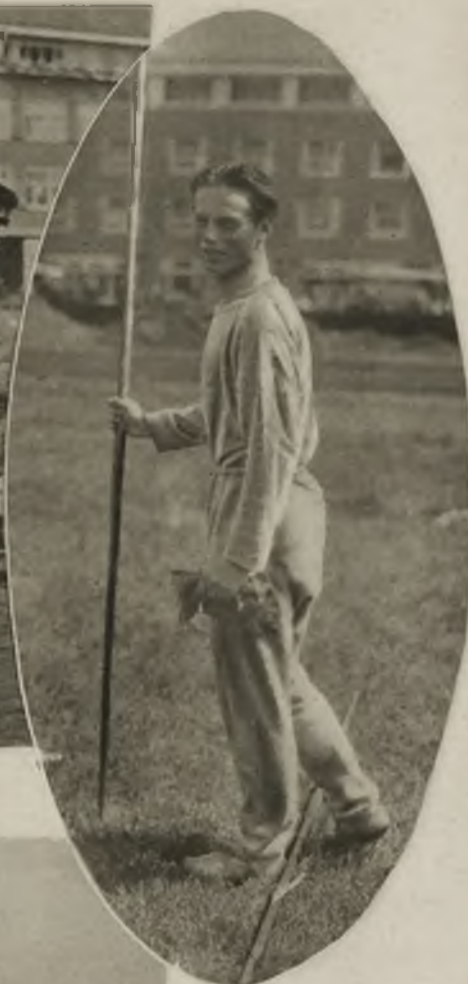
Meksykańska drużyna lekko-atletyczna podczas treningu w Amsterdamie.