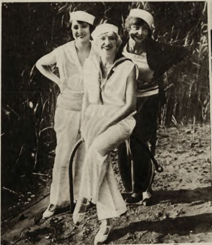
Do sportów wodnych noszą obecnie piękne panie strój marynarski, który jest twarzowy i daje wielką awobodę ruchów.