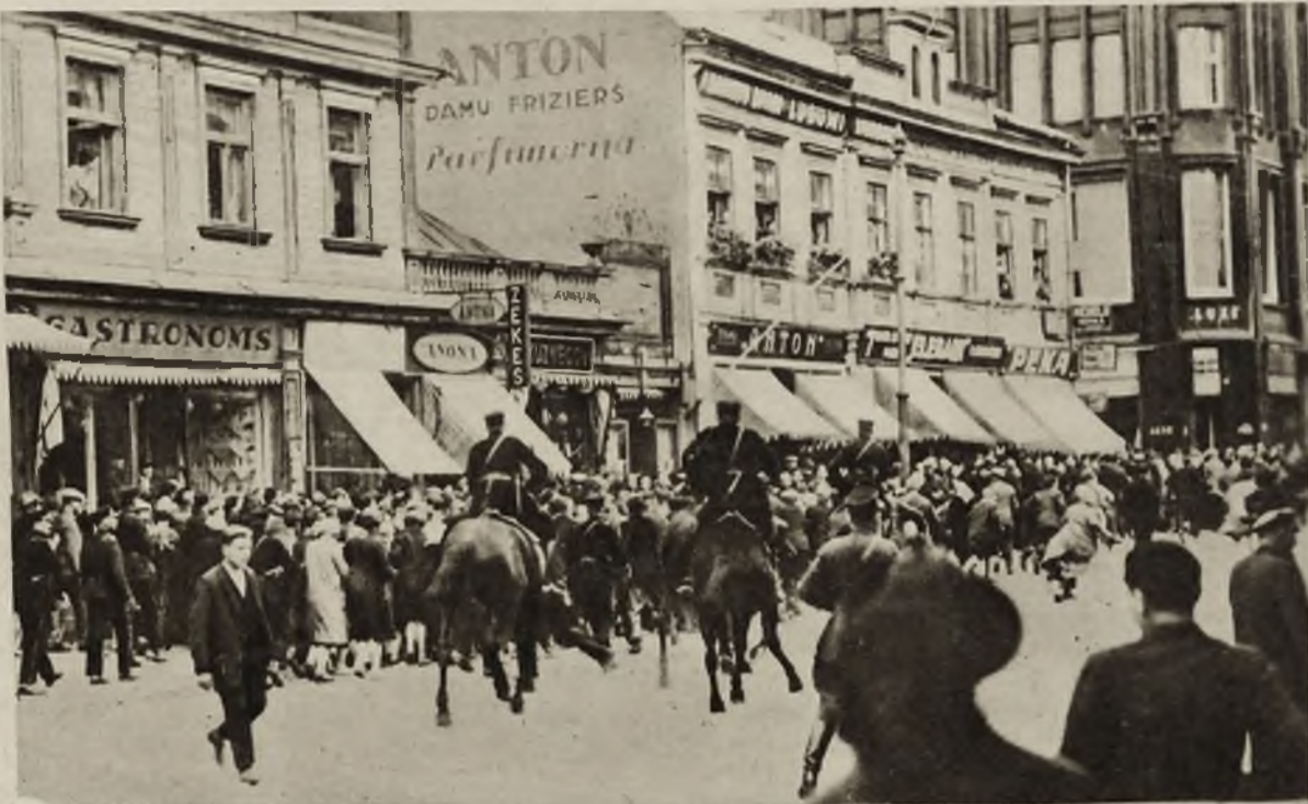
Rozruchy komunistów łódzkich w Rydze zostały stłumione przez policję. Na zdjęciu widzimy policję konną napierającą na tłum demonstrantów.