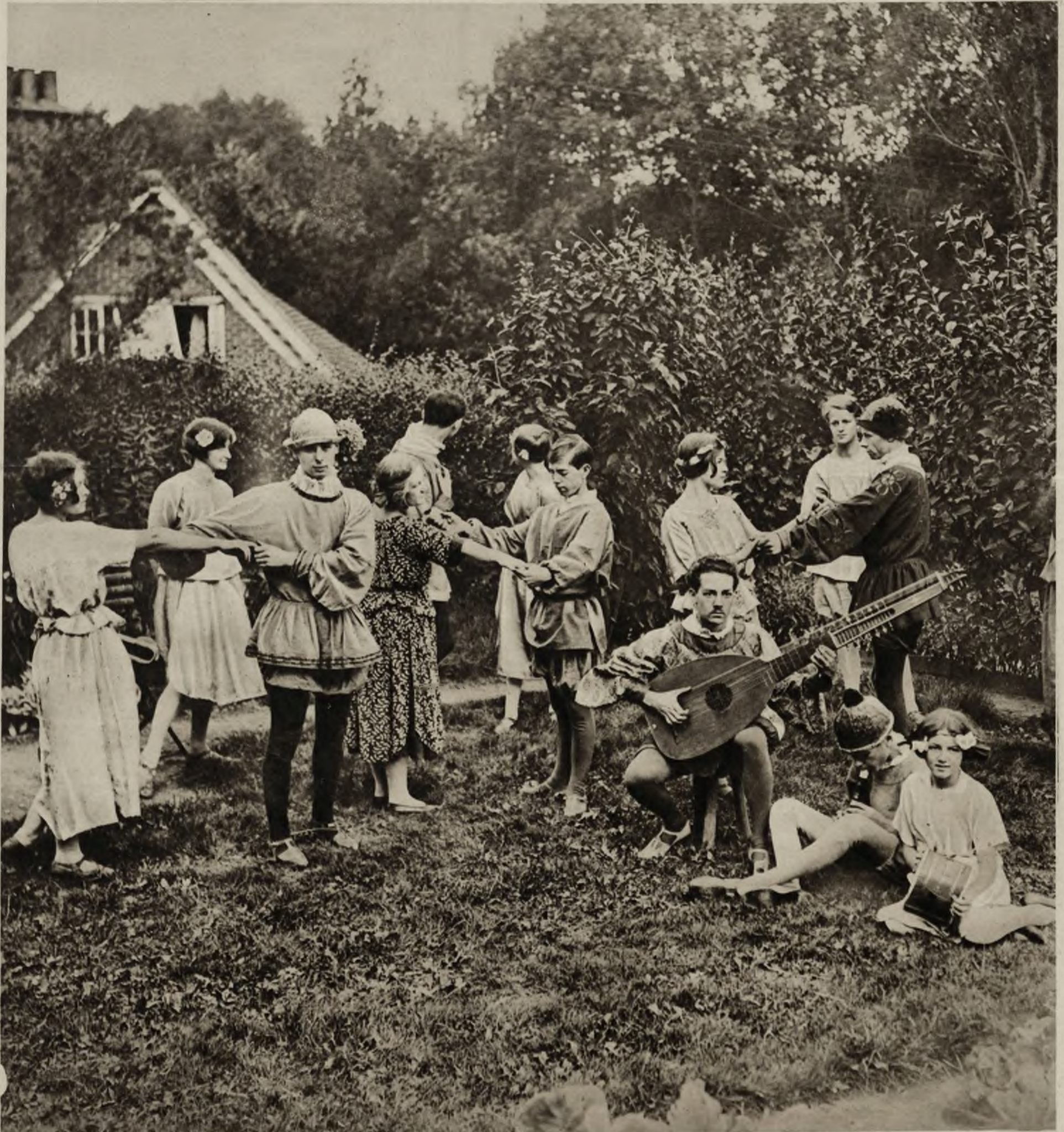
W miejscowości Haslemere (Surrey, Anglja) odbył się festiwal muzyczny, w którym używano tylko starych, przeważnie średnio-wiecznych instrumentów. Równocześnie odbywał się konkurs starych tańców.