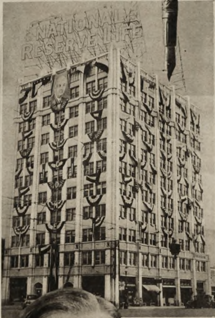
Interesujący obraz z kampanji wyborczej w Ameryce. Wielki gmach cały ozdobiony chorągiewkami z olbrzymim portretem kandydata.