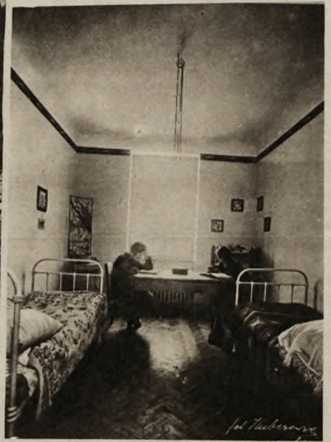
Dom studentek we Lwowie. Urządzony z niesłychanym komfortem, ma do dyspozycji gości przyjeżdżających na Targi Wschodnie ponad 100 pokoi.