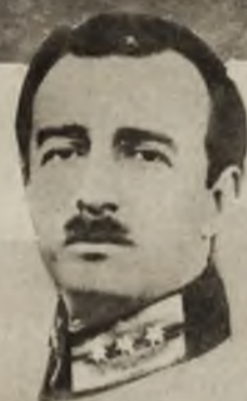
U dołu: Achmed Zogu, król Albanji, na tle Tirany, stolicy swego państwa.