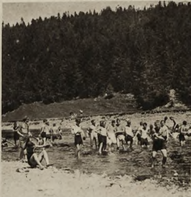
Obozy letnie przysp. wojsk. D. O. K. X. w Zelenicy. Rozbawiona młodzież zażywa po ćwiczeniach kąpiel w Oporze.