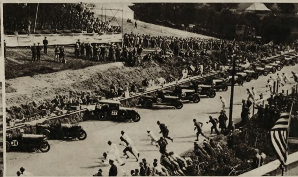
Podczas wyścigów automobilowych w Belfast (Irlandja) wóz znanego kierowcy Campbella stanął w płomieniach, lecz kierowca zdołał się wyratować. Zdjęcie dolne przedstawia moment startu kierowców na dany znak na wyścigach w Belfast.