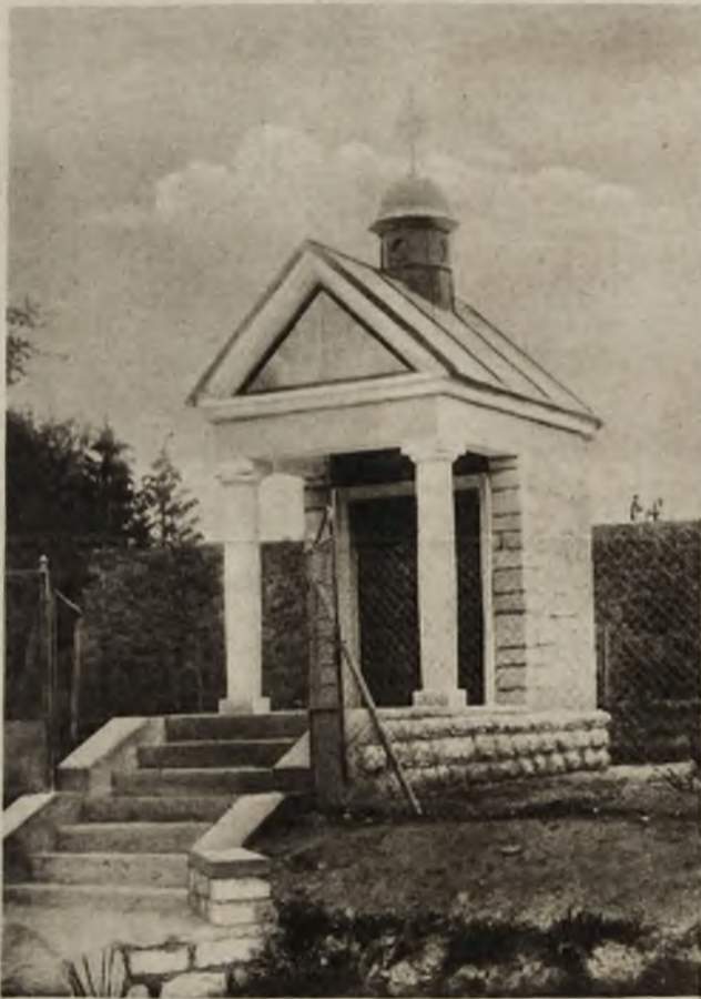
Kapliczka zbudowana w Zaleszczykach przez komitet obywatelski zaleszczyckiej ziemi na pamiątkę Jana Kasprowicza.