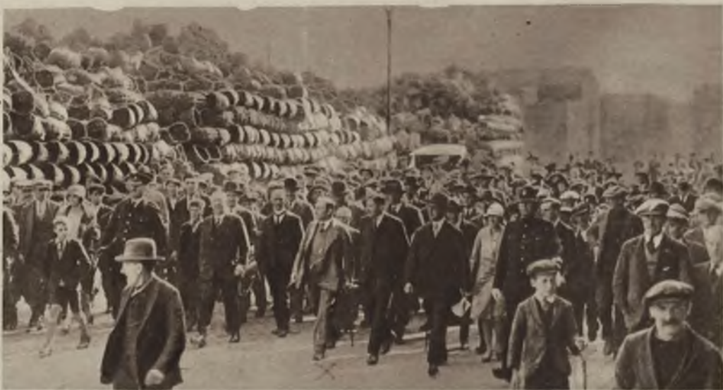
Angielski premier mr. Baldwin odwiedza w Yarmouth wielki targ na ryby.