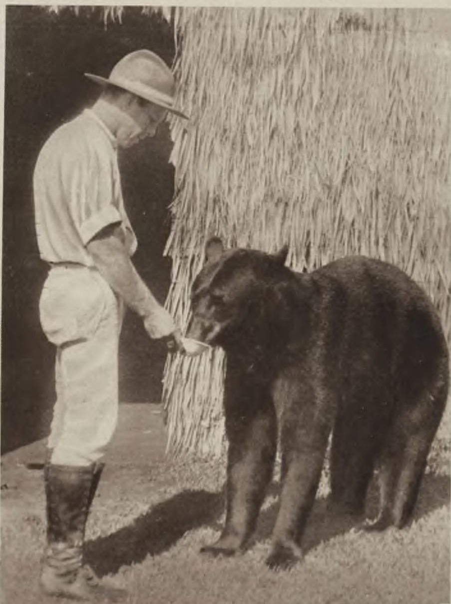
Doskonała tresura niedźwiedzia, którego nauczono nawet jeść z ręki.