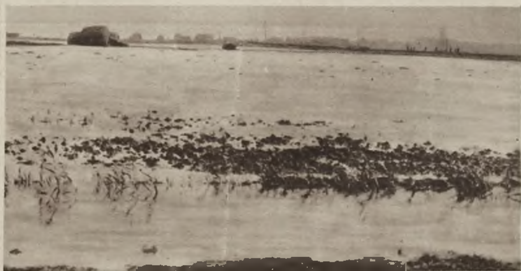
Zdjęcie z olbrzymiej powodzi w Belgii w której zalane zostały olbrzymie przestrzenie uprawnych pól i zamieszkałych okolic.