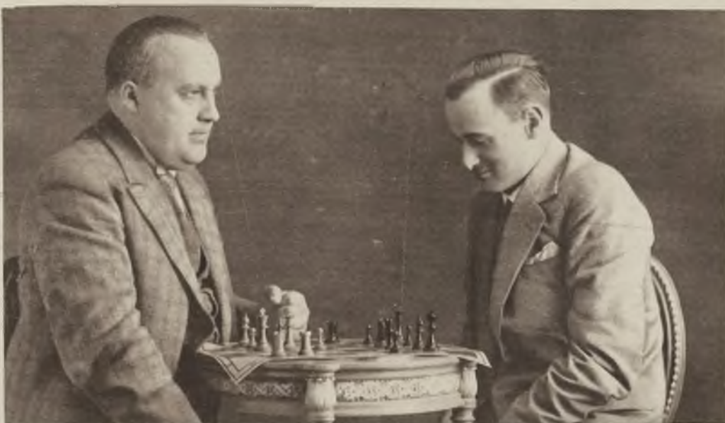
Zwycięzcy turnieju szachowego w Berlinie Bogoljubow (na lewo) i Samisch.