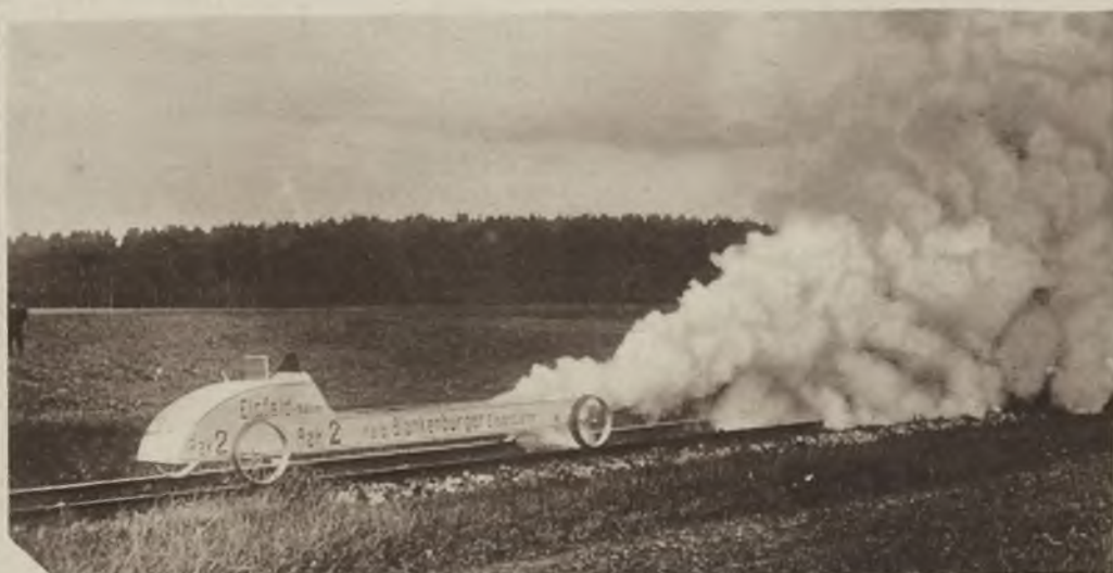
Dalsze próby samochodu rakietowego w Niemczech przyniosły pomyślne wyniki. Wóz osiągnął olbrzymią szybkość nie doznając żadnego wypadku.