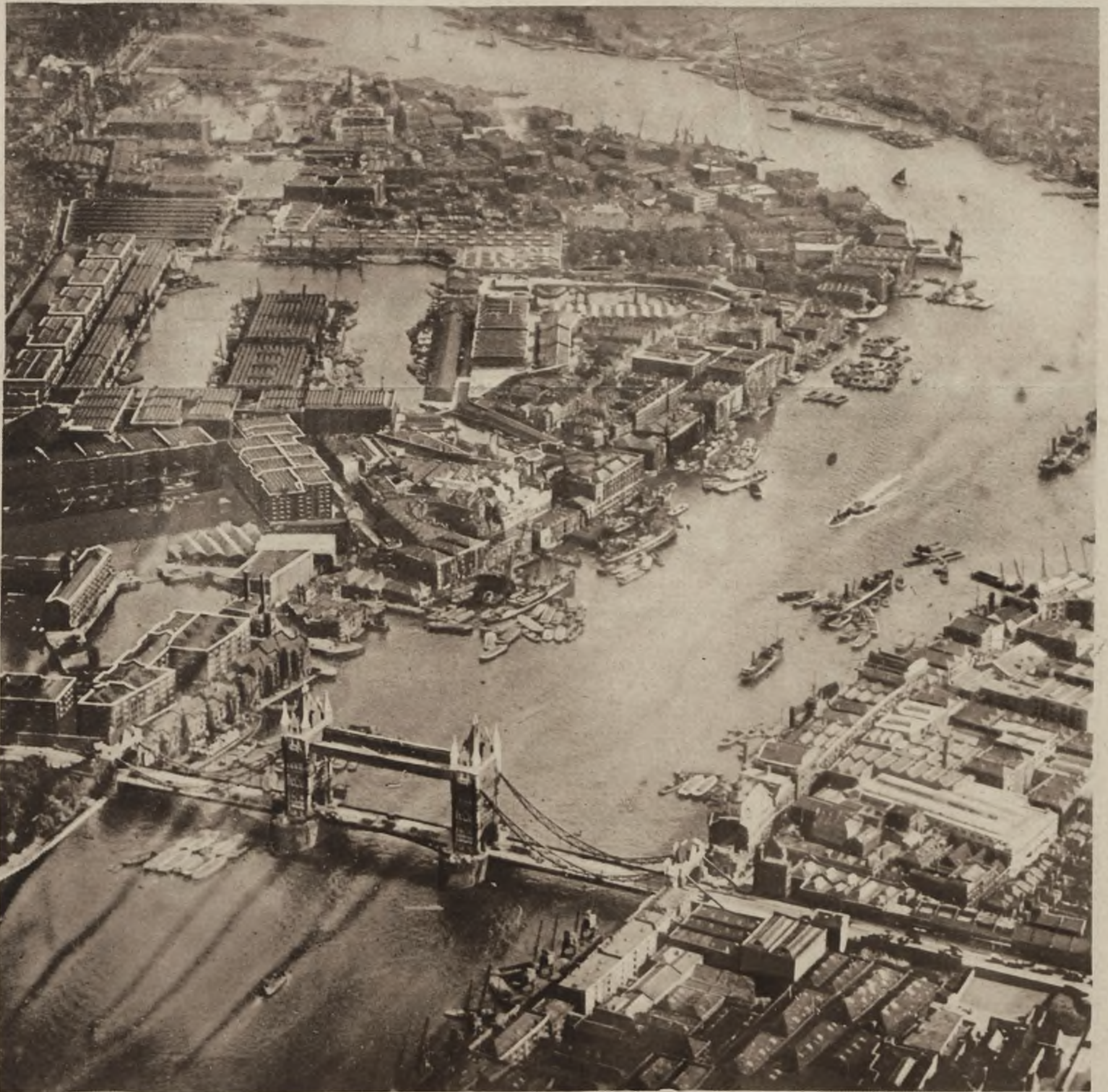
Na pierwszym planie widoczny Tower Bridge dalej olbrzymie magazyny i doki okrętowe.