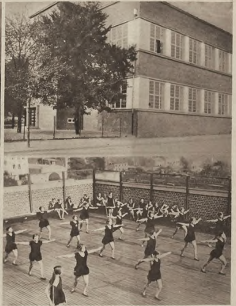
Na prawo: Nowoczesny zakład gimnastyczny z wielkimi higienicznymi salami i tarasowatym dachem urządzonym również dla ćwiczeń na wiosnę i w lecie.