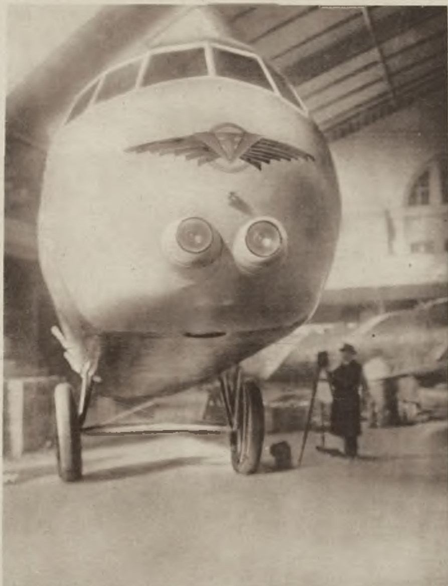
Oryginalna iluzyna samolotu Farmana znajdująca się na wystawie lotniczej w Berlinie.