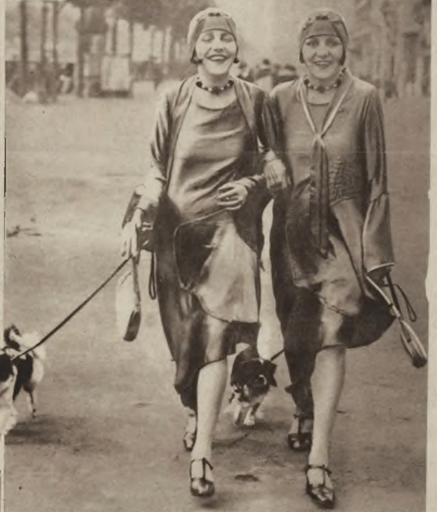
Dogde Twins, groźne konkurentki „Dolly Sisters” wróciły z Europy do Ameryki.