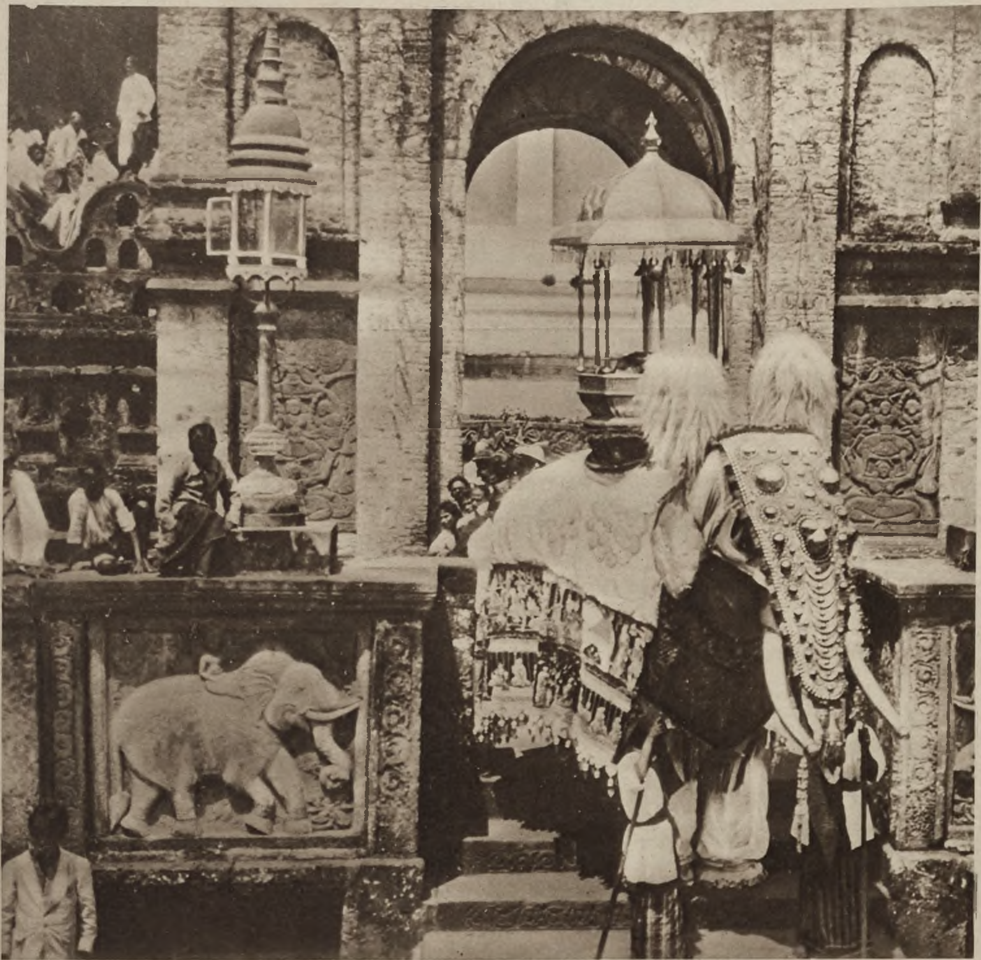
Święty słon w dzień uroczystości buddyjskich, opuszcza przybrany w drogie klejnoty świątynię, by przejść z uroczystą procesją miasto.