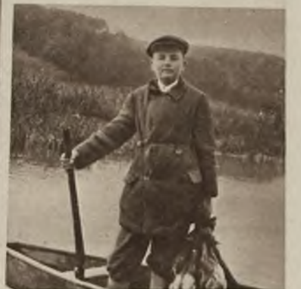
Przed świętem patrona myśliwych św. Huberta. U góry na lewo: Wyjazd na staw janowski na polowanie na kaczki. U góry na prawo: Sw. Hubert łaskaw dla młodego myśliwego. U dołu: Na stawie w Stradczu koło Janowa.