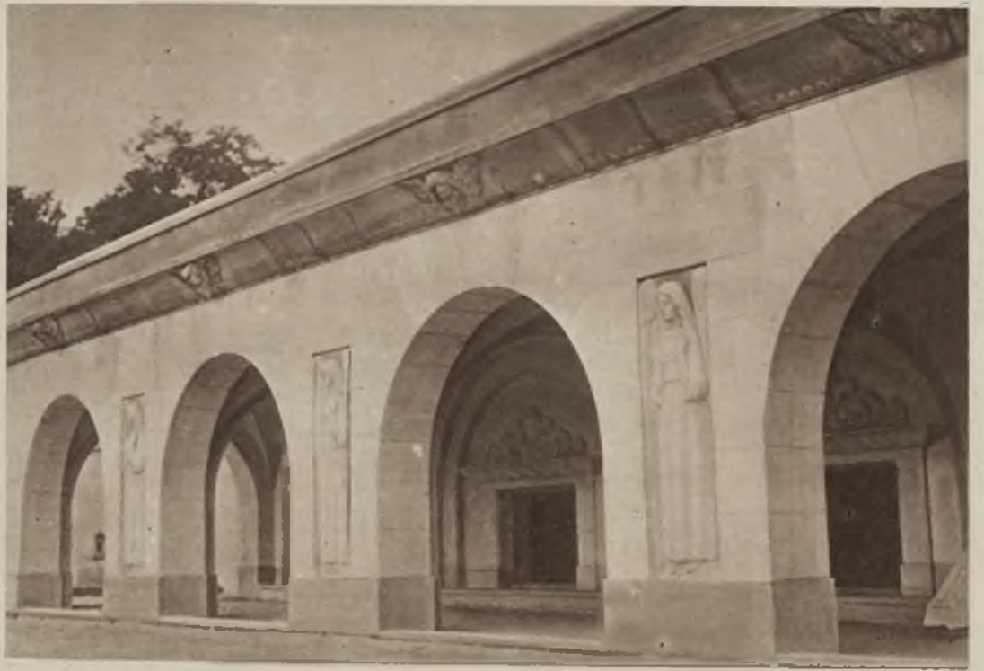
Katakumby na cmentarzu Obrońców Lwowa. U dołu: Ogólny widok cmentarza Obrońców Lwowa.