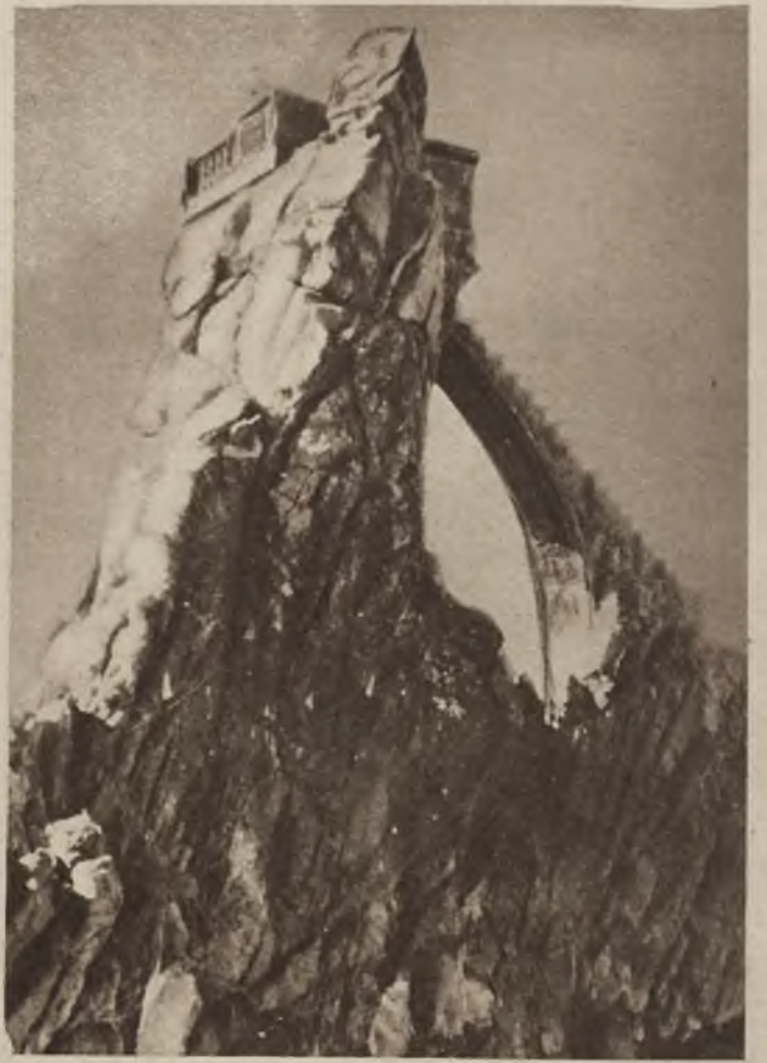
Na prawo: Most nad przepaścią prowadzący do punktu obserwacyjnego na wybrzeżu meksykańskim. Ze szczytu wypatrywano zbliżające się okręty.