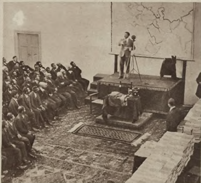
Król Amanullah po powrocie z Europy, opowiada swe wrażenia z dalekiej podróży członkom parlamentu. Odczyt ten był równocześnie transmitowany przez radio.