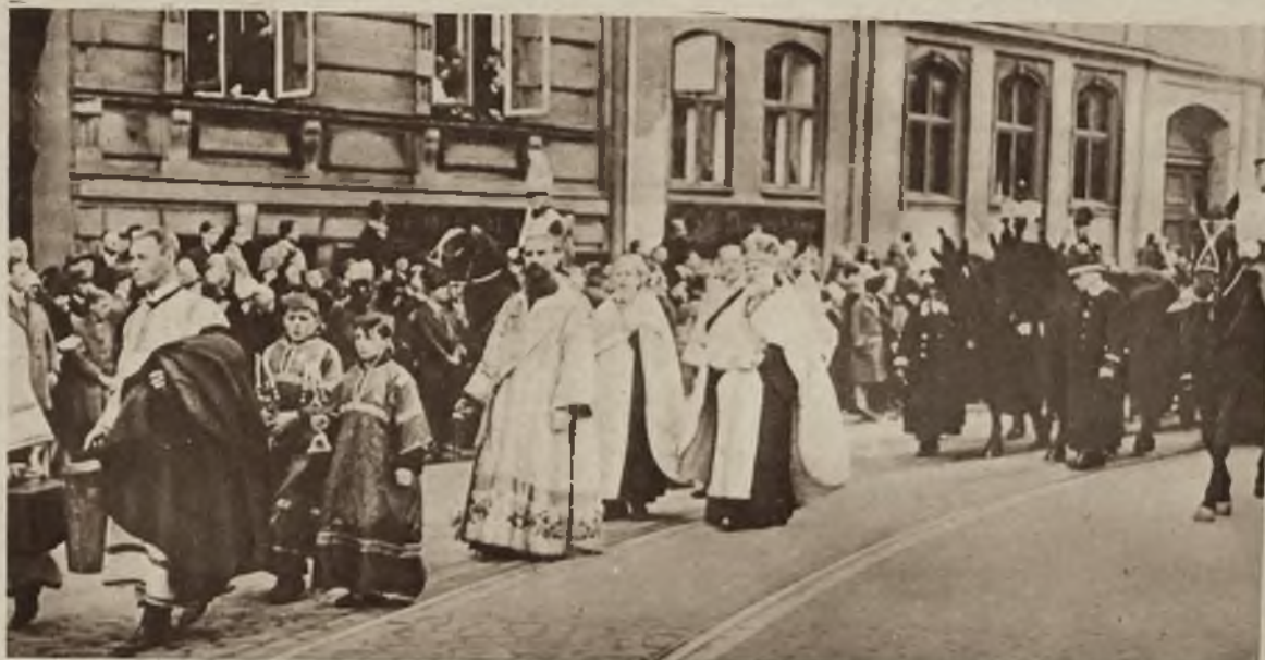
Uroczysty pogrzeb carowej wdowy Marji Teodorówny, która zmarła w Kopenhadze. Kondukt poprzedza duchowieństwo prawosławne.