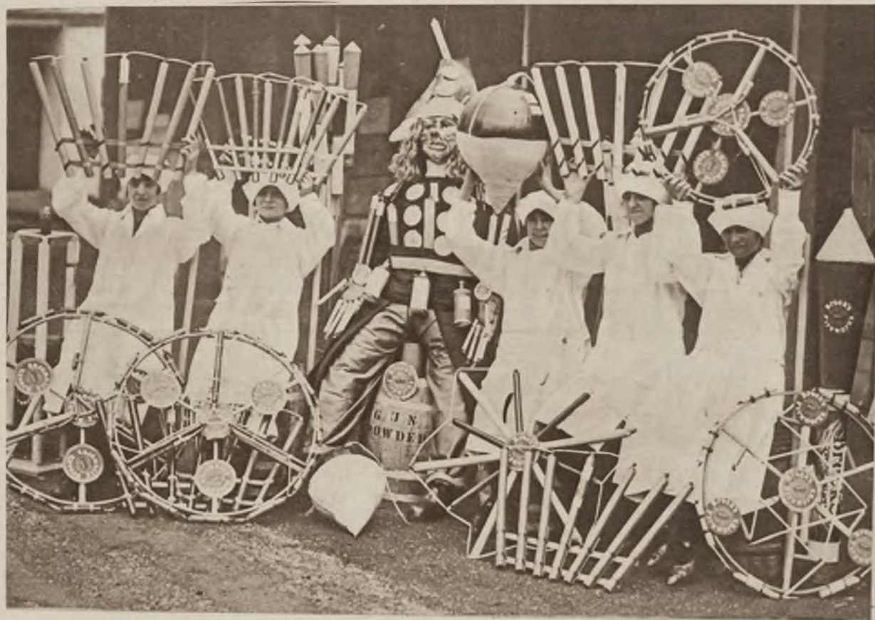
Ognie sztuczne przygotowane do festynu ludowego w Londynie na cześć bohatera narodowego angielskiego z XVII w. Guy Fawkes. W środku grupy stoi manekin mający przedstawiać Guy Fawkes'a.