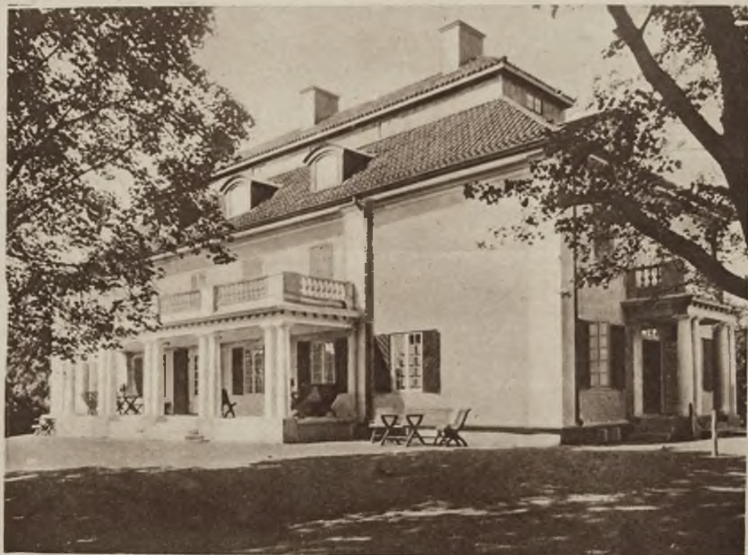
Dworek w Marhacks (Szwecja) w którym wielka szwedzka poetka i powieściopisarka Selma Lagerlof napisała swe największe dzieła, „Gosta Berling”, „Cudowna podróż” i.