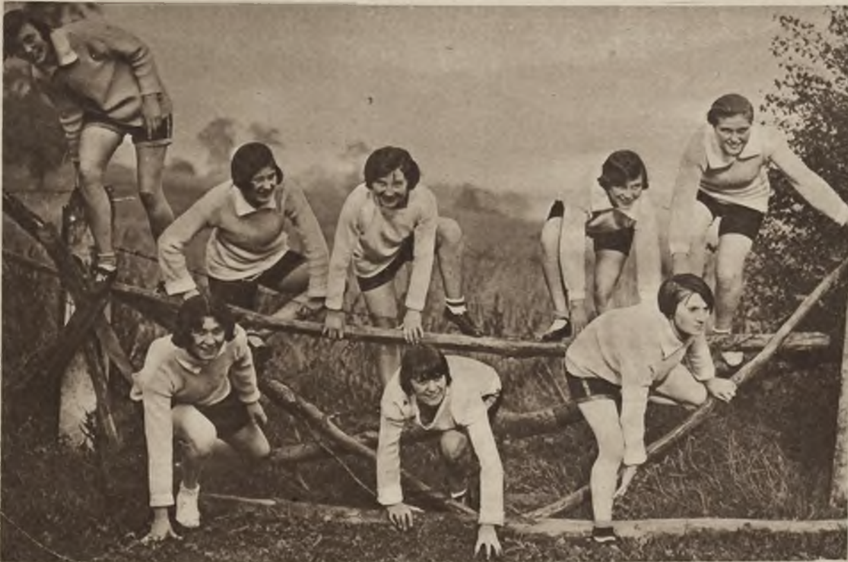
Rozpoczął się już w Anglii jesienny sezon biegów na przelaj w których czynny udział biorą także panie. Oto członkinie sportowego klubu londyńskiego biorą przeszkodę.