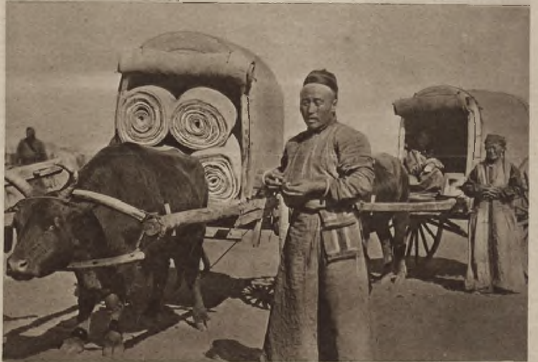
Wędrowna karawana kupców mongolskich, którzy obleżdżając swój wielki kraj zaopatrują tamtejszą ludność w artykuły pierwszej potrzeby.