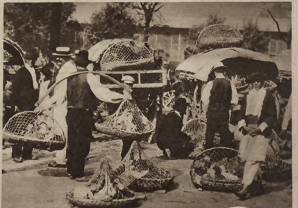
Targ na drób w Bukareszcie. Wieśniacy przynoszą kaczki i kury do miasta w płaskich koszykach przykrytych słotkami.