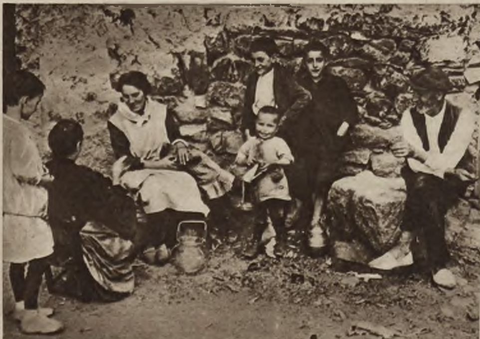
Charakterystyczne typy mieszkańców Andory, małej niezależnej republiki w Pirenejach, którą w całości zakupiła ostatnio grupa finansistów francuskich, celem urządzenia tam kasyna gry.