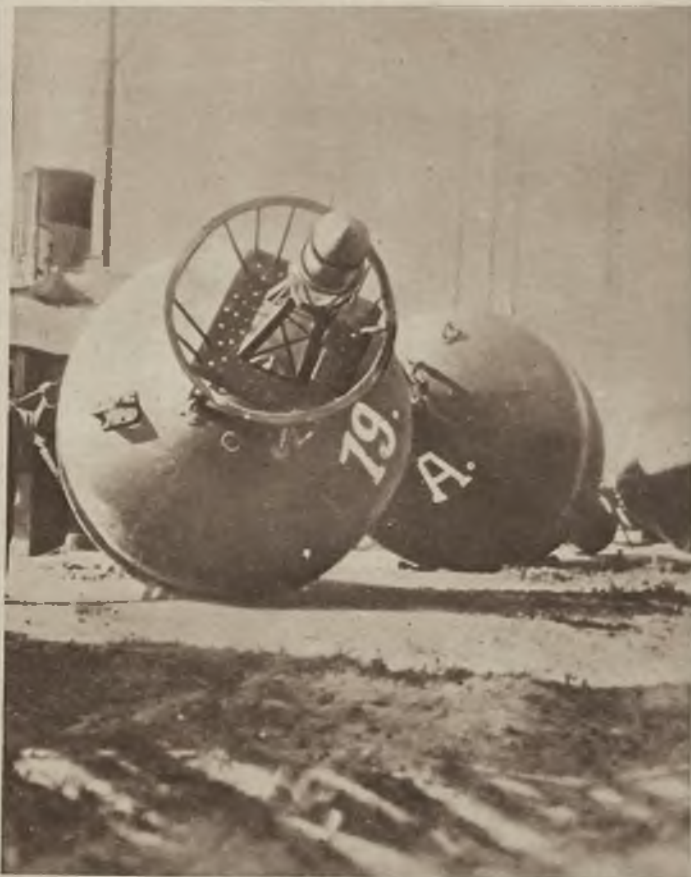
W wielkich portach mieszczą się na wodzie olbrzymie boje elektrycznie oświetlone dla orientacji okrętów. Oto dwie boje wyciągnięte na ląd w celu naprawy.