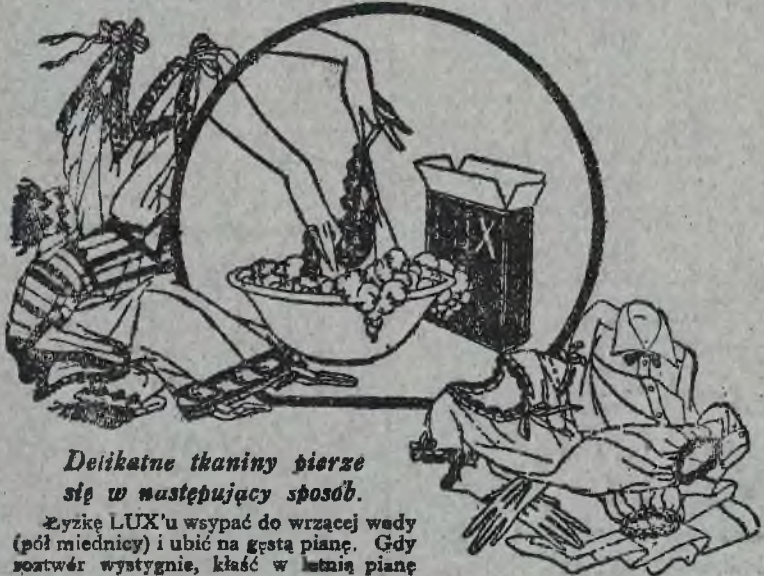
Delikatne tkaniny pierze się w następujący sposób.

Sztuczny jedwab wymaga specjalnej troskliwości przy praniu, gdyż będąc wilgotnym jest specjalnie wrażliwym i z łatwością może być uszkodzonym.