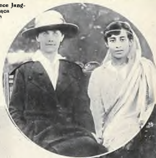
W kole: Jedna z licznych hinduskich „Rani” (królowa) w towarzystwie swej europejskiej opiekunki.