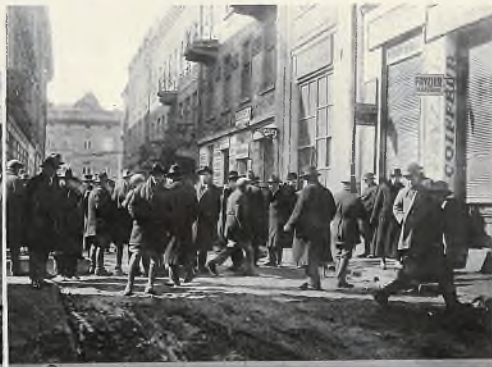
Typy lwowskie: Na lewo: Śmietniczarki na Rynku. Na prawo: Czysta giełda podczas pracy na ul. Legionów.