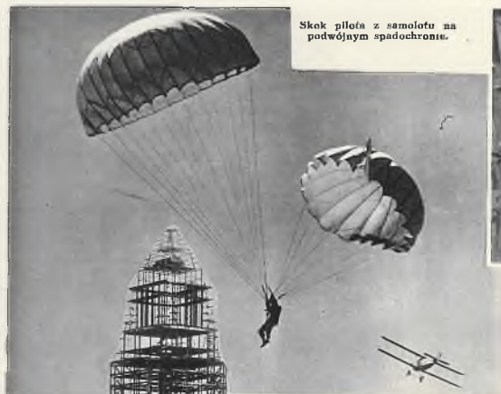
Skok pilota z samolotu na podwójnym spadochronie.