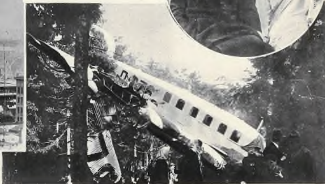
Mimo to, tak pilot jak i pasażerowie wyszli bez szwanku.