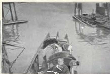
Dzłonki na rzece Jang-tsekiang, wioząca ciała poległych Chińczyków.