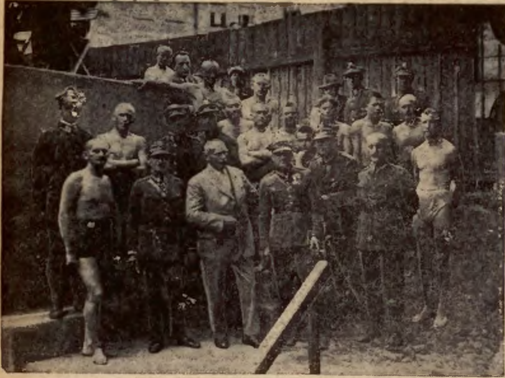
Dnia 6 i 7 b. m. odbyły się zawody pływackie o mistrzostwo okręgu krakowskiego w pływalni Parku Krakowskiego. Zdjęcie nasze przedstawia grupę zawodników wojskowych.