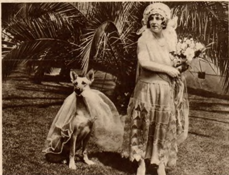
Sliczny pies wilczur, który pełni przy swojej pani obowiązki pełnego kurtuazji pazia i nosi za nią jej piękny welon.