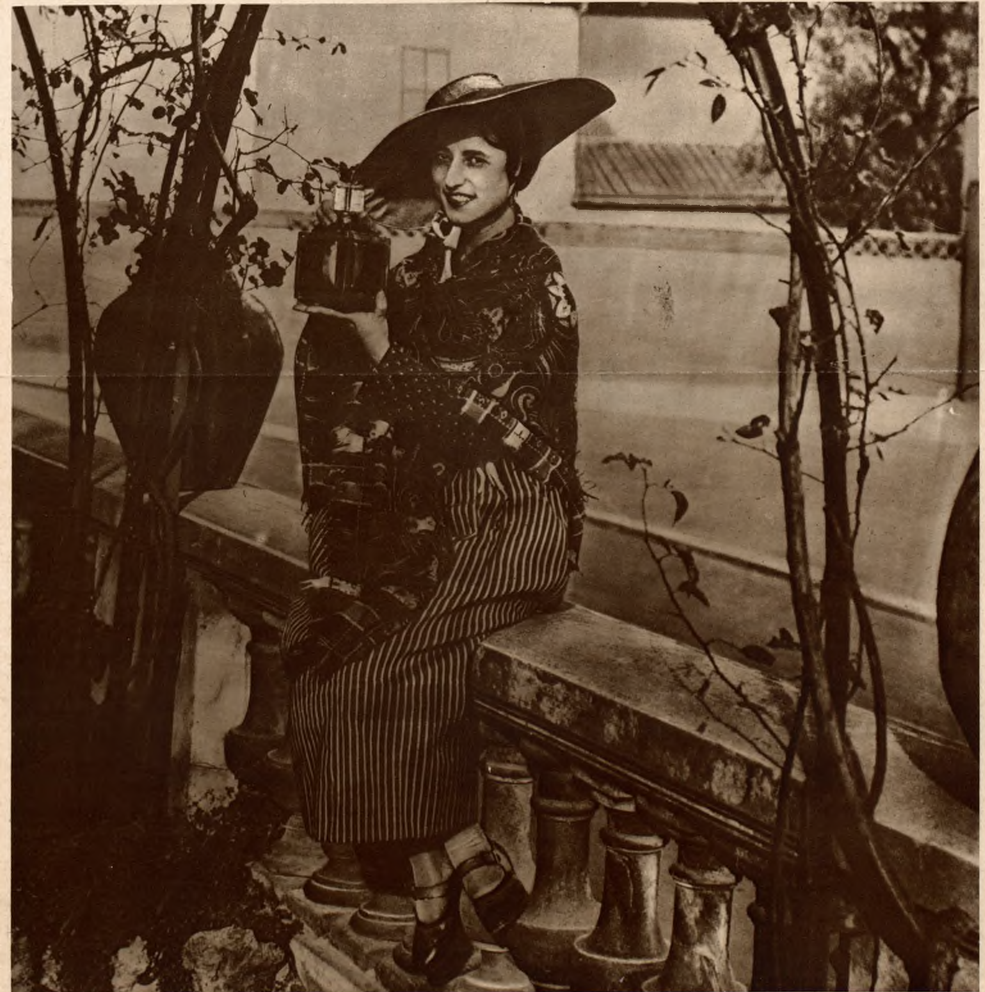
Miasteczko Grasse na Rivierze francuskiej znane jest jako „ojczyzna perfum“ na całym świecie. Oto urocza robotnica z fabryki Coty'ego w Grasse w oryginalnym narodowym stroju, trzymająca flakon esencji kwiatowej mieszczący się w małej ręcznej latarce.