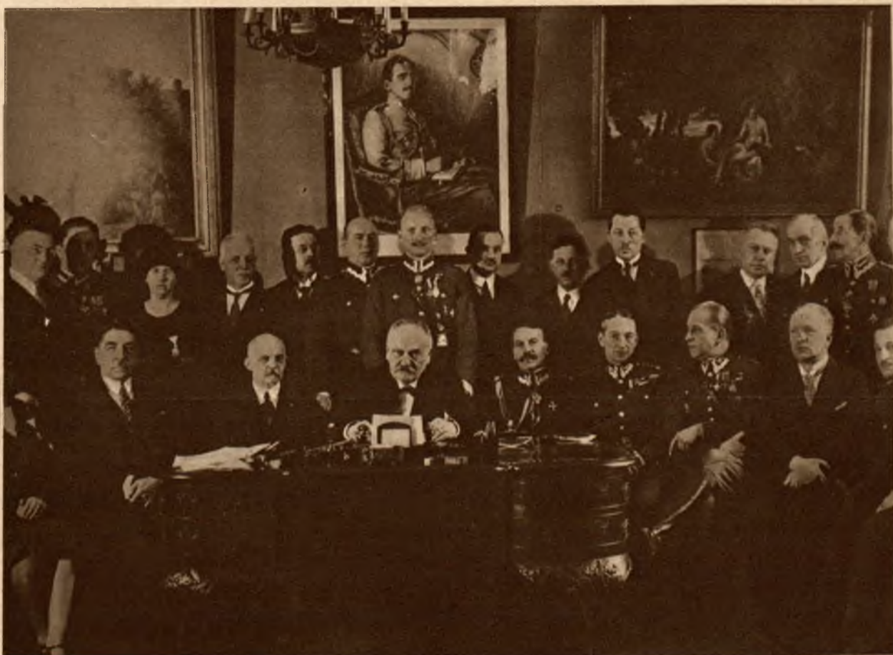
W poselstwie jugosłowiańskim w Warszawie odbyło się posiedzenie pierwszych kawalerów udekorowanych orderami jugosłowiańskimi.