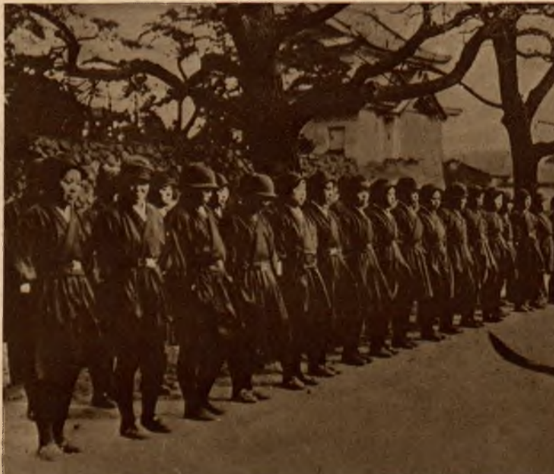
Emancypacja kobiet w Japonji poszła tak daleko, że kobiety tworzą ochotnicze oddziały straży ogniowej.