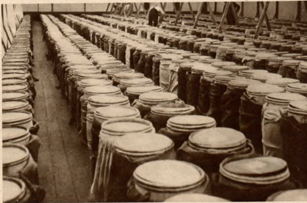
Wystawa „maślana” w Danji. Na zdjęciu widać zapas najlepszego masła, przedstawiający wartość 300.000 koron duńskich.