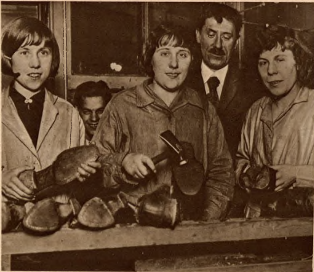
Pierwsze w Londynie kobiety, które zdobyły tytuł majstrów szewskich i założyły sobie pracownię szewską.