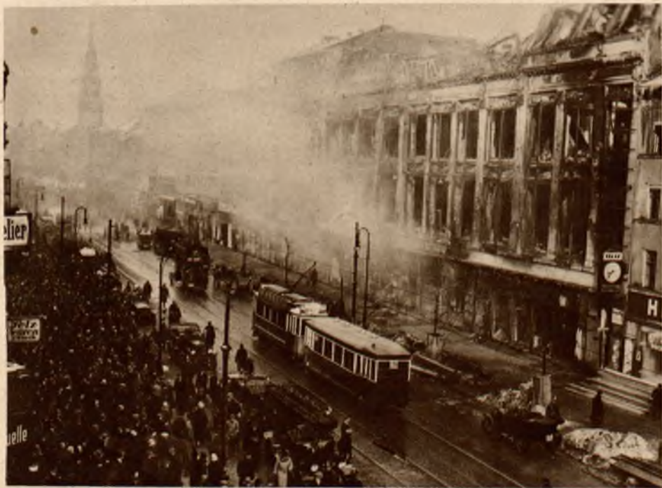
Olbrzymi dom towarowy Tietza w Berlinie spłonął doszczętnie. Na zdjęciu widzimy zgłiszczą gmachu, do których zbliżyć się nie można z powodu straszliwego gorąca bijącego od rozrzuconych murów.