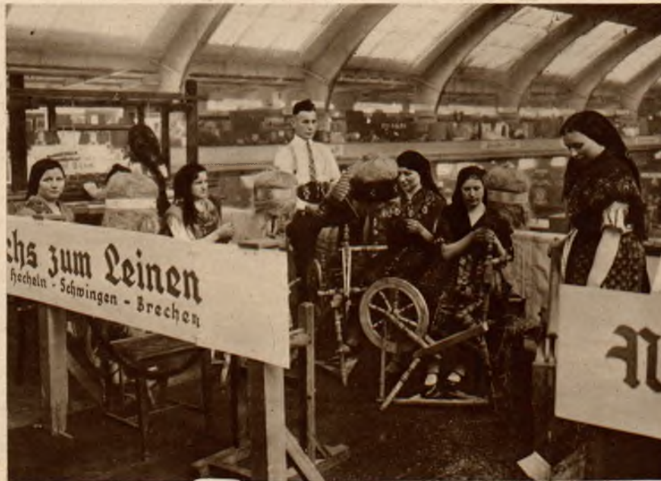
Na wystawie gospodarczej w Berlinie można obok najświetniejszych wynalazków z dziedziny gospodarstwa oglądać także przeróbkę lnu w przemyśle domowym taką jak za „dawnych, dobrych czasów”.