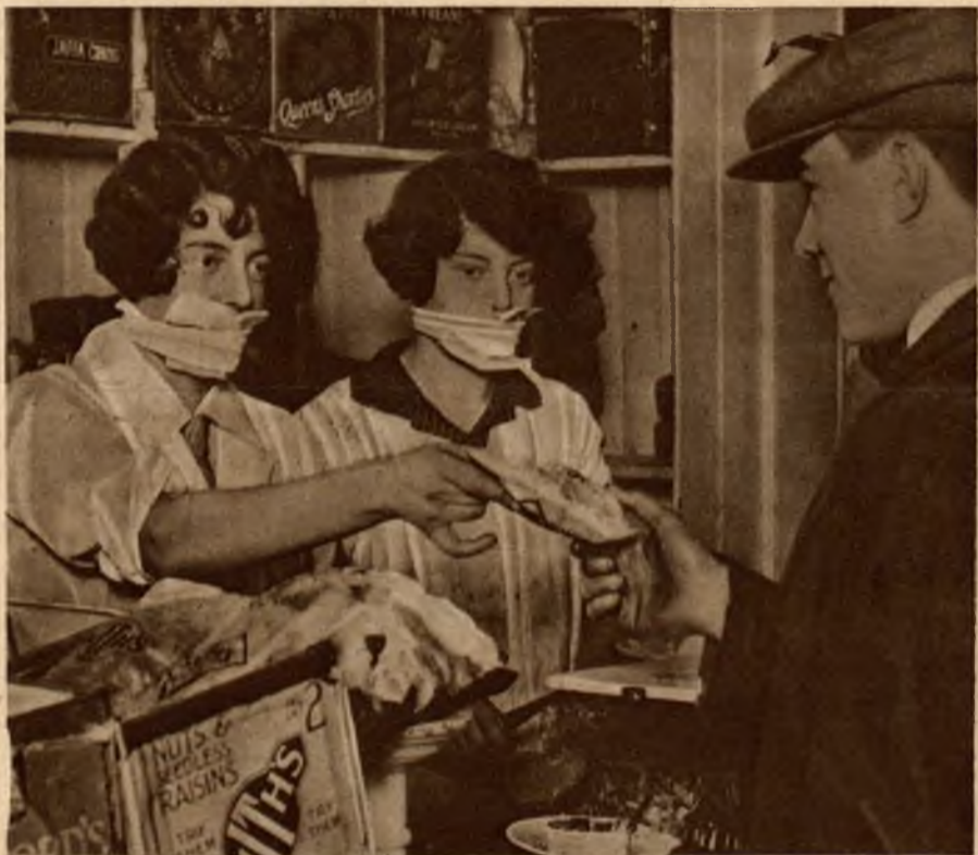
Ażby ochronić się przed grypą, panującą obecnie w Anglii, panny sklepowe noszą opaski na ustach zabezpieczające przed zarazkami przykryj choroby.