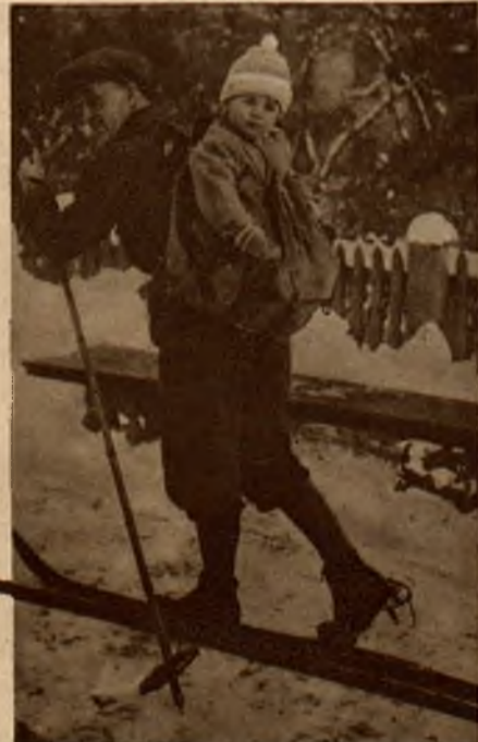
Dobry tatuś, nie chcąc się rozstać z swym synkiem, zabiera go na małe wycieczki narciarskie jako bażąc umieszczony w plecaku.