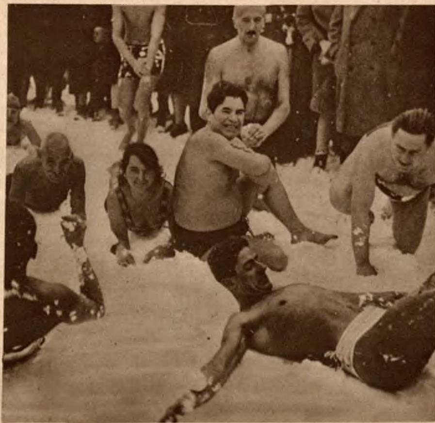
Nowy prąd higieny pod hasłem „Przeziębaj się codziennie” ma wielu zwolenników w Wiedniu. Oto grupa „czcicieli zimna” zażywających śnieżnej kąpieli.