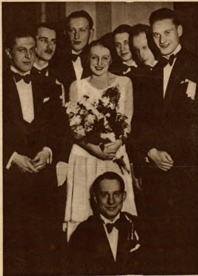
W sali Tow. Techników w Warszawie odbył się Dancing-Bridge urządzony przez Związek Słuchaczy Architektury.