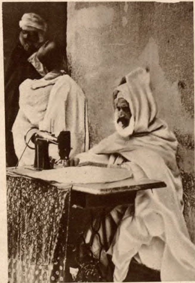
Rozpowszechnienia wynalazków nowoczesnej techniki w egzotycznych krajach dowodzi niniejsza fotografia przedstawiająca Araba w Biskrze szyjącego na maszynie.