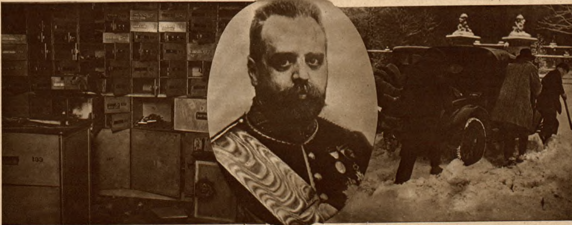
Do skarbcza jednego z wielkich banków berlińskich włamali się złoczyńcy przez podziemny podkop i splądrowali szereg schowków.