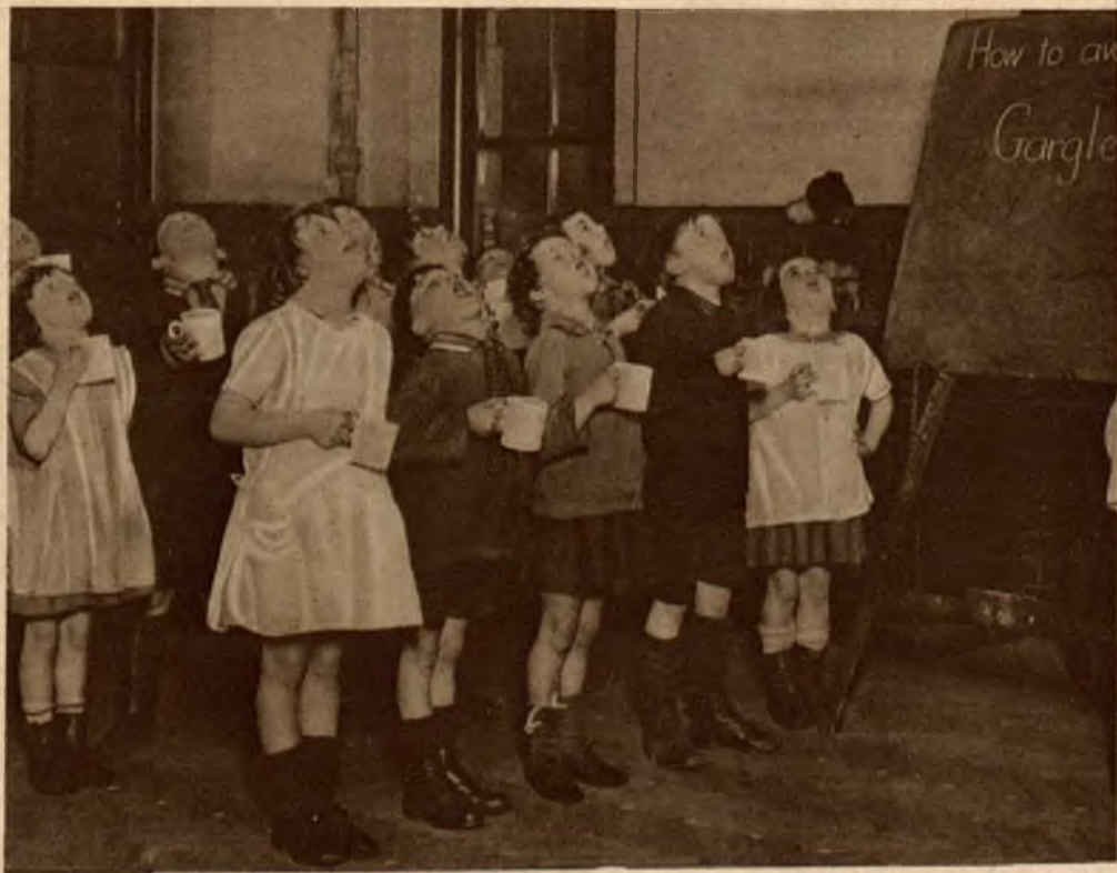
W tym samym celu, zarządono w szkołach angielskich, aby dzieci szkolne w przerwach pomiędzy godzinami nauki płukały gardło antyseptycznym roztworem.