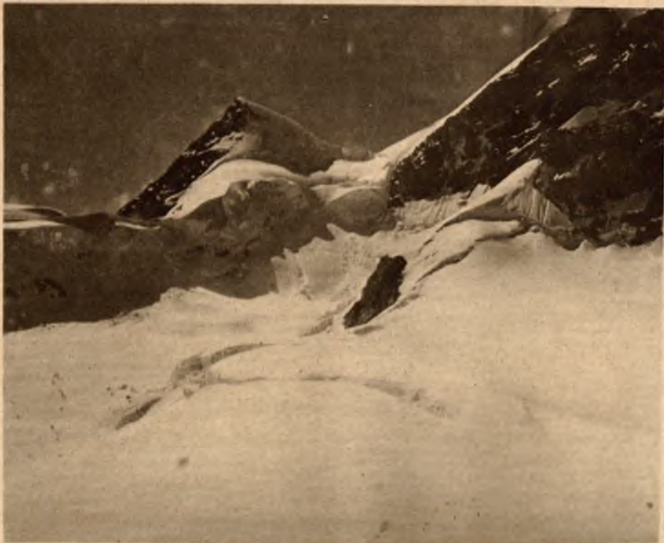
Widok na „Silberhorn“ z kolejki alpejskiej powyżej Klein-Scheidegg, w drodze do Jungfrau.