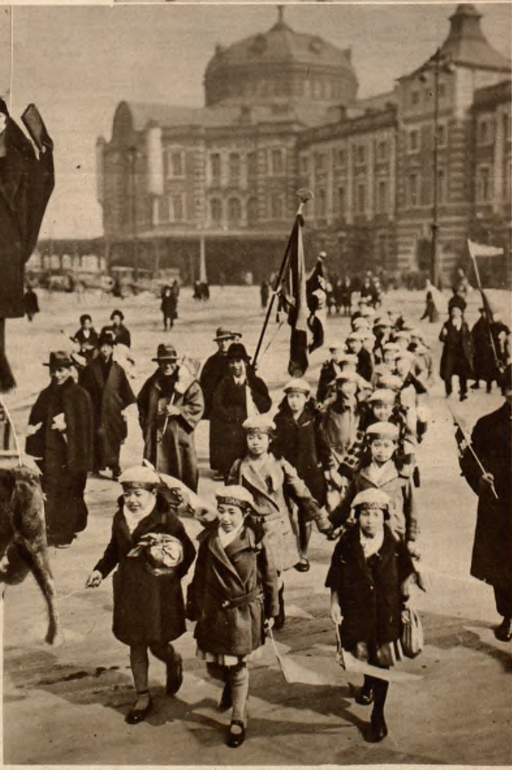
Japoński balet dziecięcy opuszcza pałac cesarski w Tokio, gdzie odbyło się specjalne przedstawienie dla dworu.