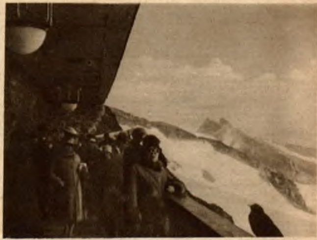
„Gospoda góraska“ w „Jungfraujoch“ (3457 m.).