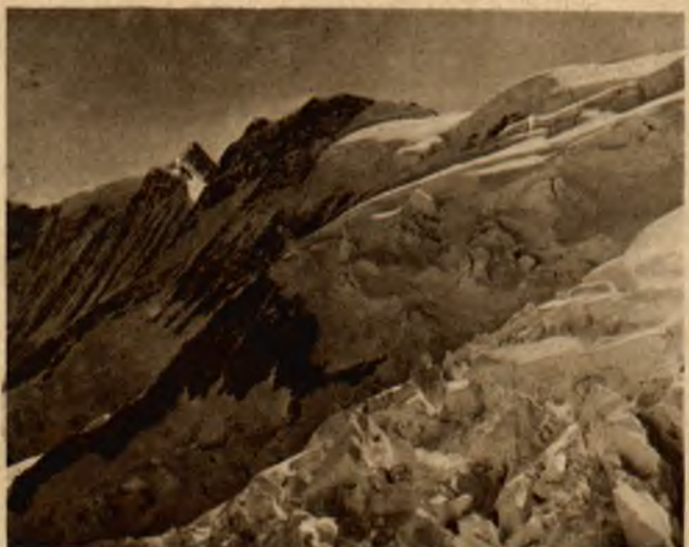
„Morze lodowców“ (Eismeer), widziane ze stacji tej samej nazwy po drodze do „Jungfraujoch“.