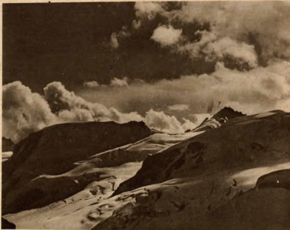
Widok na „Gletscherhorn“ (3982 m.) z „Jungfraujoch“.