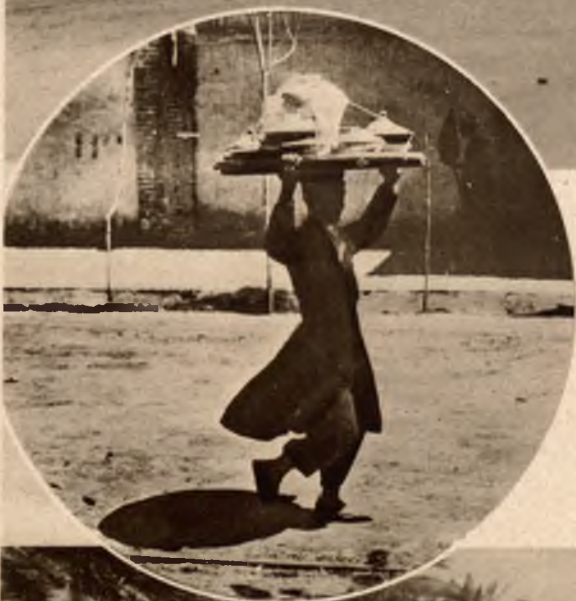
Obrazki z Teheranu. U góry gmach magistratu. (Pod parasolem stoi policjant). Na lewo w kole: Chłopiec niosący na głowie potrawy z restauracji.