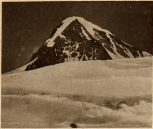
„Mnich“ (4105 m.).