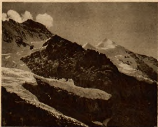
Widok na „Eiger“ i „Mnicha“.