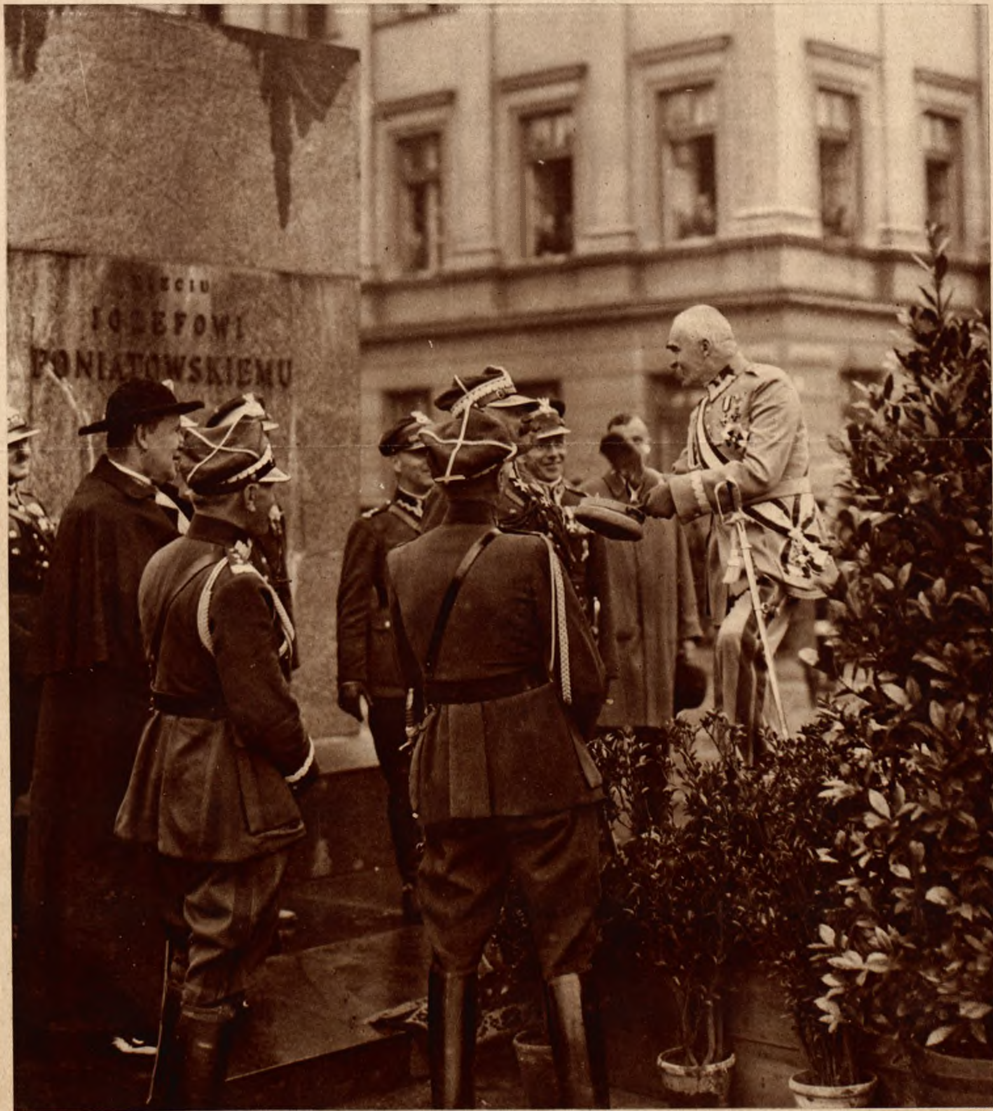
Marzałek Piłsudski na uroczystości 15-lecia powstania kawalerji polskiej.