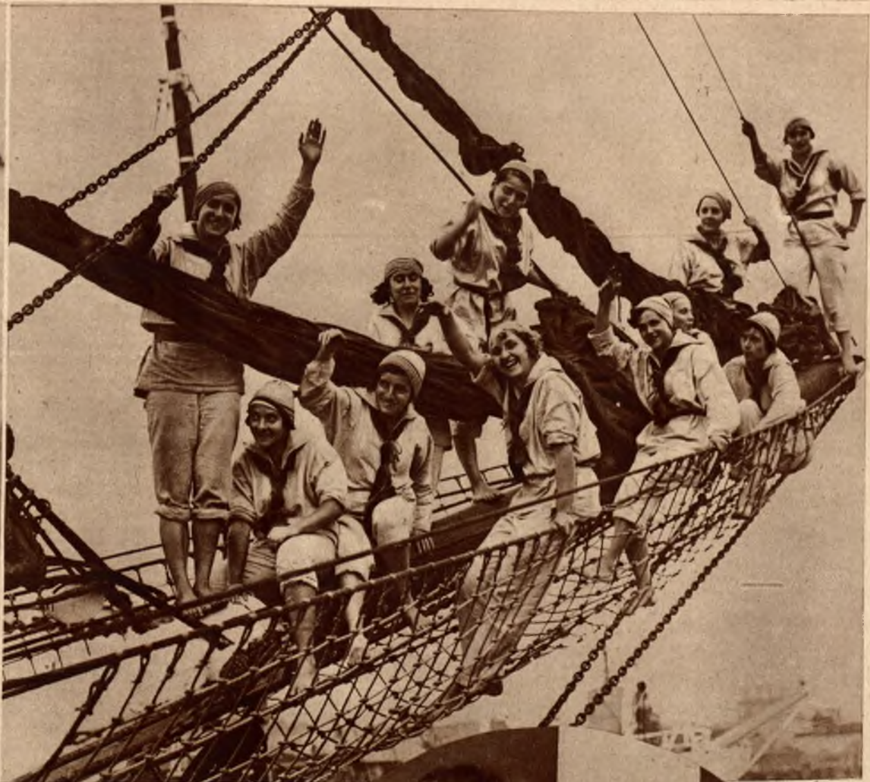
Na statku „Alcyon” w Deauville założono pierwszą szkołę żeglarstwa dla kobiet.