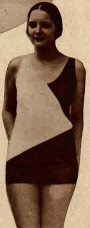
Na prawo: Kostjum kąpielowy nagrodzony pierwszą nagrodą na konkursie w Deauville.