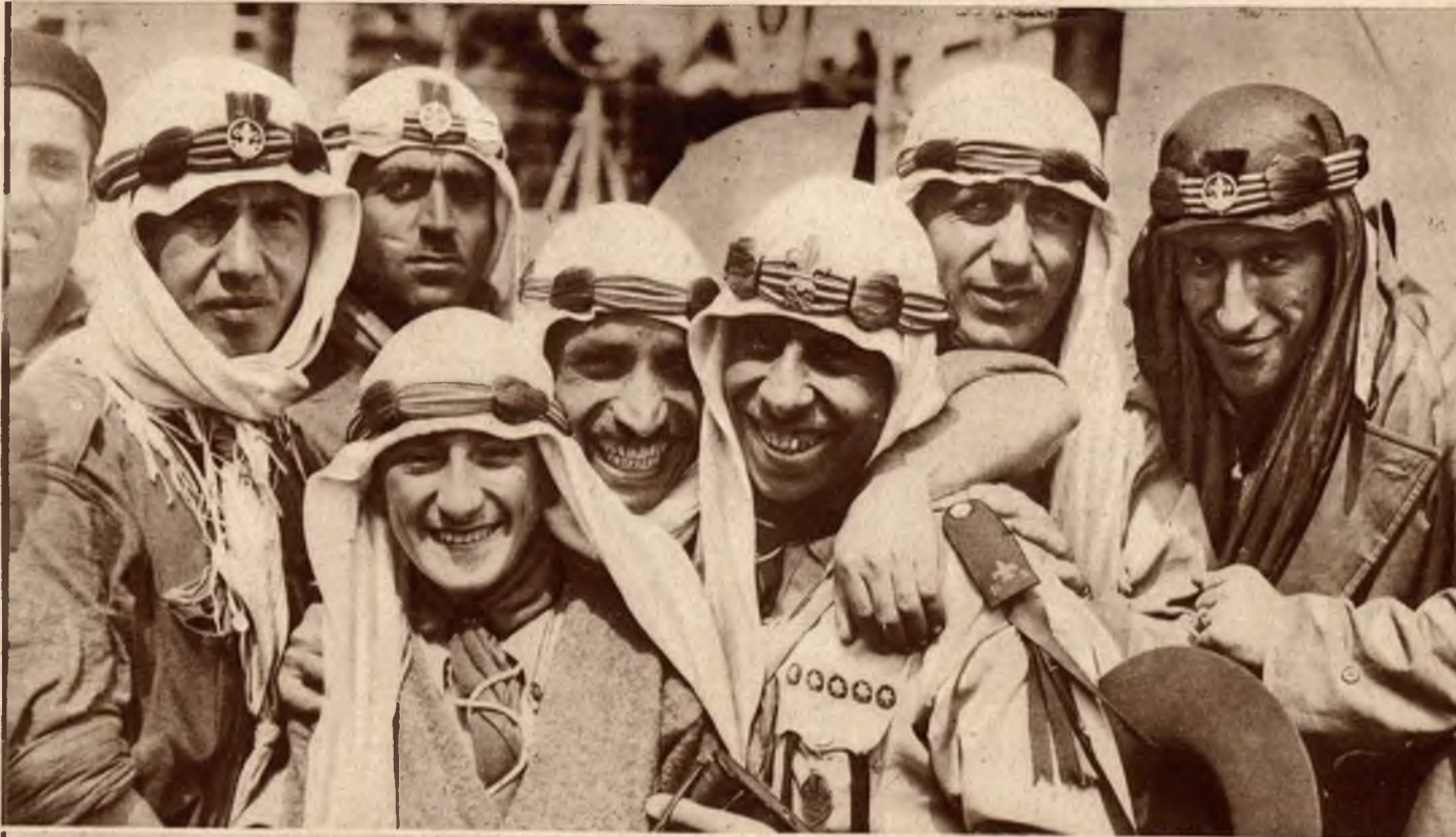
Na lewo: Harcerze arabscy z Palestyny.