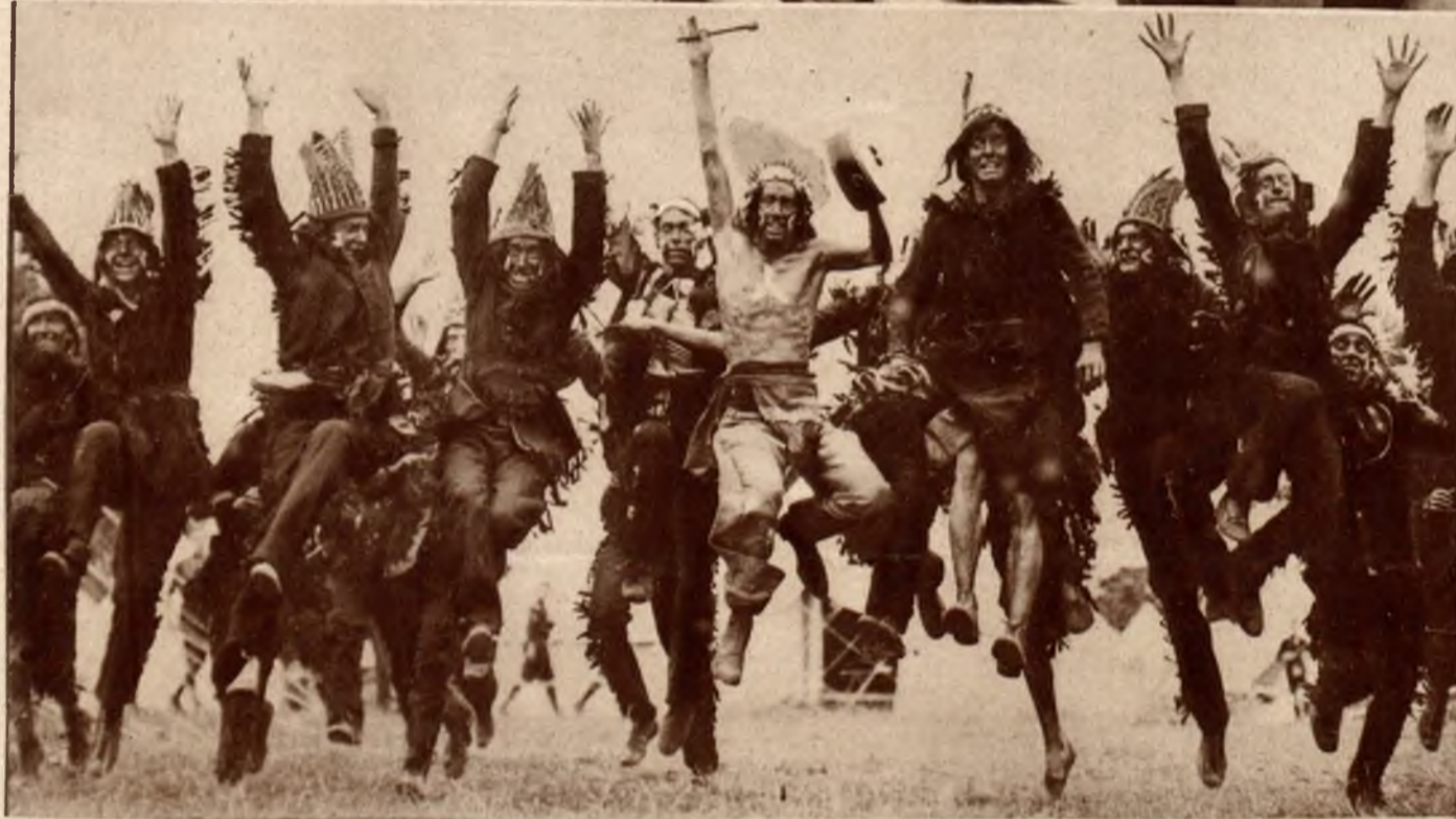
Harcerze z Kanady wykonują indyjski taniec wojenny.