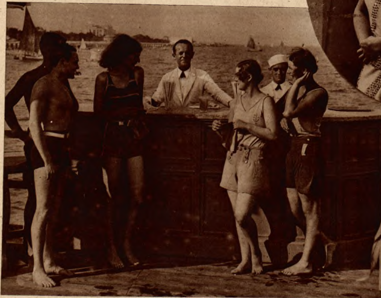
Na lewo: Bar ustawiony dla wygody gości na samym brzegu morza na Lido.