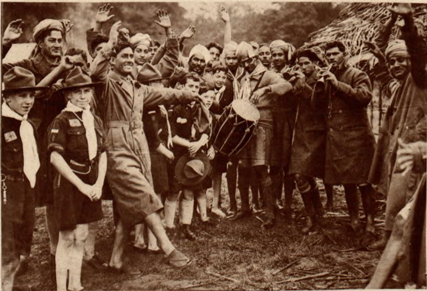
Na lewo: Harcerze z Pendżabu (Indje ang.) wykonują tańce hinduskie.