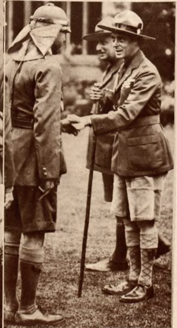
Książę Walji w obozie harcerskim.