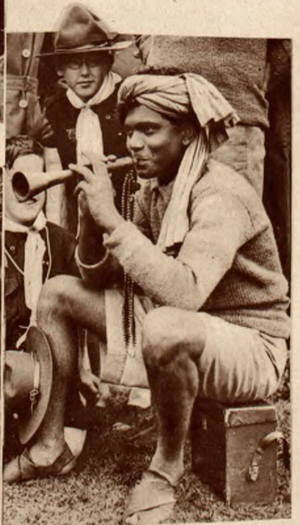
Harcerz z wyspy Ceylon popisuje się grą na fujarce.