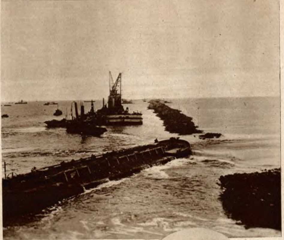
Od wielu lat pracuje rząd holenderski nad zasypaniem odcinka morza zwanego Zuidersee. Obecnie ukończono główny wał ziemny stanowiący tamę (na prawo). Na lewo widzimy jeden z olbrzymich kranów, sypiących wciąż nowe masy ziemi w fale morskie.