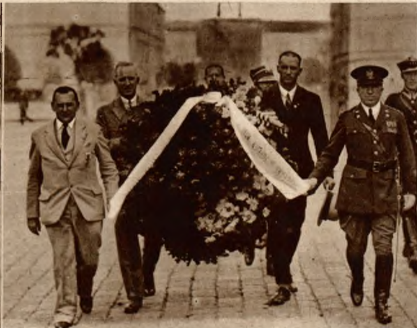
Data 6 sierpnia delegacja weteranów armji Stanów Zjedn. Ameryki Półn. wraz z attache wojsk. mjr. Yałgarem złożyła wieniec na grobie Nieznanego Żołnierza.