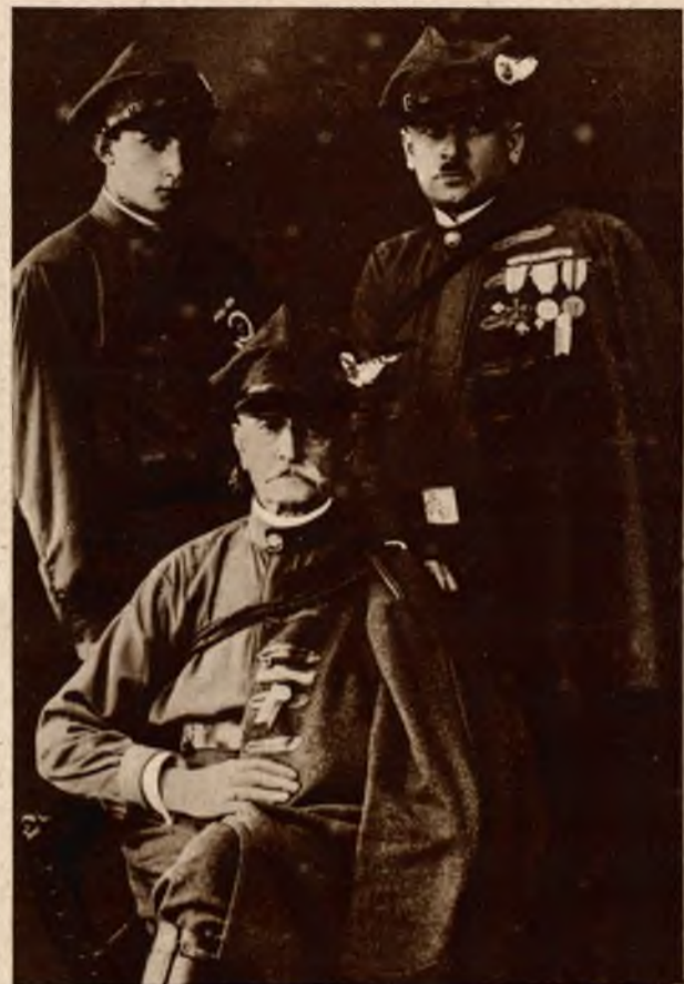
Trzy pokolenia. Członkowie Sokola Macierzy we Lwowie. Dziadek, syn i wnuk.