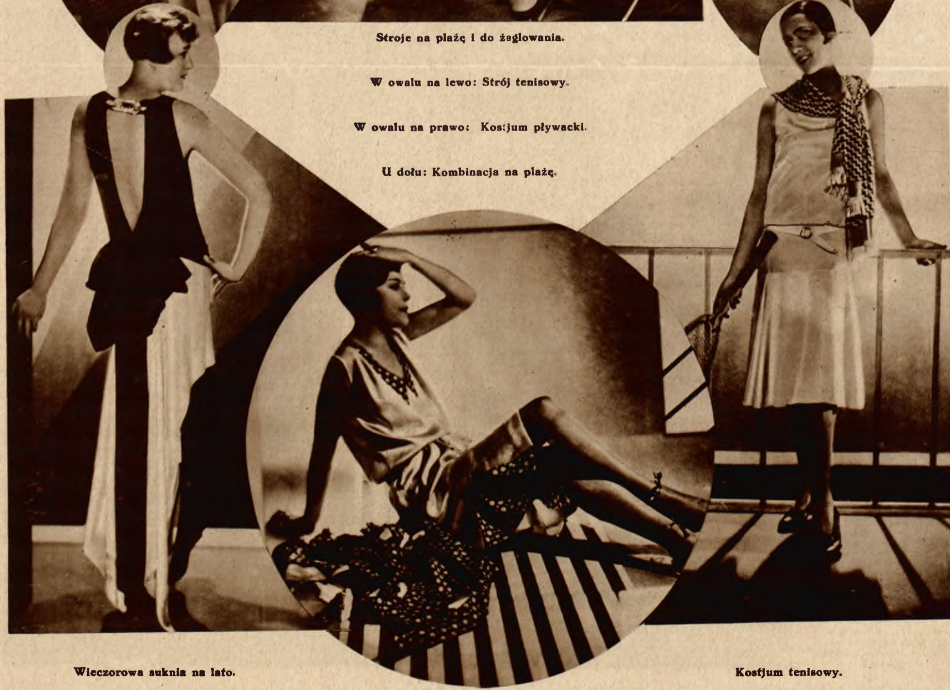
Wieczorowa suknia na lato.