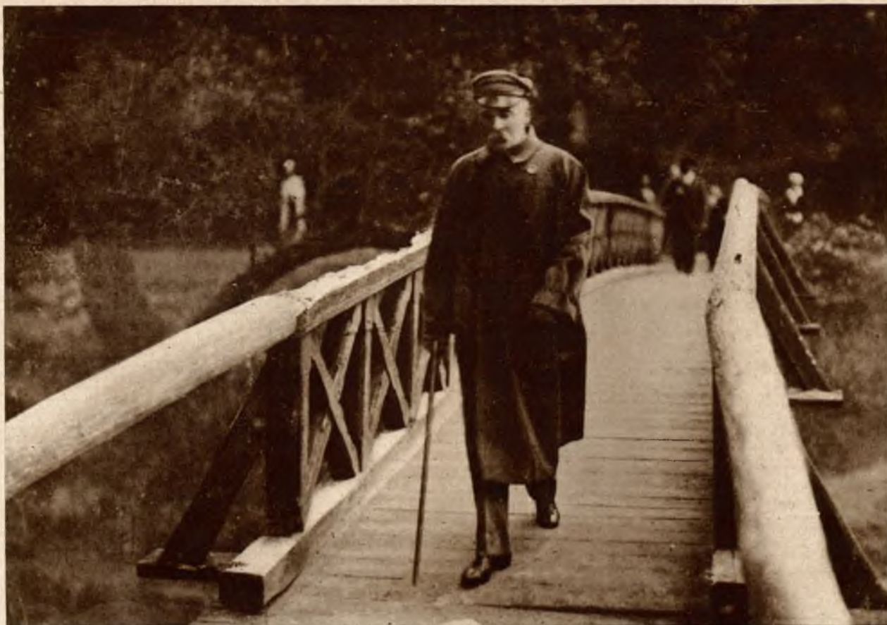
Marszałek Piłsudski na spacerze w starym lesie dębowym w Druskiennikach.