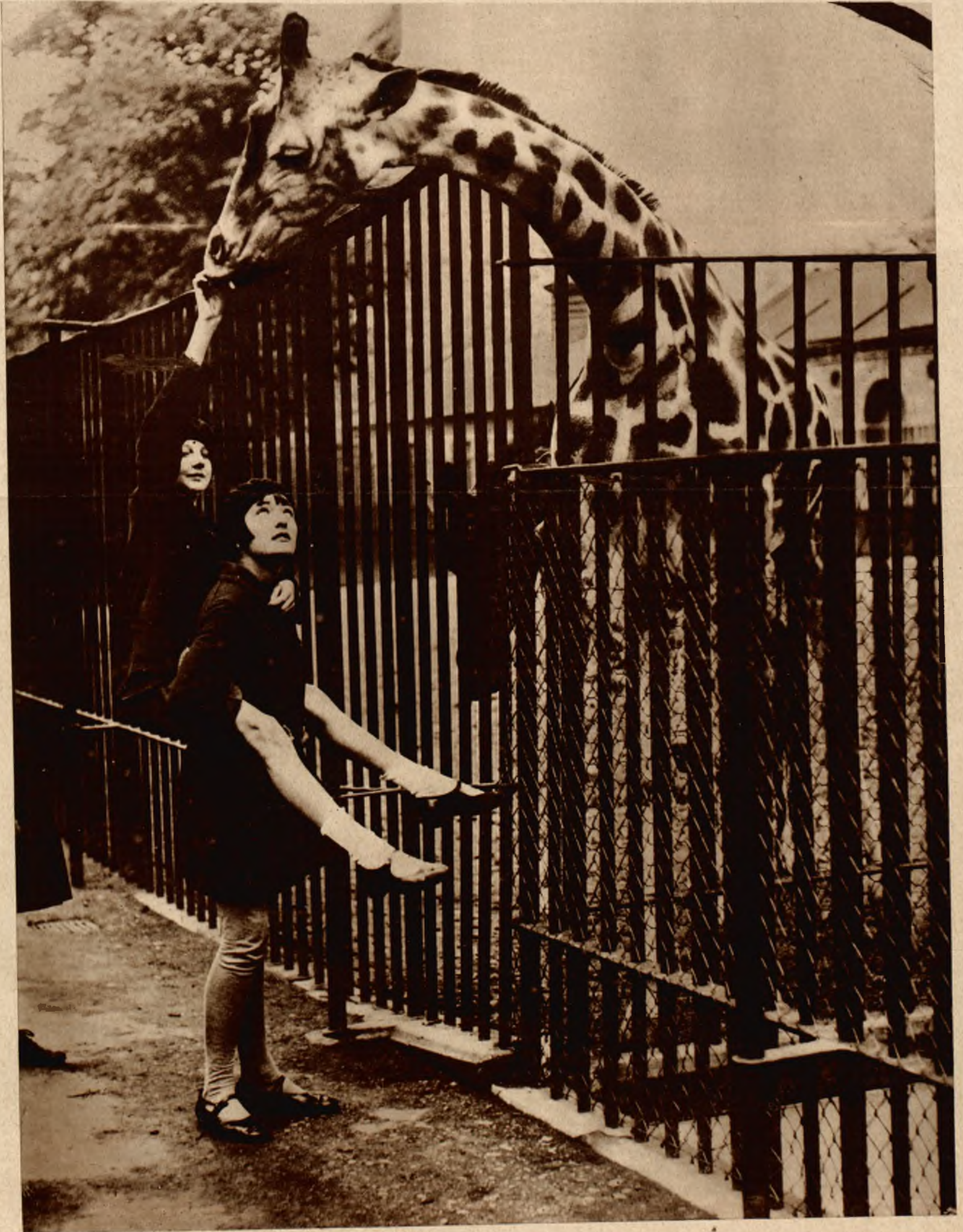
Wzmógłony w dnie świąteczne ruch w zwierzyńcu londyńskim, jest mile widziany przez zwierzęta, które nie darmo spodziewają się, że kieszenie odwiedzających nie są próżne. Oto dwie dziewczynki za pomocą „żywej drabinki” karmią swą ulubioną żyrafę, rozmaitemi smakołykami.