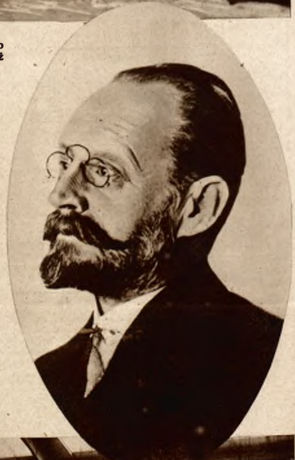
Na prawo: Prof. dr. Karol Auer, wynalazca zarzącego płomie- nia gazowego, zmarł na swoim zamku Welsbach w Austrii w 72 r. życia.