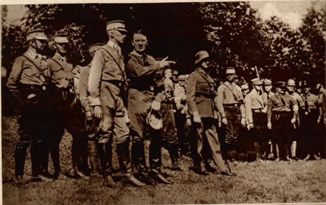
Na lewo: Scena z parady niemieckiej partji narodowej w No- rymberdze. Z od- słoniętą głową ośla- wiony Hitler, do- wódca nacjonalia- tycznych bojówek.