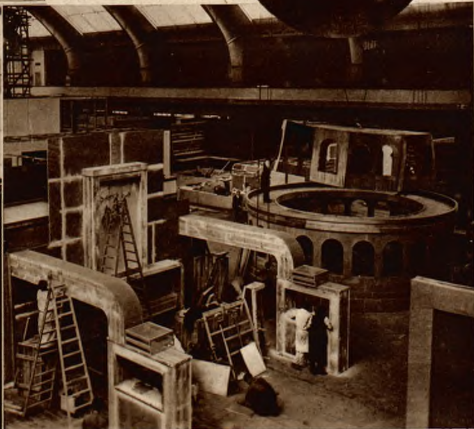
W Berlinie ma w najbliższych dniach nastąpić otwarcie międzynarodowej wystawy reklamy. Na lewo model średniowiecznego miasteczka znajdujący się na wystawie. Na prawo widok budowy jednej z sal wystawowych.