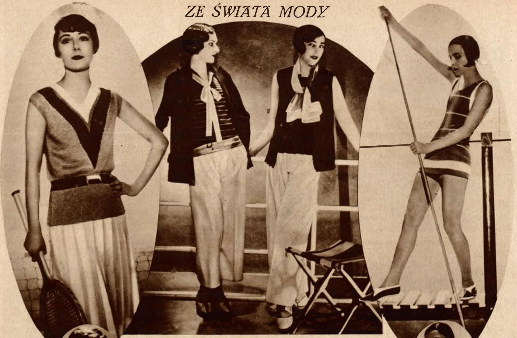
Stroje na plażę i do żeglowania.