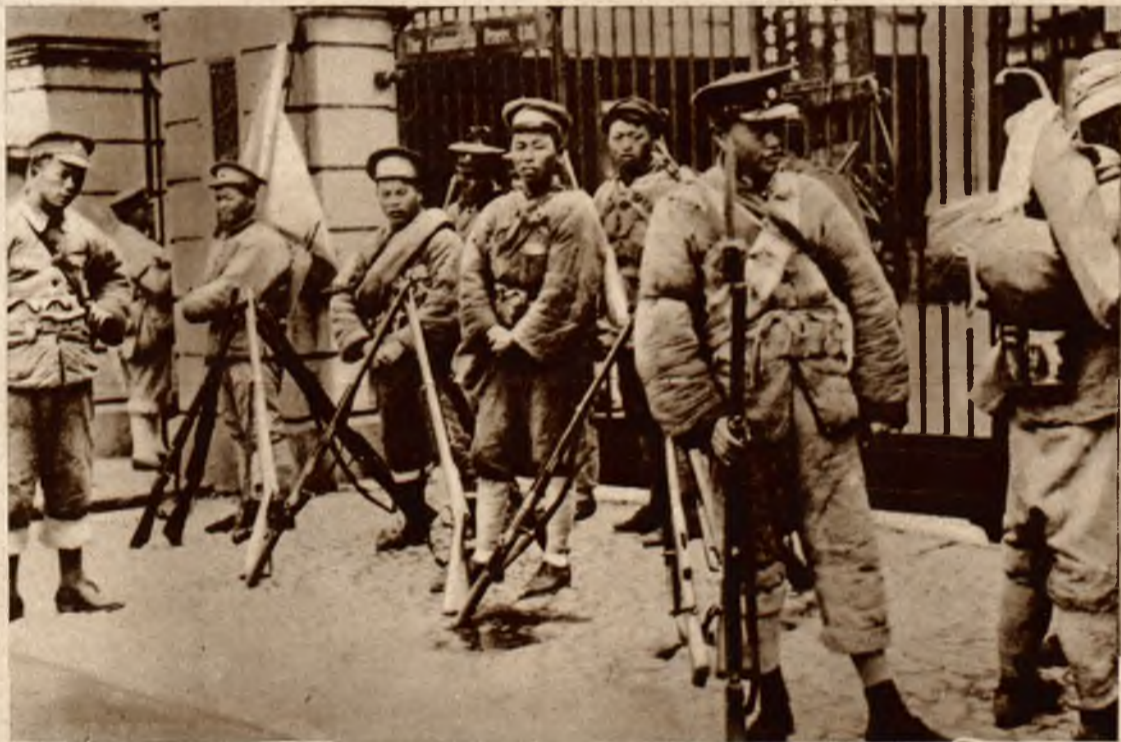
Z konfliktu sowiecko-chińskiego. Gwardja marszałka Czankajczeka przed jego pałacem w Pekinie.