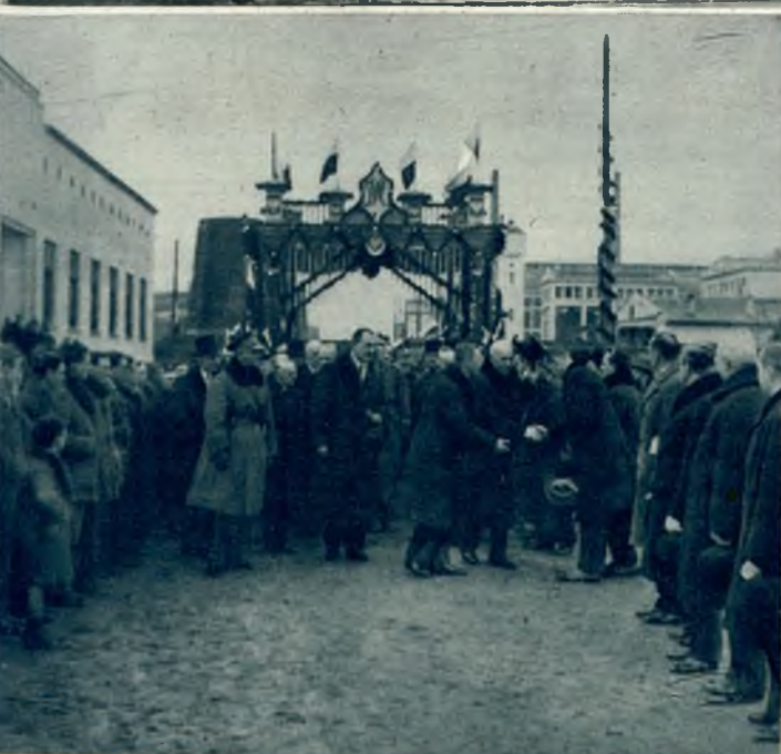
Na lewo: Uroczyste otwar- cie państwowej fa- bryki Związków Azotowych w Moś- cicach. P. Prezyd. witany uroczyście w bramie tryum- falnej przez oso- bistości ziemi tar- nowskiej.