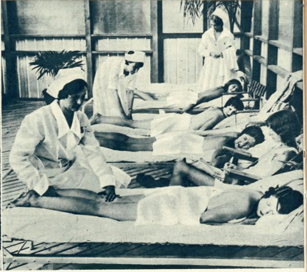
Zdjęcia z „solarium” w Miami Beach na Florydzie. Na lewo moment przed naświetlaniem: krótkie spojrzenie na fotografa. Na prawo: masaż po naświetlaniu.