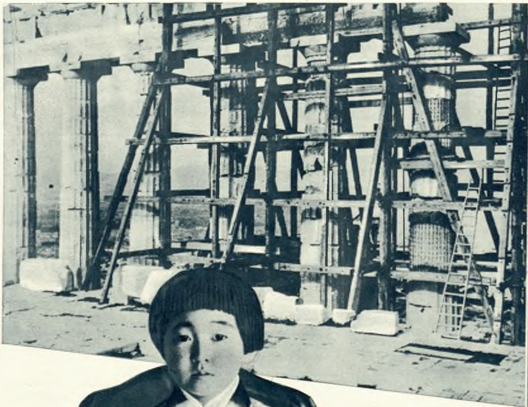
Na Akropolis rozpoczęto obecnie na szeroką skalę zakreślona akcję renowacyjną. Zdjęcie nasze przedstawia kolumnadę Parthenonu, świątyni poświęconej Atenie.