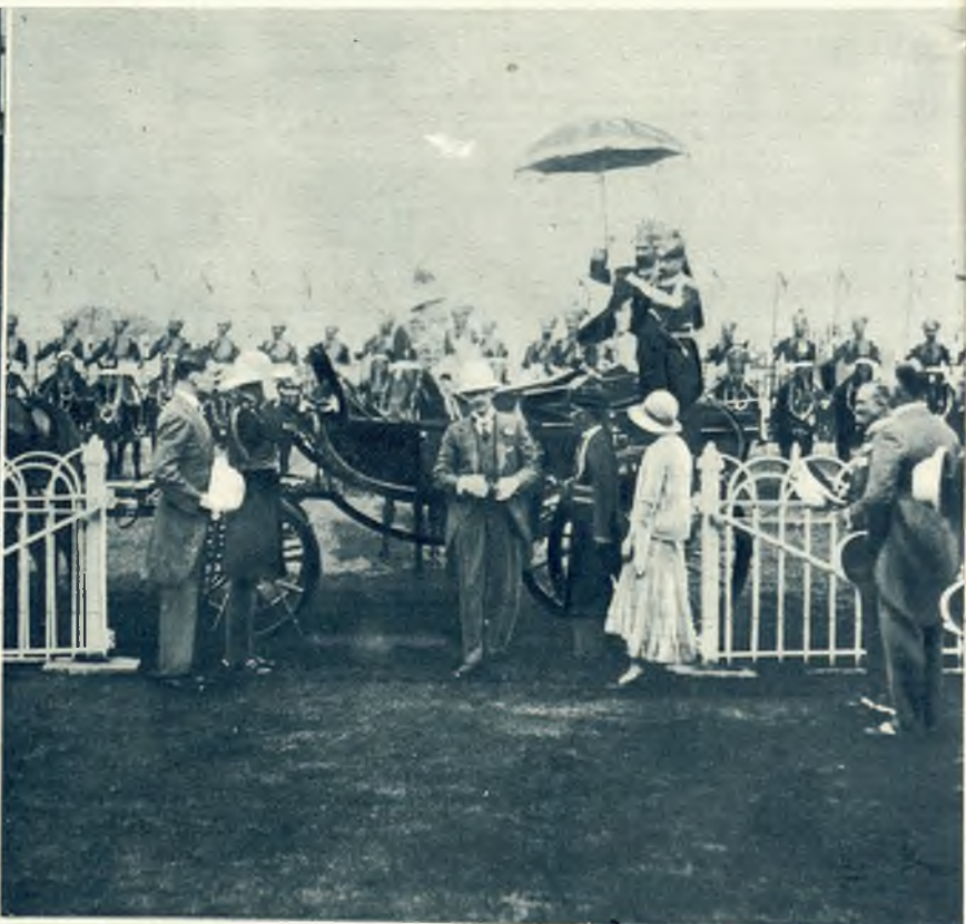
Wicekról Indyj przybywa na wyścigi konne w Kalkucie. Jako reprezentant cesarza witany jest z dworskim ceremonjałem.