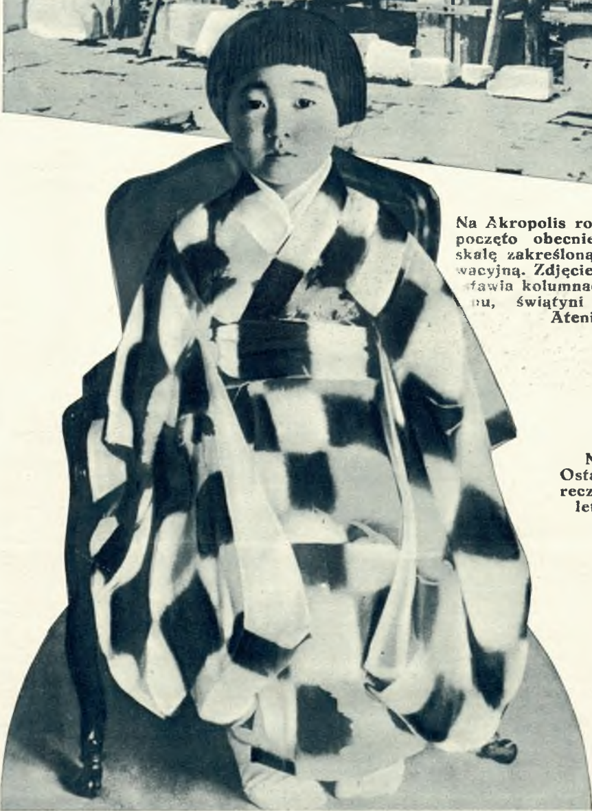
Na lewo: Ostatnie zdjęcie najstarszej córki cesarza japońskiego 5-letniej księżniczki Terunomija.