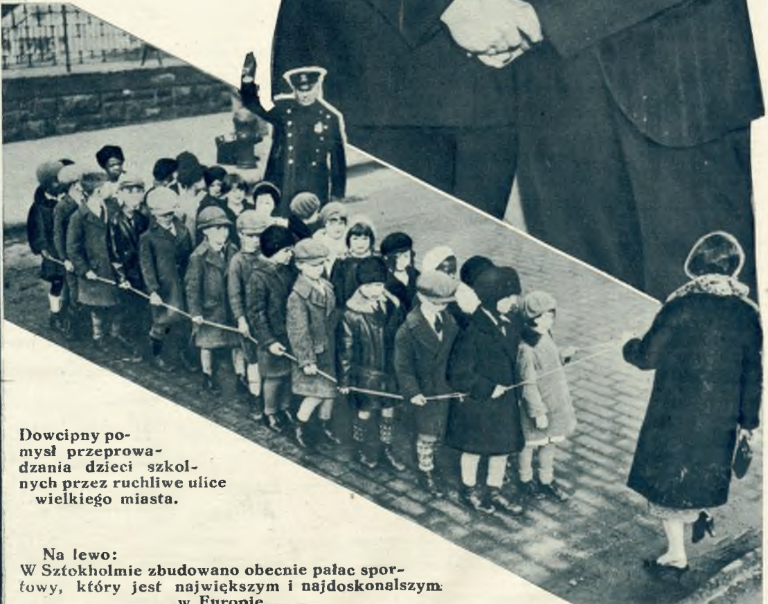
Dowcipny pomysł przeprowadzenia dzieci szkolnych przez ruchliwe ulice wielkiego miasta.