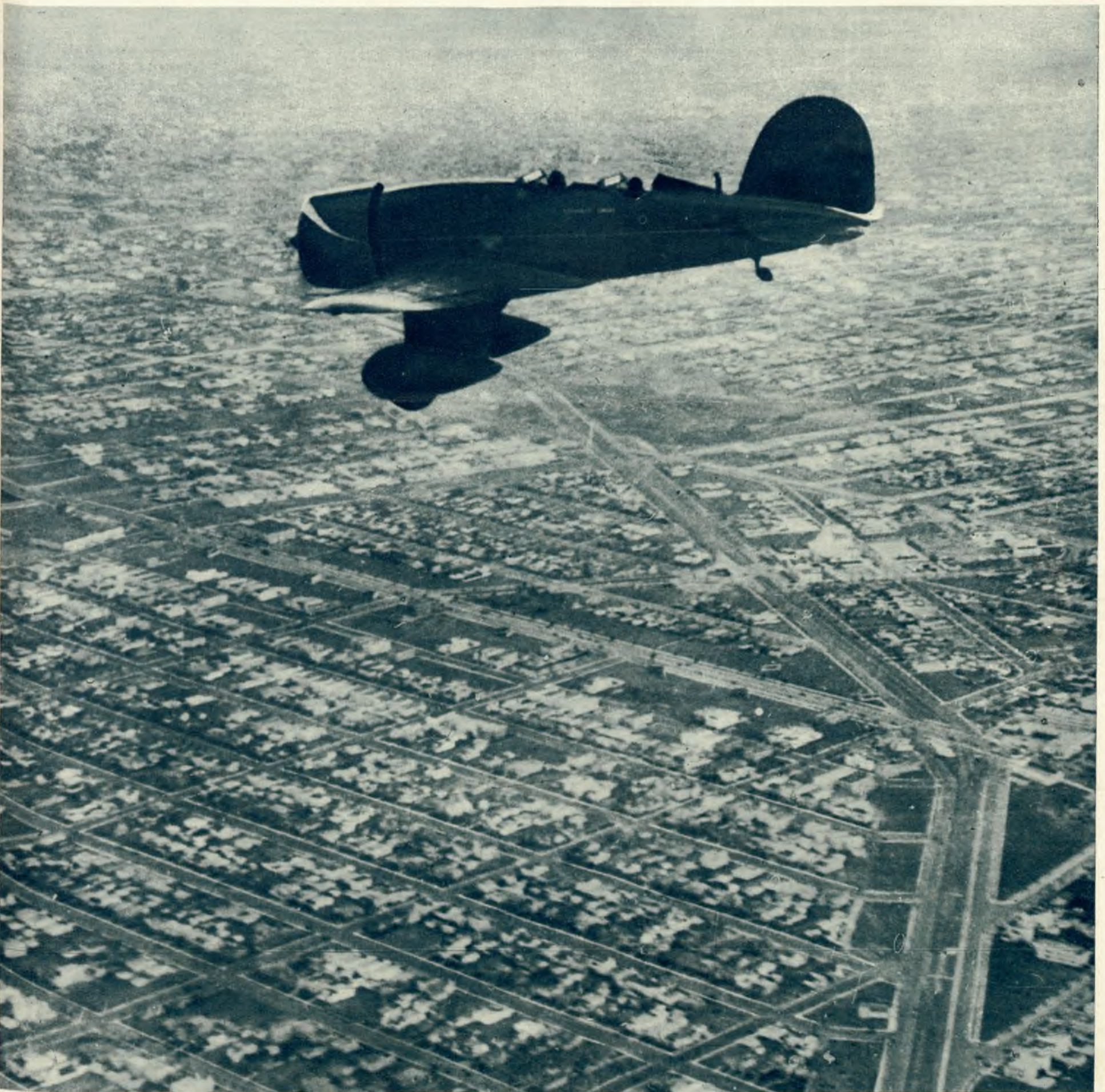
Wspaniały lotnik płk. Lindbergh w towarzystwie swej żony próbuje nad Hollywood nowego typu samolotu, którego skrzydła umieszczone są zupełnie nisko.