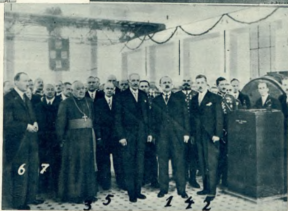
Na prawo: P. Prezyd. w oto- czeniu przedsta- wicieli władz: 1) premjer Bartel, 2) Kwiatkowski min. przem. i handl. 3) ks. biskup Wałęga, 4) gen. Konarzew- ski, 5) wiceminist. Leśniewski, 6) Li- siewicz, szef kan- celarii Prezyden- ta, 7) Wowkowiez naczelný dyrektor fabryki.