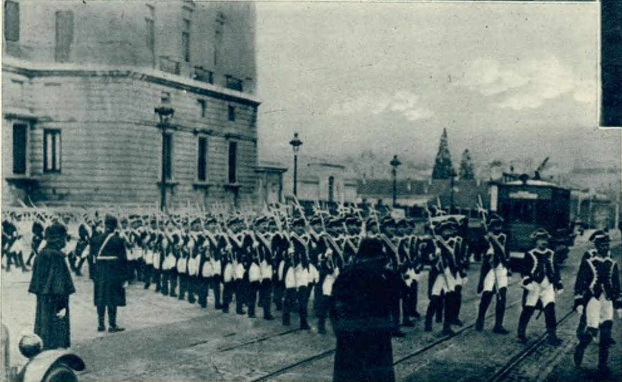
Na lewo: Zmiana warty przed zamkiem królewskim w Madrycie. Warta jak widać na zdjęciu nosi stroje z XVIII w.