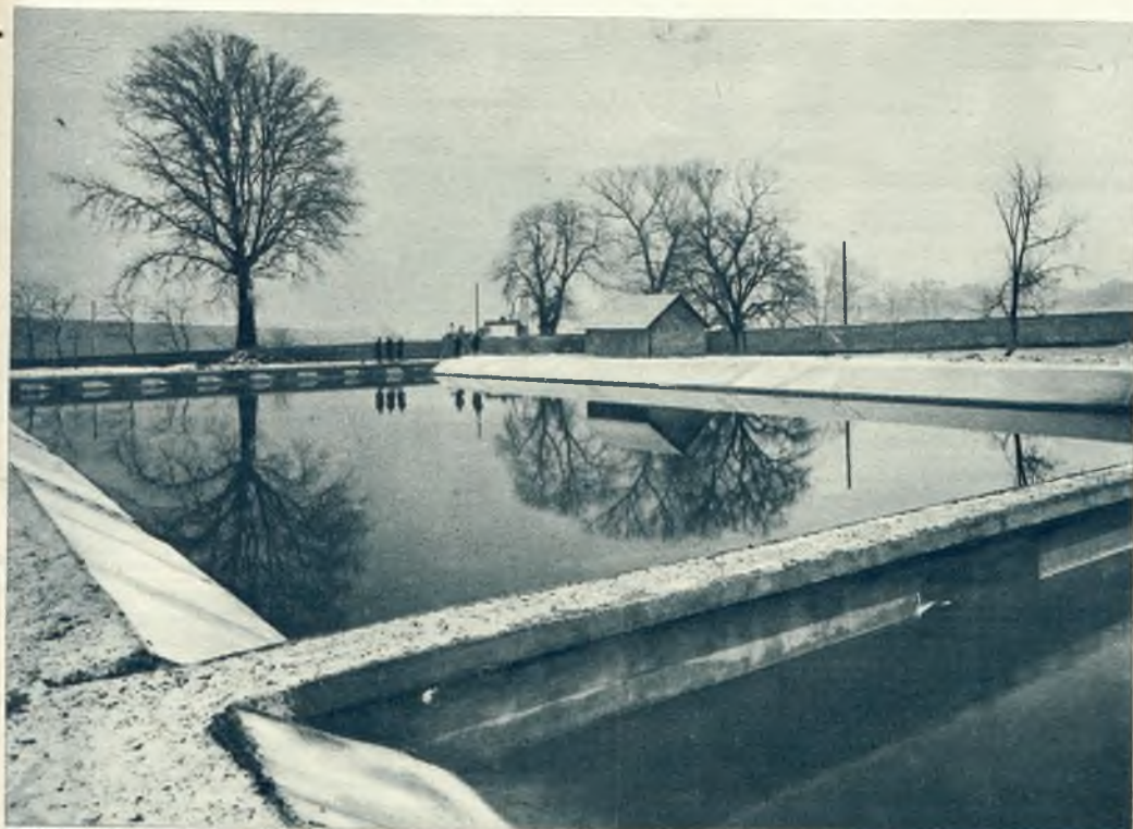
Na lewo: Park sportowy 26 p. piech. we Lwowie. 26 pp. buduje na Kle- parowie park sportowy za- kreślony na eu- ropejską mia- rę. Zdjęcia na- sze przedsta- wiają dwa ba- seny do pływ. wybudowane w parku.