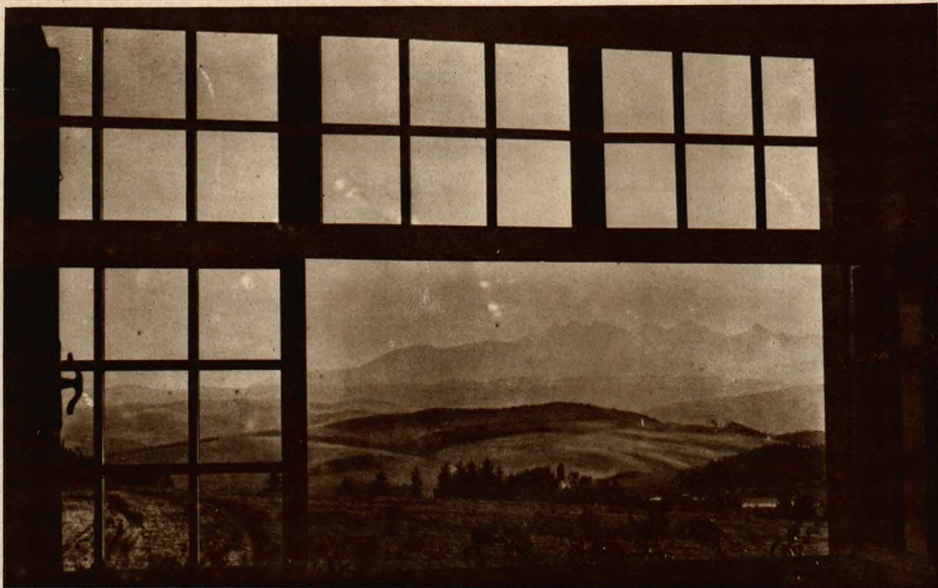
Panorama Tatr z okien nowego gmachu uzdrowiskowego w Czorsztynie-Nadzamczu.