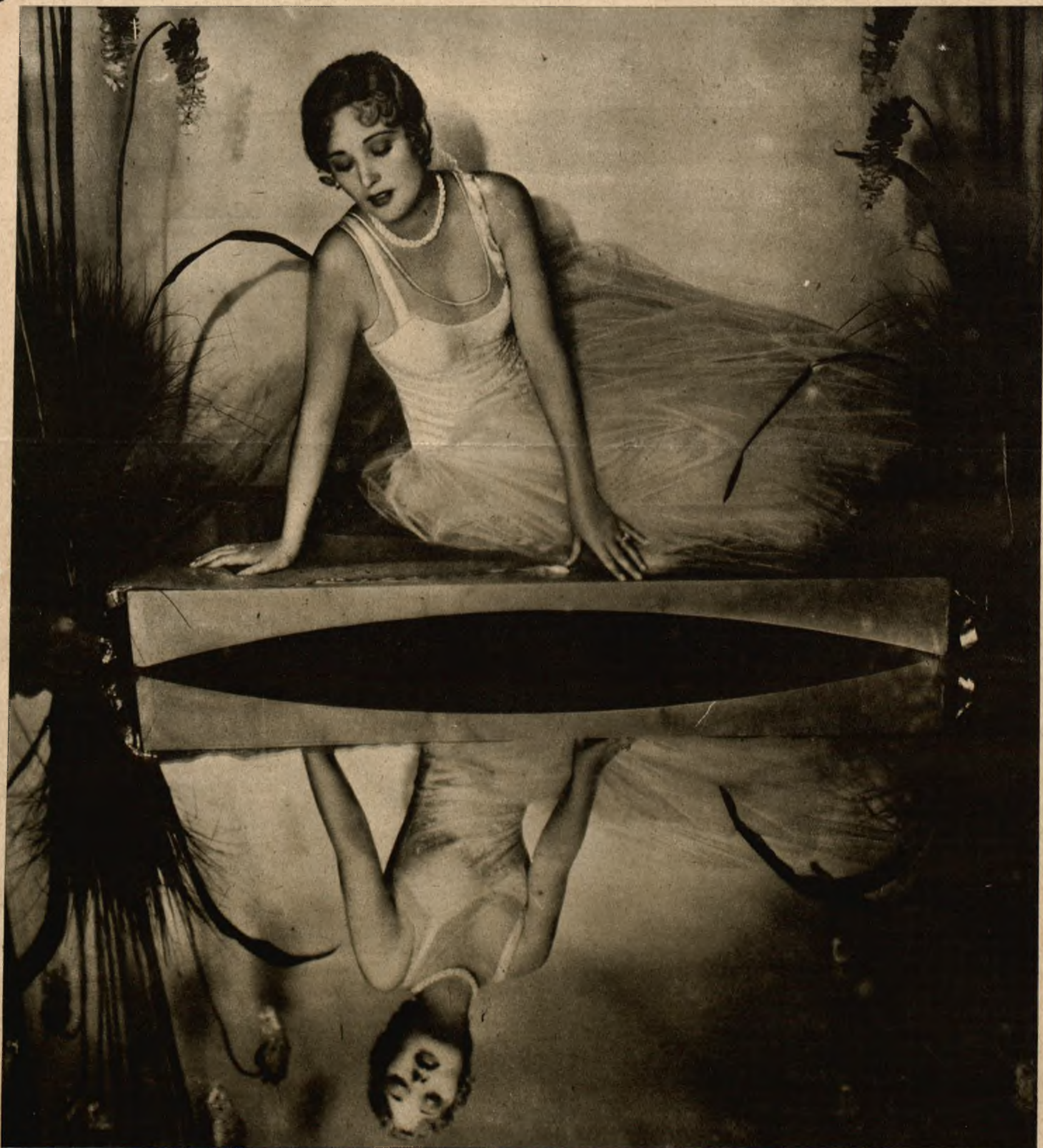
Dolores Costello uroczą gwiazda filmu amerykańskiego.