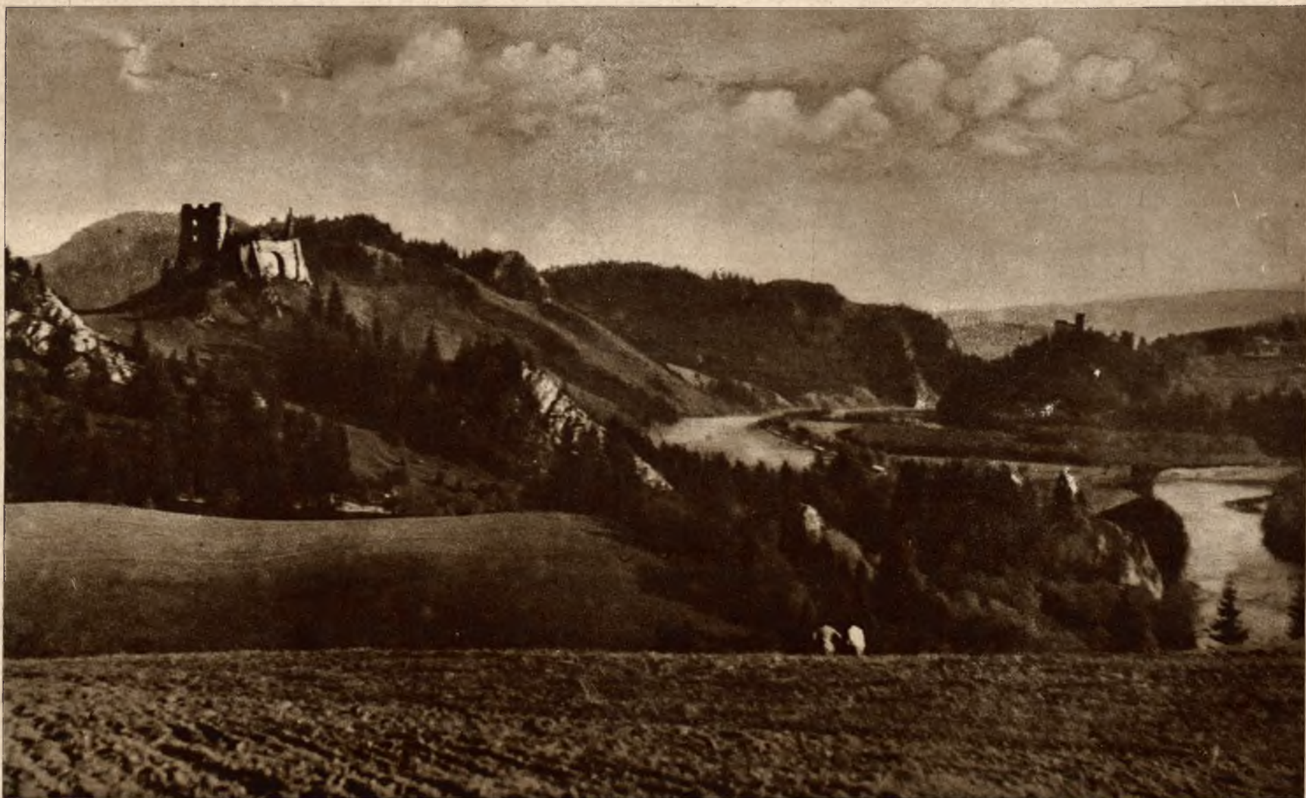
Widok z terenów nowego uzdrowiska i stacji turystycznej Czorsztyn-Nadzamcze na dolinę Dunajca z ruinami zamków w Czorsztynie i Niedzicy.