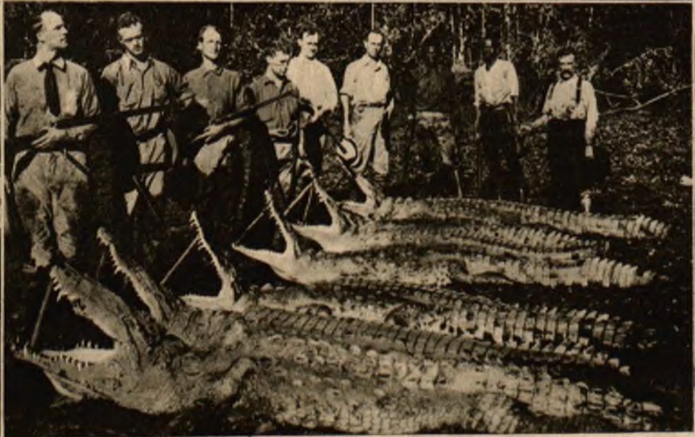
Wspaniałe trofea polowania na krokodyla nad jednym z dopływów Amazonki.