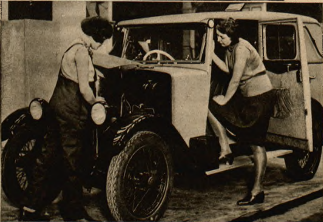
Na dorocznej wystawie samochodowej w Londynie oglądano także to nieduże i eleganckie auto budzące specjalne zainteresowanie wśród pań.