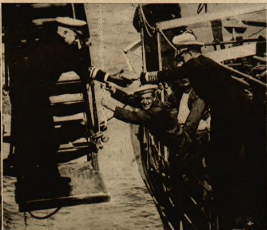
Podczas manewrów floty hiszpańskiej, król Alfons i generał Primo de Rivera wizytowali statki wojenne.