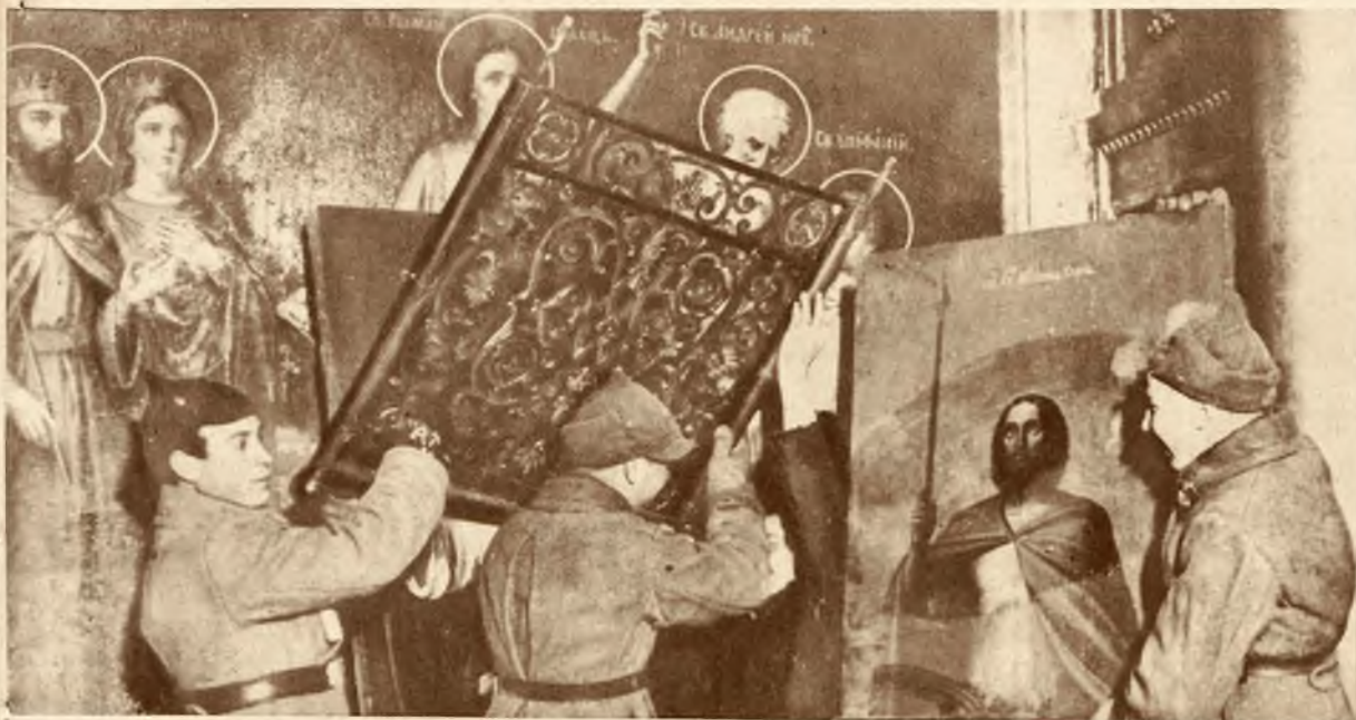
Obraz z akcji antyreligijnej w Sowiech. Niszczenie przez żołnierzy cerkwi, na miejscu której ma stać „dom kultury”.