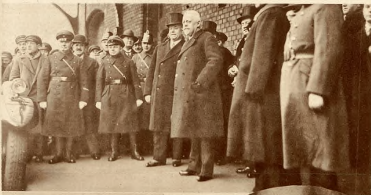
Na lewo: Kancelarz austriacki Schober jeździ. Po Rzymie, pojechał z kilkudniową oficjalną wizytą do Berlina.