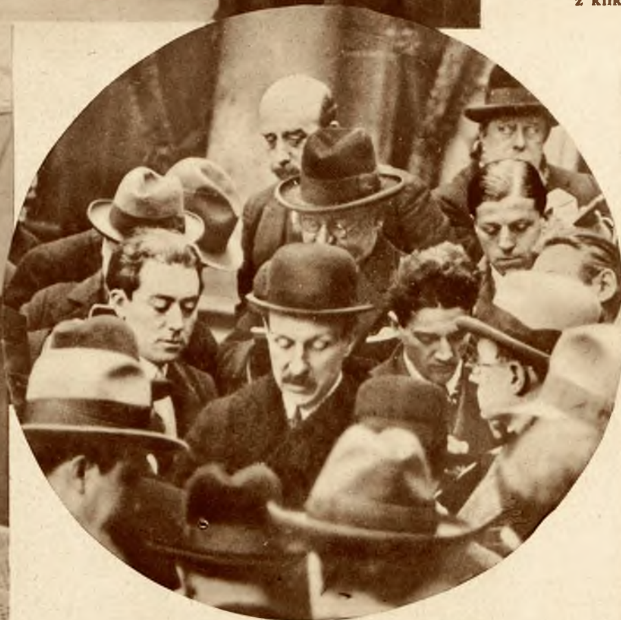
Nowy premier francuski Chautemps atakowany przez dziennikarzy.