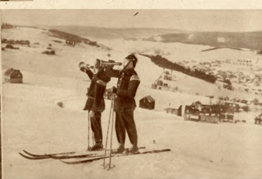
W górach Olbrzymich (Riesengebirge) sport narciarski jest tak popularny, że nawet straż pożarna posługuje się nartami.