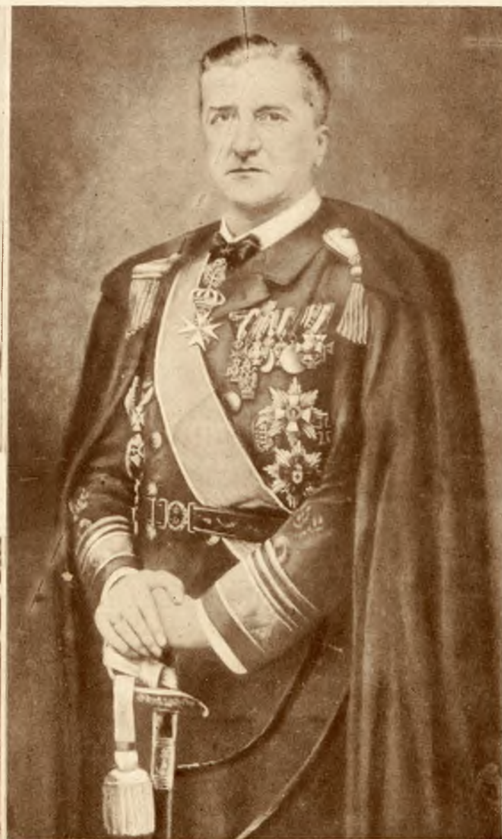
Dnia 1 marca obchodził naczelnik państwa węgierskiego admirał Horthy dziesięciolecie objęcia swej władzy.