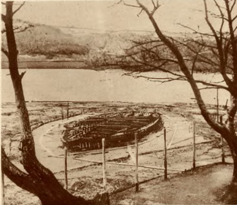
Widok galery cesarza Kaliguli po osuszeniu jeziora Nemi. Praca ta kosztowała 10 milionów lirów. Na lewo biusty z brązu, które znaleziono na galerze.