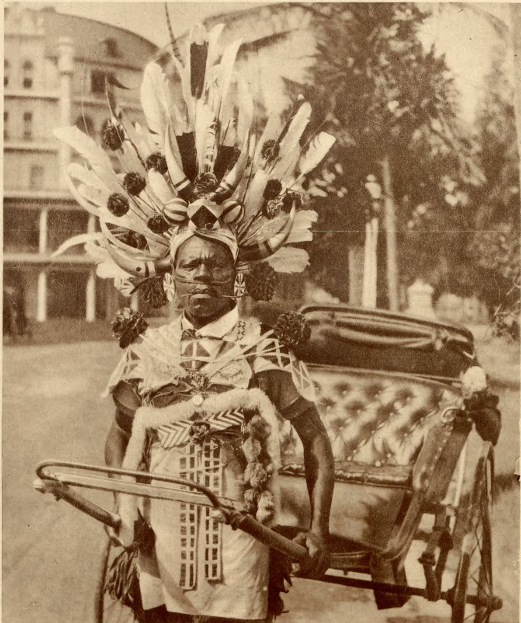
„Rikeza“ w Natalu (Afryka południowa). Popularny typ krajowca ciągnącego wózek pasażerski, zastępujący w Natalu dorożki.