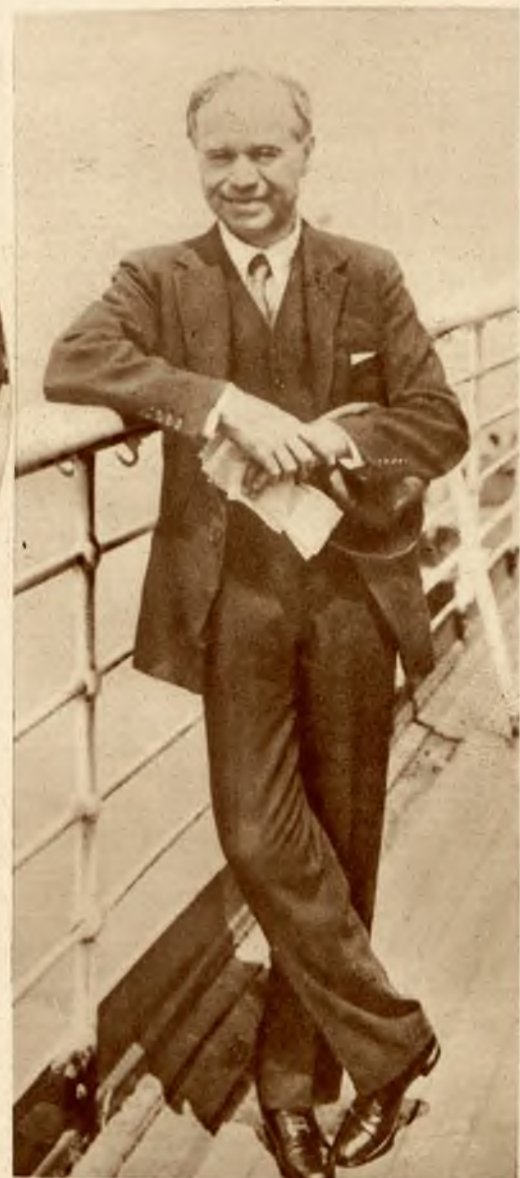
Na prawo: Lord Beaverbrook, angielski magnat gazetowy założył nową partję polityczną, której celem ma być usunięcie bezrobocia.