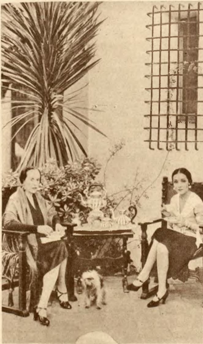
Słynna artystka filmowa Dolores del Rio spożywa wraz matką śniadanie w „patio”