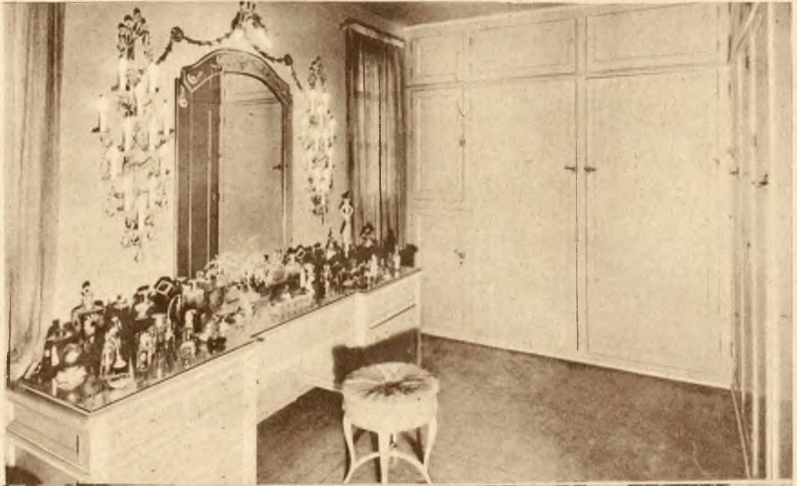
swjej posiadłości w Hollywood. U góry na prawo: sanktuarjum artystki, buduar i garderoba.