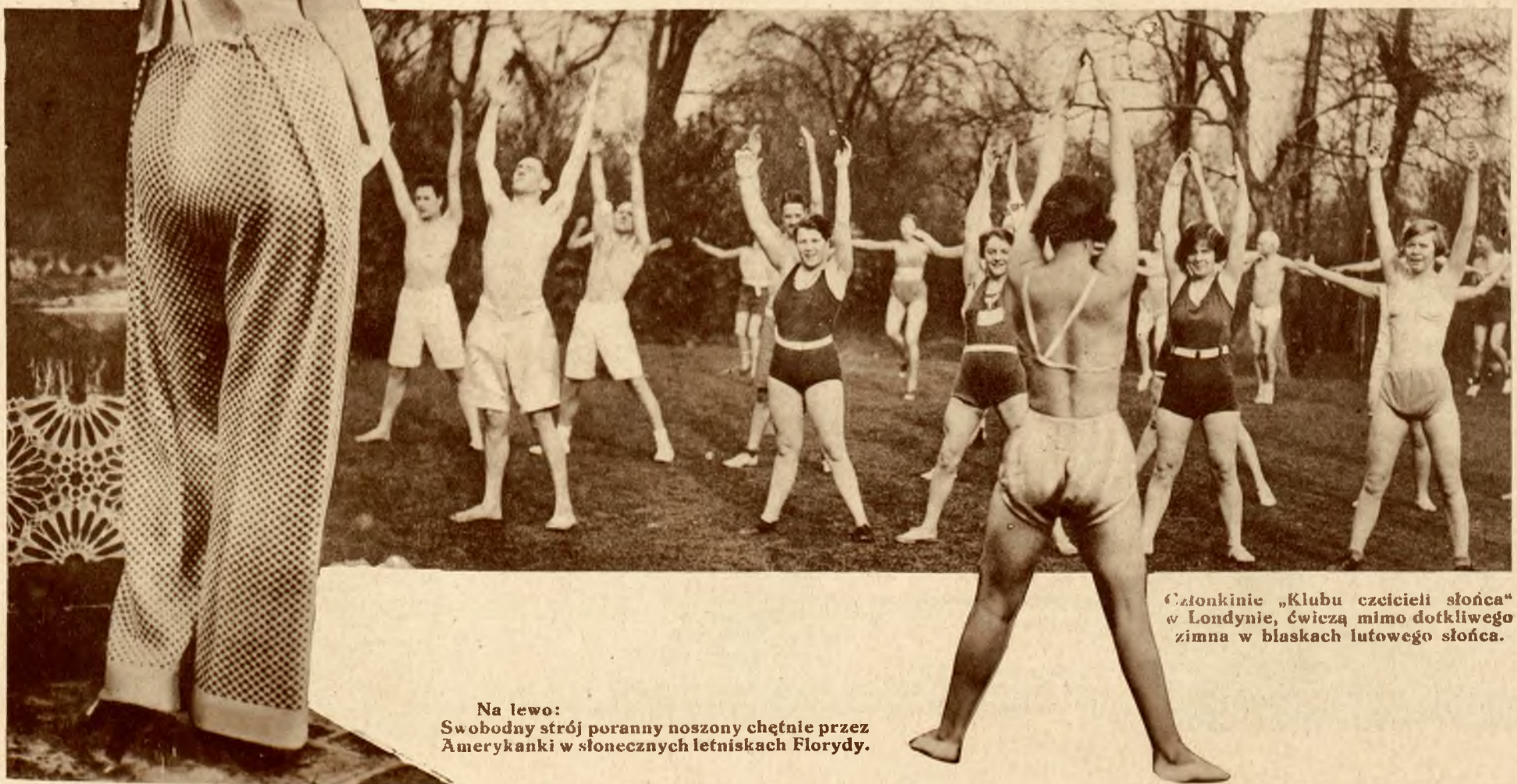
Na lewo: Swobodny strój poranny noszony chętnie przez Amerykanki w słonecznych letniskach Florydy.