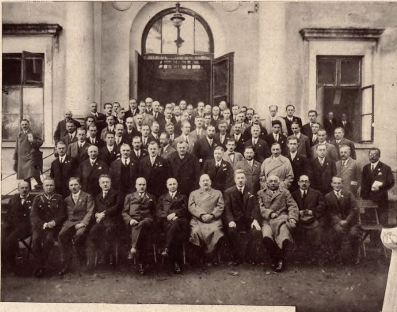
III. Doroczny Zjazd Naftowy w Drohobyczu odbył się w dniach 11 do 13 bm. Zjazd zgromadził liczne sfery techniczne przemysłu naftowego, przedstawicieli władz i świata naukowego. Ilustracja przedstawia grupę uczestników Zjazdu przed gmachem „Sokoła” w Drohobyczu.