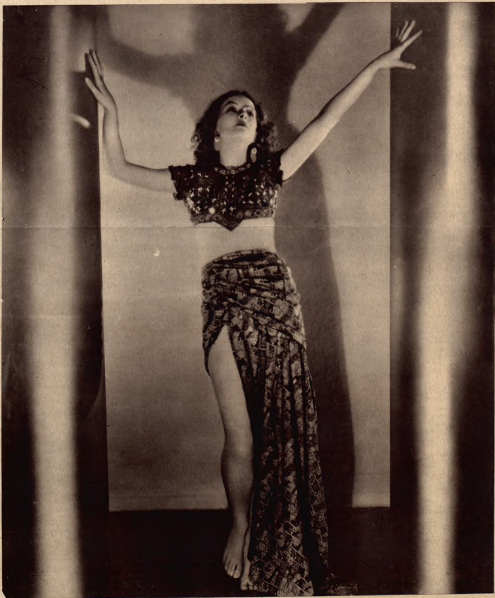
Myrna Loy — znana tancerka amerykańska wstąpiła do filmu.