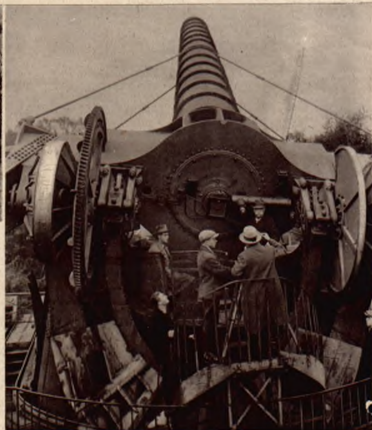
Na prawo: 1 listopada można było obserwować w środkowej Europie minimalne zaćmienie słońca, oto grupa uczonych i dzien- nikarzy przed lunetą obserwatorium w Berlinie.