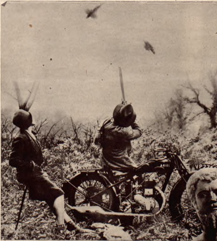
Nowoczesny myśliwy. Zamiast koniem posługuje się obecnie myśliwy dobrym motocyklem, który bez trudu a szybko przenosi go z miejsca na miejsce.