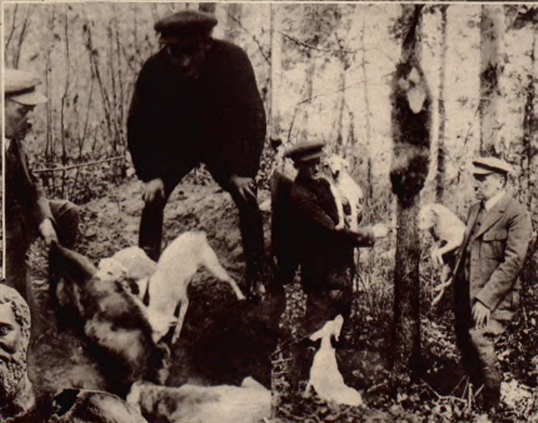
Z jesiennych polowań. Na lewo: Wyciąganie borsuka przy pomocy zaciętych „foksów” z jamy. Na prawo: Borsuk, zdobycz zaciętych „foksów” na drzewie.