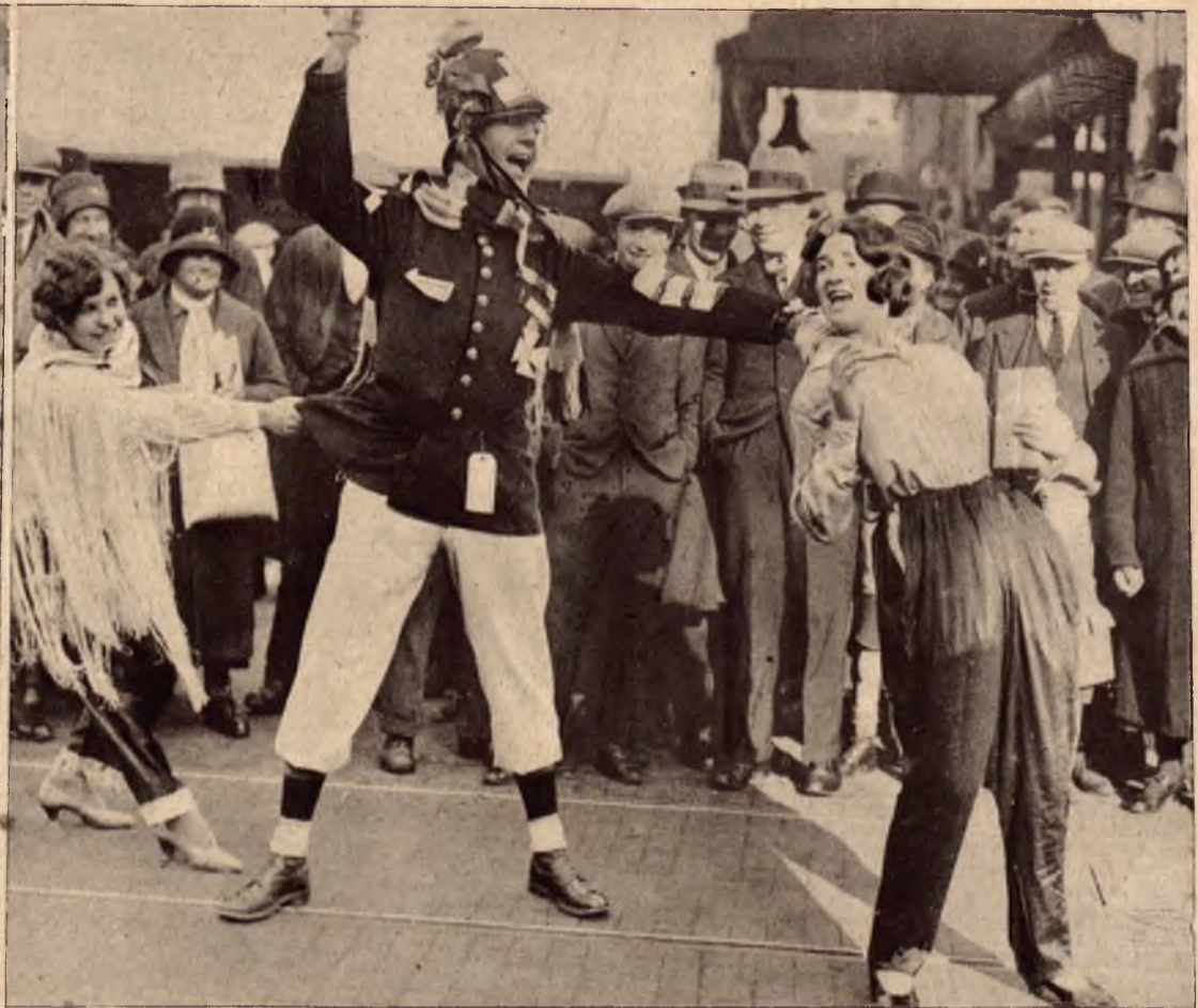
Studenci angielscy kwestują na cele dobroczynne, urządzając na ulicach wesołe widowiska. Oto przebrany za policjanta student przytrzymuje nieprawdziwych złodziei.