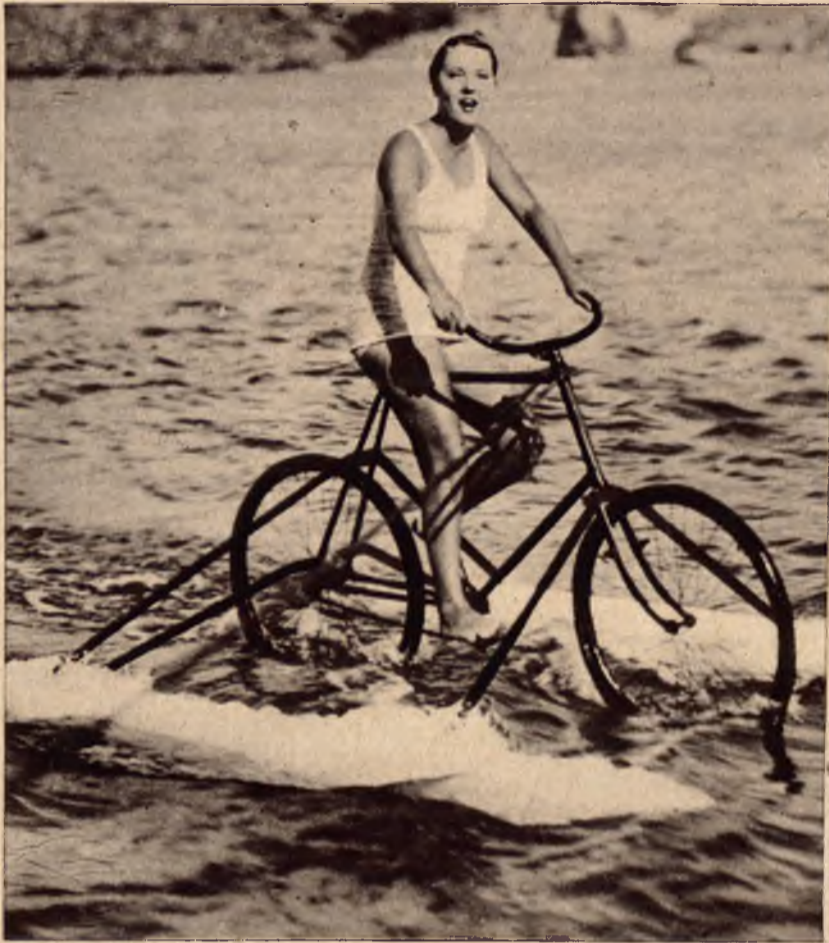
Gwiazda filmowa Dorota Mackaill używa najpopularniejszego obecnie w Hollywood sportu t. j. wodnego roweru podczas krótkiego wypoczynku.