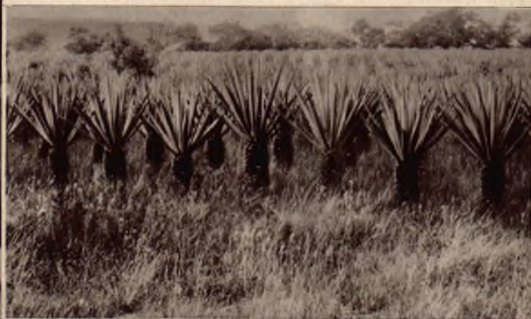
Plantacja sisal'u na Kubie, rośliny zastępującej nasze konopie.