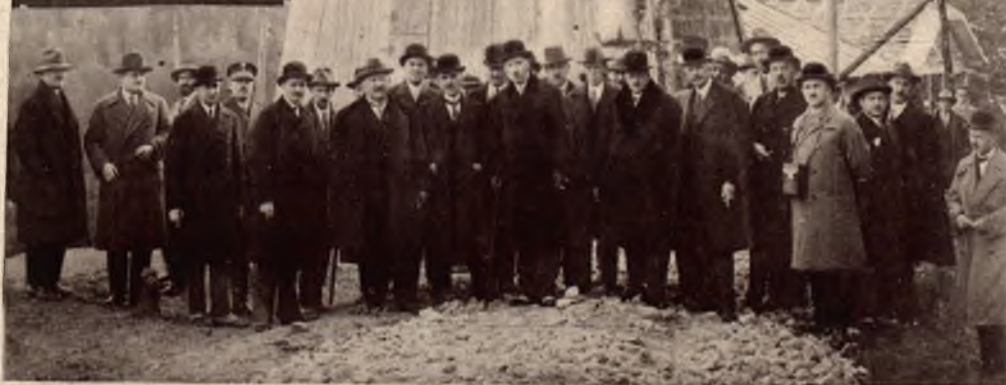
Poświęcenie szybu poszukiwawczego w Mrażnicy. Dnia 19 bm. odbyło się uruchomienie i poświęcenie pierwszego szybu poszukiwawczego S. A. „Pionier” w Mrażnicy z udziałem pp. ministrów Kwiatkowskiego i Boernera, przedstawicieli władz oraz przemysłu naftowego. Zdjęcie przedstawia uczestników uroczystości przed szybem „Minister Kwiatkowski”.