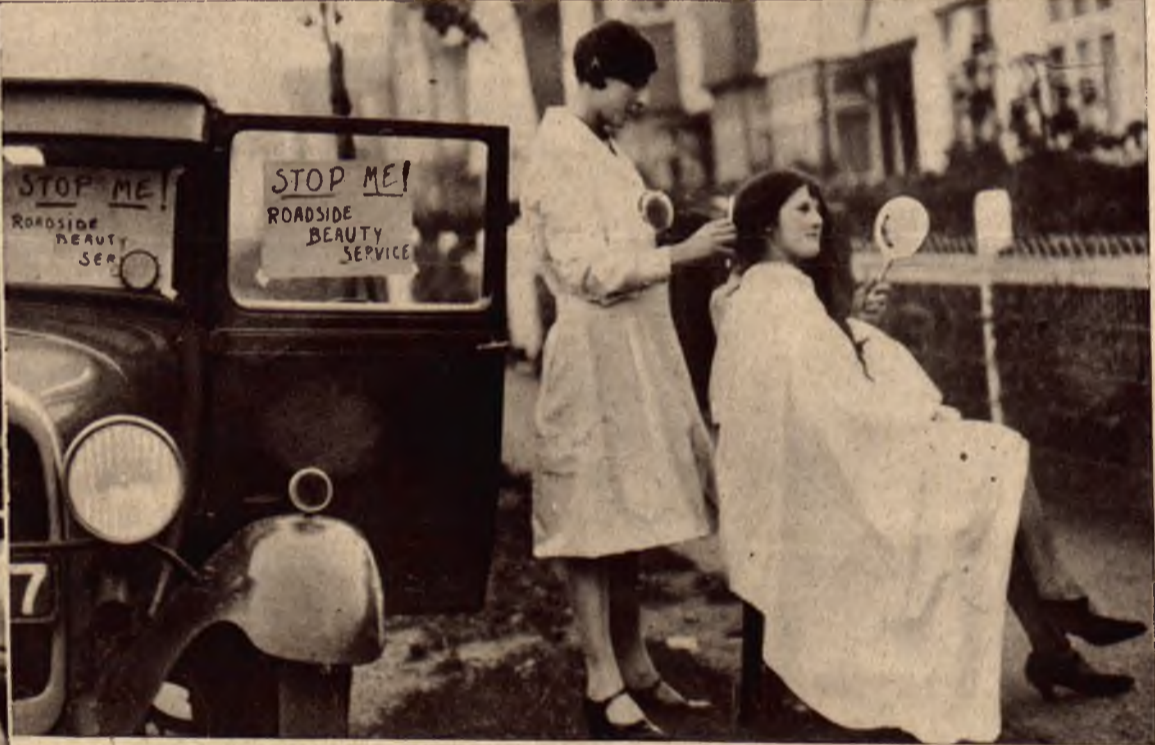
Londyńskie salony fryzjerskie wysyłają na przedmieścia swe pracownice w autach uposażonych w wszystkie przybory i w ten sposób organizują lotne przydrożne filje swych zakładów.