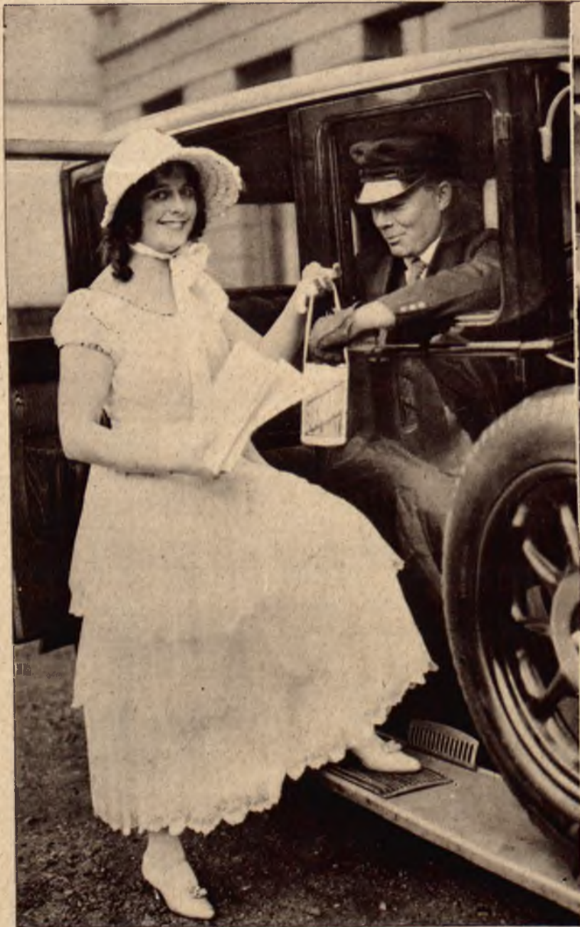
Angielska księżniczka Beatrycze bierze osobiście udział w stroju Dickensowskim w kweście na rzecz szpitala.