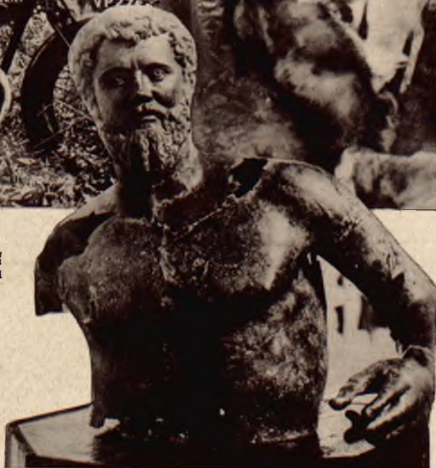
Koło Nicosia na wyspie Cypr pewien wieśniak orząc ziemię natrafił