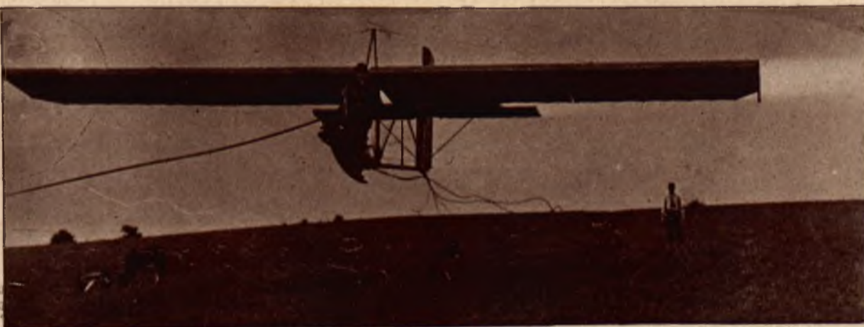
Pierwszy moment po oderwaniu się od ziemi.