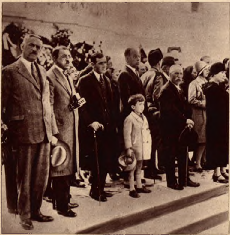
Były król Afganistanu Amanullah, zmuszony do abdykacji bawi w Rzymie i brał udział w święcie rocznicy zawieszenia broni.