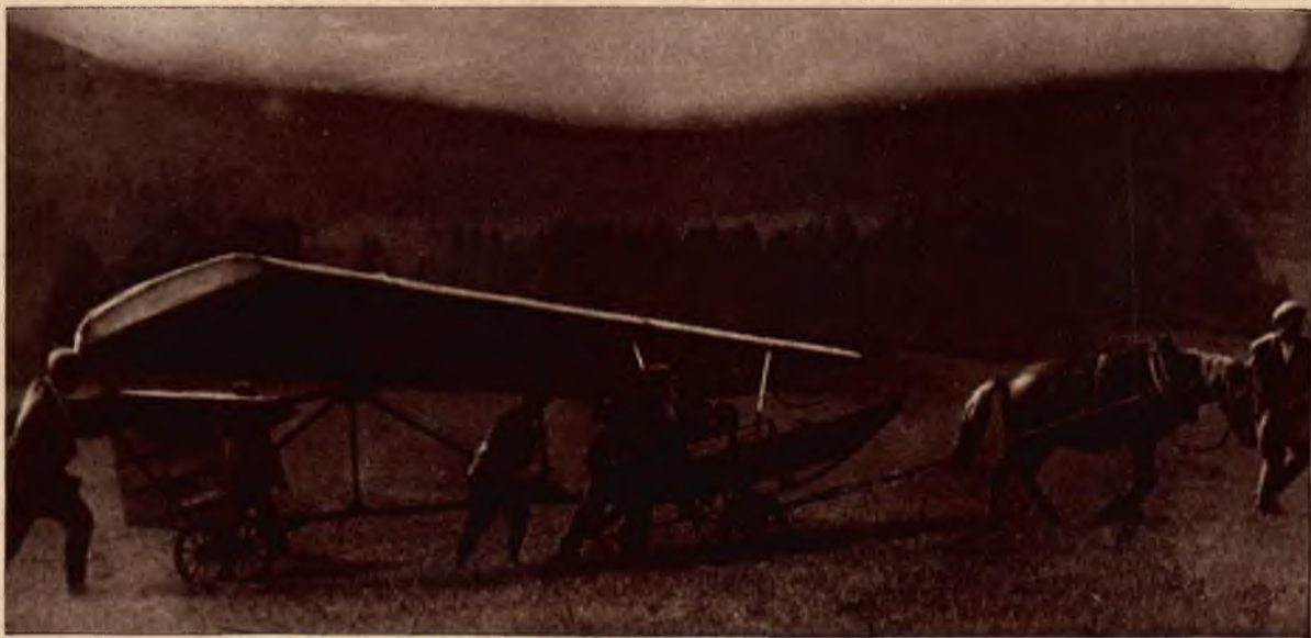
Transport szybowca na wierzchołek góry.