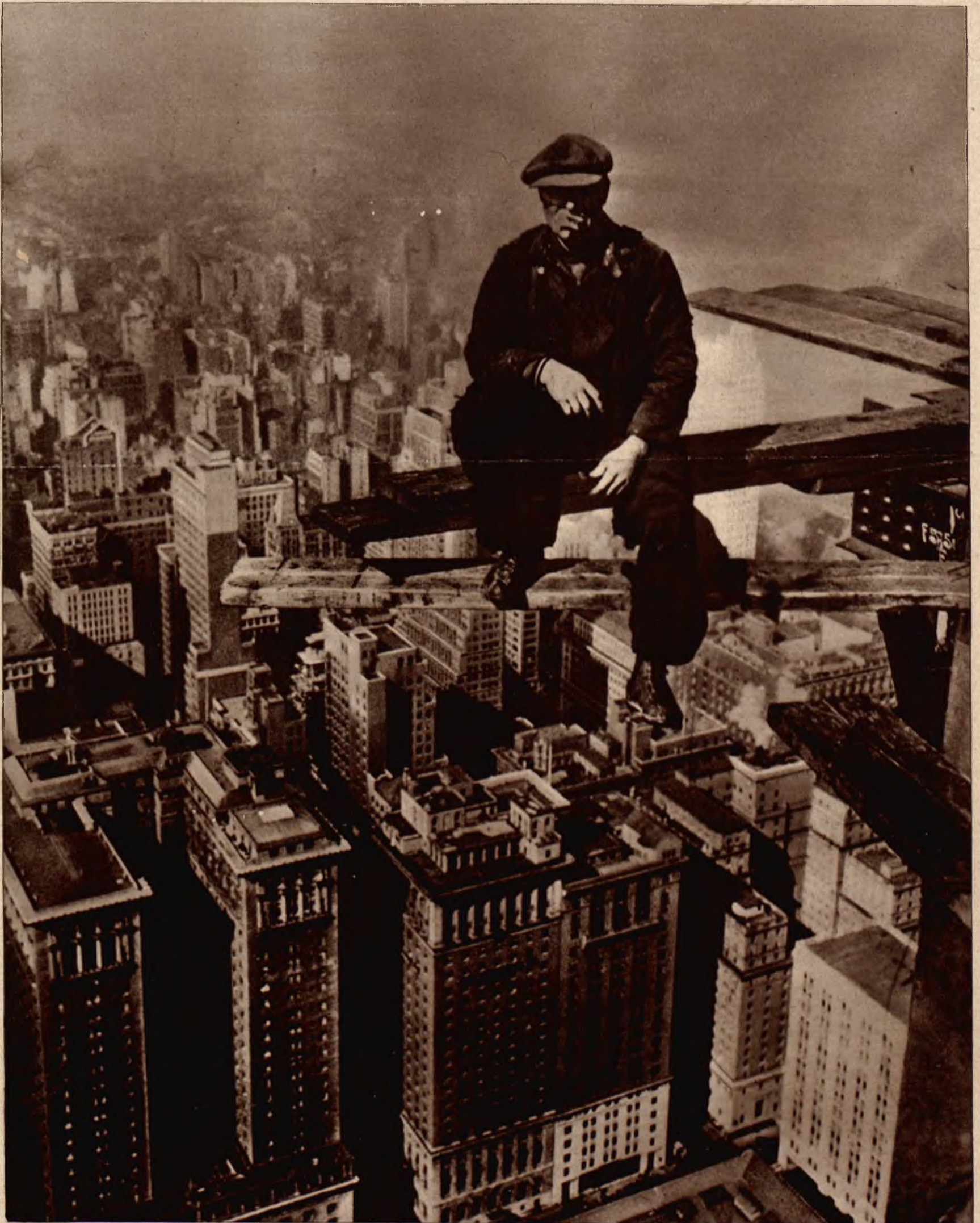
Robotnik spędzający swą przerwę obiadową na szczycie budującego się w Nowym Jorku gmachu firmy samochodowej "Chrysler". Gmach jest wysoki na 270 m.