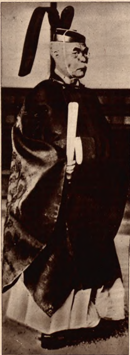
Juko Hamaguchi premier japoński, bierze osobiście wraz z innymi dygnitarzami udział w jesiennym święcie religijnym w Tokio.