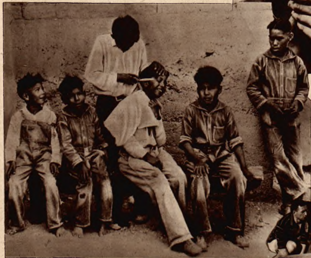
Mali Indianie przed udaniem się do szkoły strzygą nawzajem swe bajne czupryny za pomocą ostrego noża, przyczem żadnego z nich nie ogarnia niepokój z powodu tego niebezpiecznego zabiegu kosmetycznego.