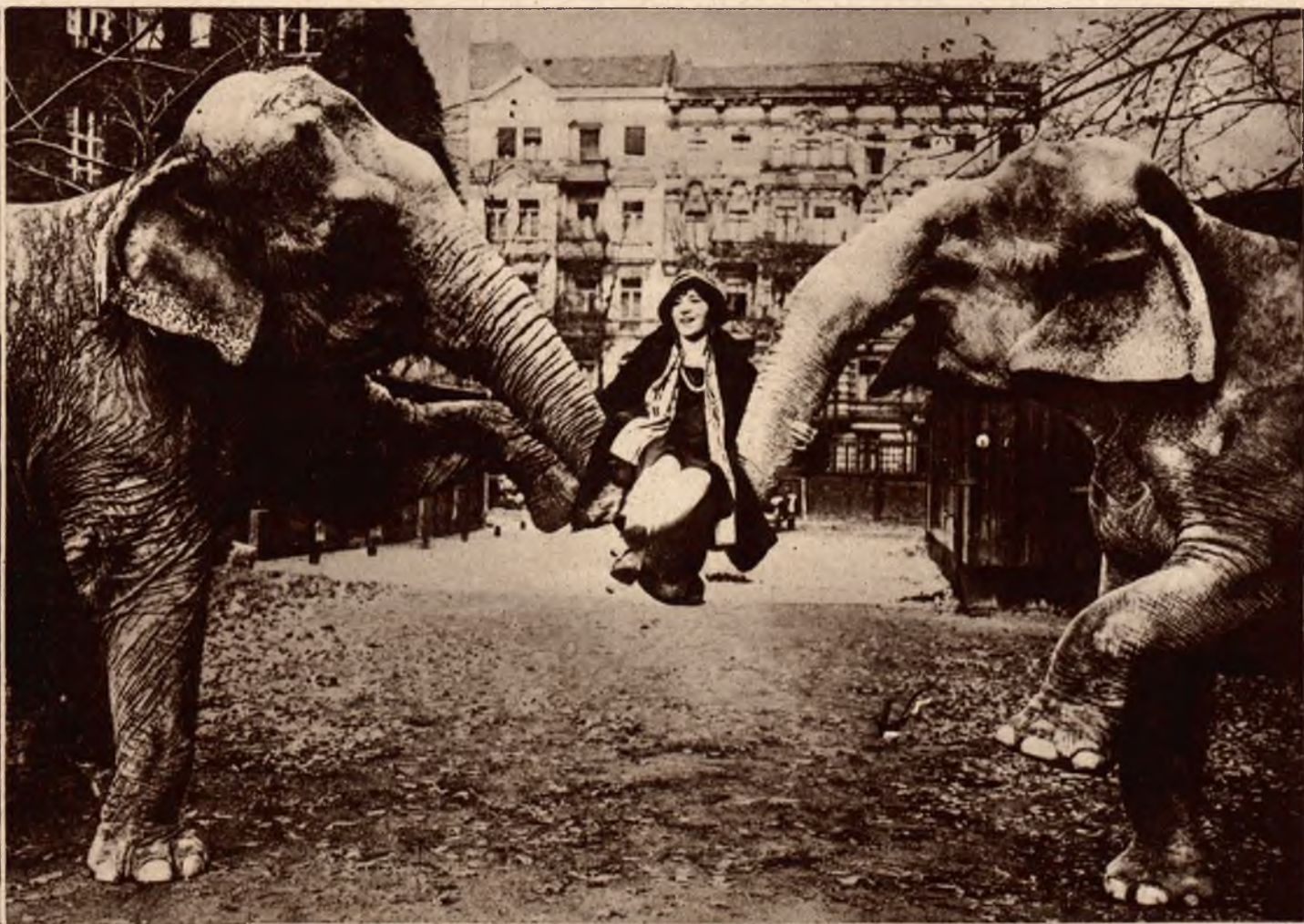
Jeden z numerów berlińskiego kabaretu Scala. Odważna artystka urządziła sobie huśtawkę na trąbach dwu słońi.