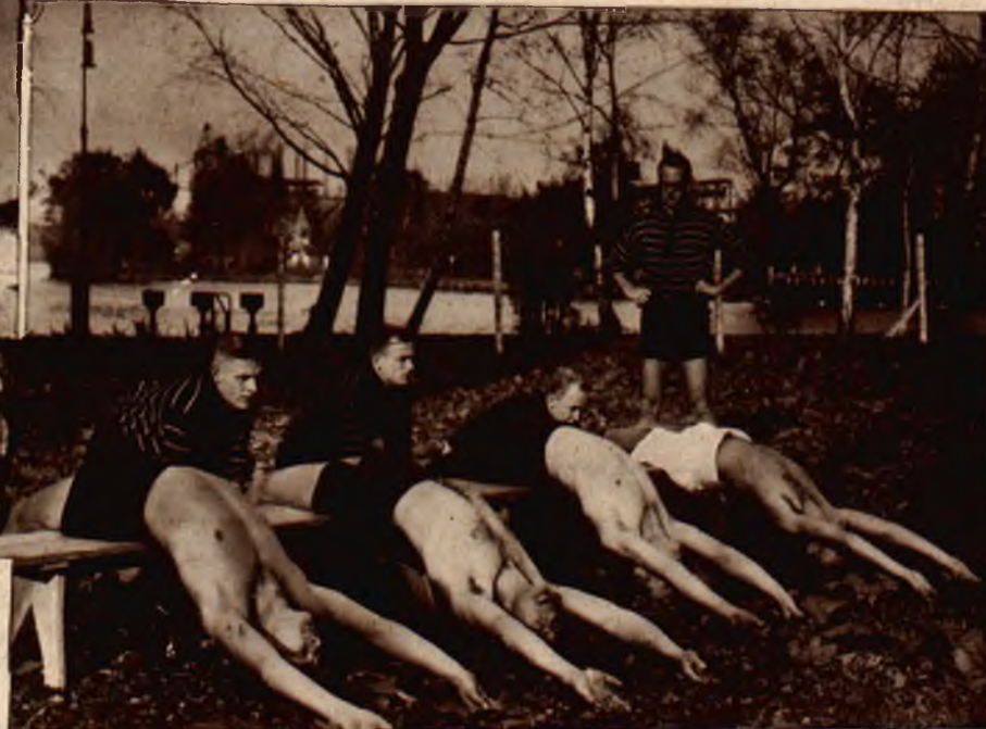
Na prawo: Wioślarze rozpoczęli już swój trening zimowy, by w czasie martwego sezonu nie wyjść z formy.