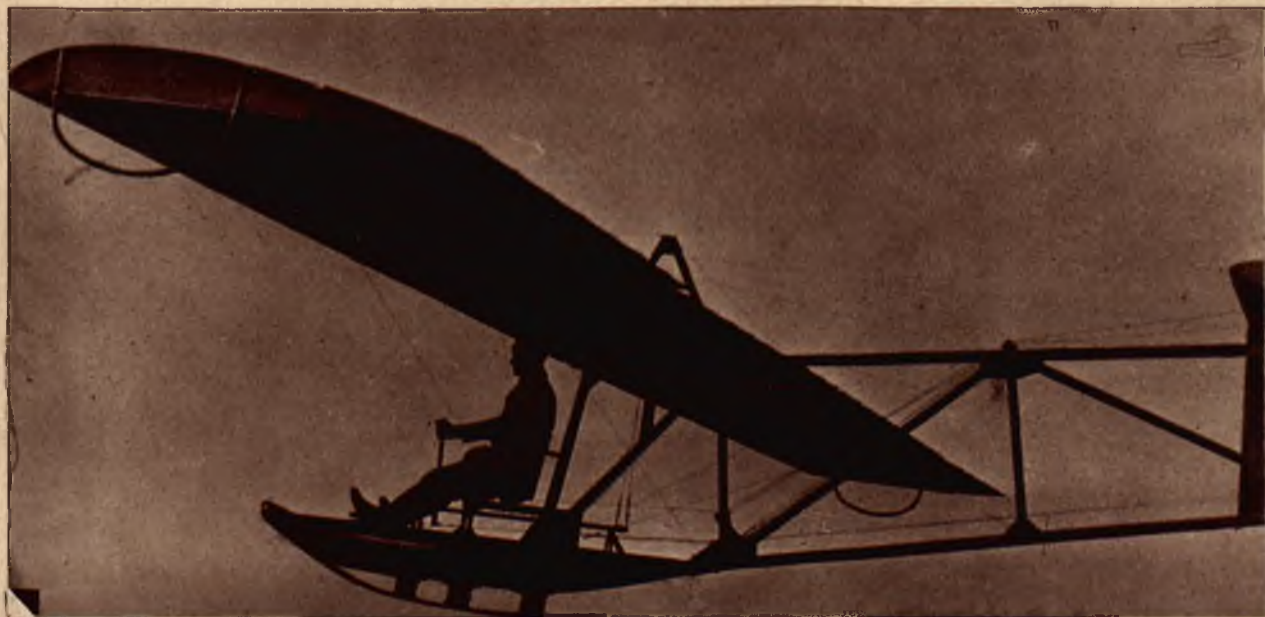
Szybowiec nabiera wysokości.