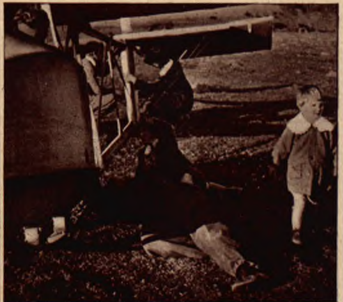
Szczegół z montażu. Najmłodszy amator lotnictwa.