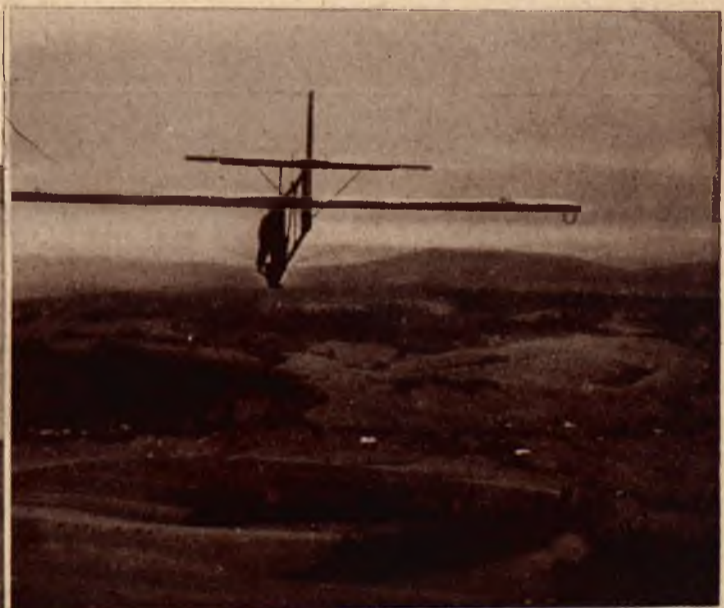
Szybowiec szkolny typ III w pełnym locie.