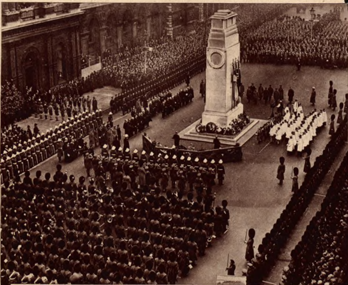
Na prawo: Rocznicę zawieszenia broni obchodzano w Londynie bardzo uroczystie. Ogólny widok parady wojskowej.