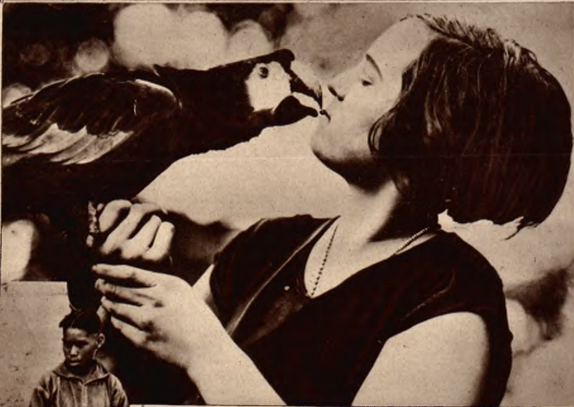
Nadzwyczajna przyjaźń między papugą a młodą dziewczyną, nie robi jednak wrażenia zbyt higienicznej i bezpiecznej.