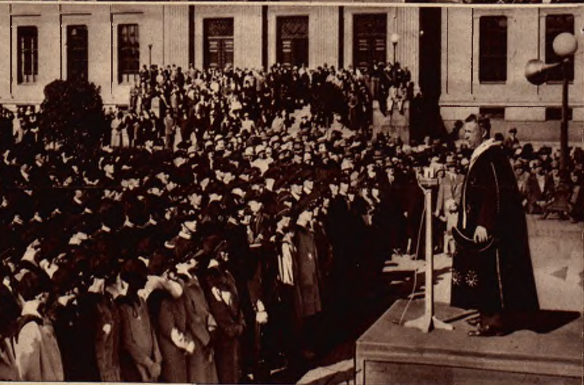
Uroczyste otwarcie roku szkolnego na uniwersytecie w Oslo odbyło się na placu przed gmachem uniwersyteckim.