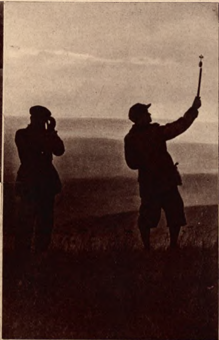
Przed startem. Pomiar szybkości wiatru.