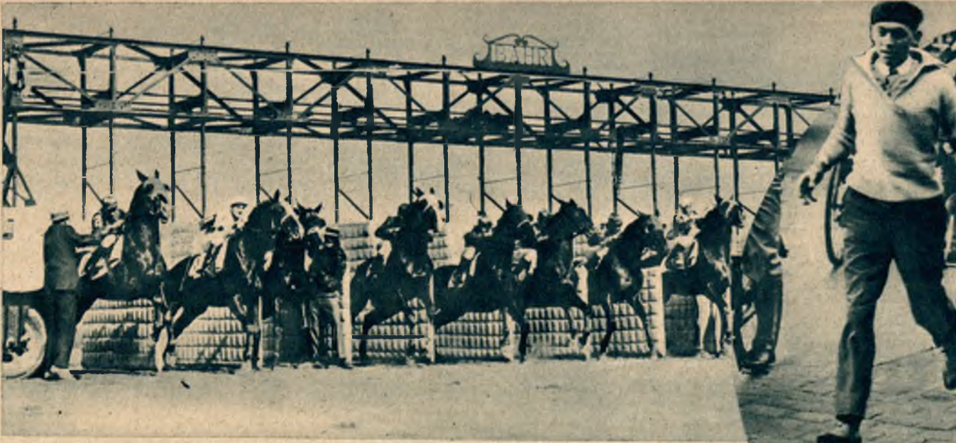
Nowoczesne amerykańskie urządzenie startu koni wyścigowych. Każdy koń znajduje się w osobnym box'ie wybitym materacem, zamkniętym barjerą. Na dany znak barjera się podnosi a konie wybiegają.