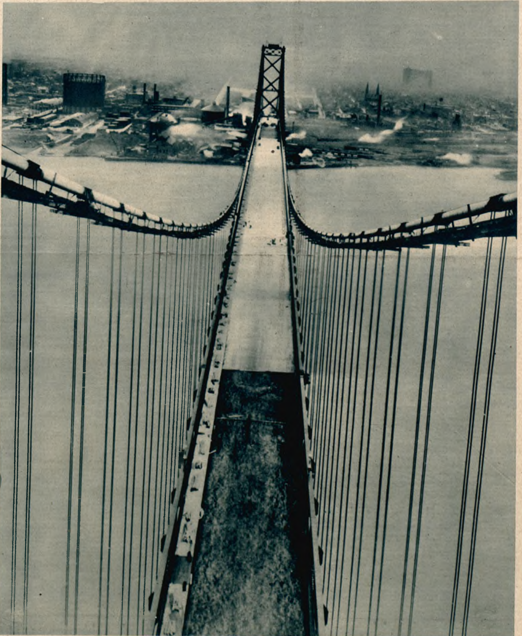
Największy most wiszący świata znajduje się w Detroit (Stany Zjednoczone). Rozpiętość między dwoma wieżami wynosi ok. 300 m. Przez most może jechać równocześnie obok siebie 5 pojazdów.