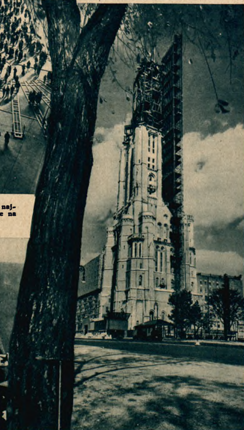
Na wzgórkach nad rzeką Hudson w Nowym Yorku stanie z subwencji Rokefellerów olbrzymi kościół baptyistów cały z kamienia o bardzo pięknej sylwetce.