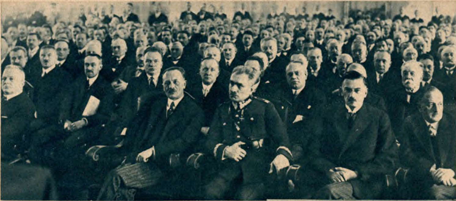
Na lewo: Plenum obrad konferencji przed- stawicieli izb lekarskich w sali Rady Miejskiej. W pierwszym rzę- dzie siedzą: premier Świątalski, min. Sławoj-Składkowski, minister Kühn, min. Boerner, marszałek Szymański.