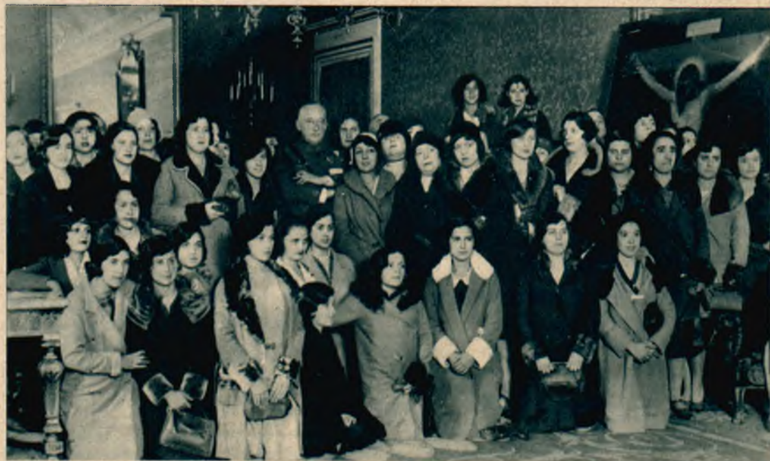
Dyktator hiszpański Primo de Rivera w otoczeniu modystek madryckich, które zwróciły się do niego z prośbą o zaopiekowanie się ich ciężką dolą.