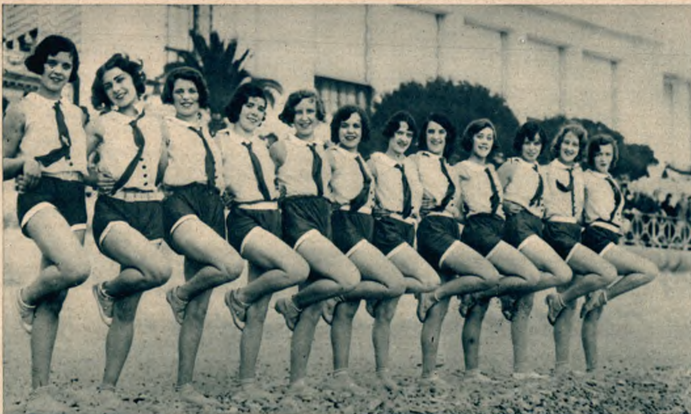
Balet słynnego kabaretu paryskiego Folies Bergere, przygotowuje się na Rivierze do świątecznych występów.