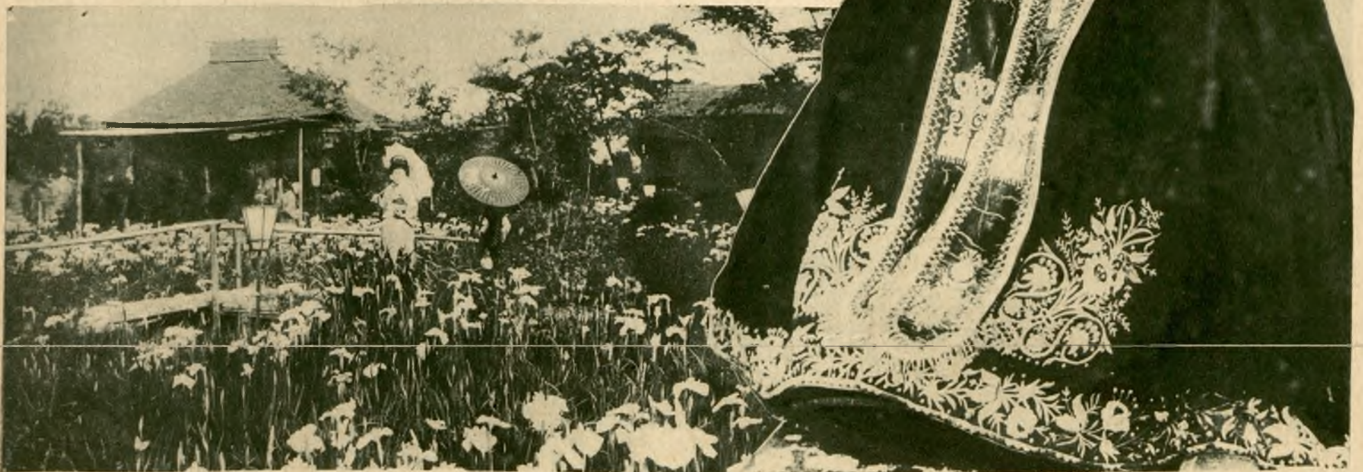
Wiosna w Japonji. Ogród pełen delikatnych białych i niebieskich irysów.