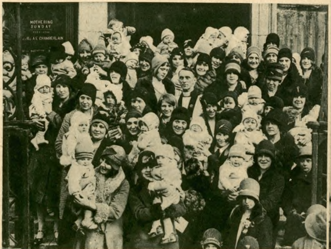
„Dzień matki“ w Londynie. Grupa przed kościołem po odprawieniu specjalnego nabożeństwa.