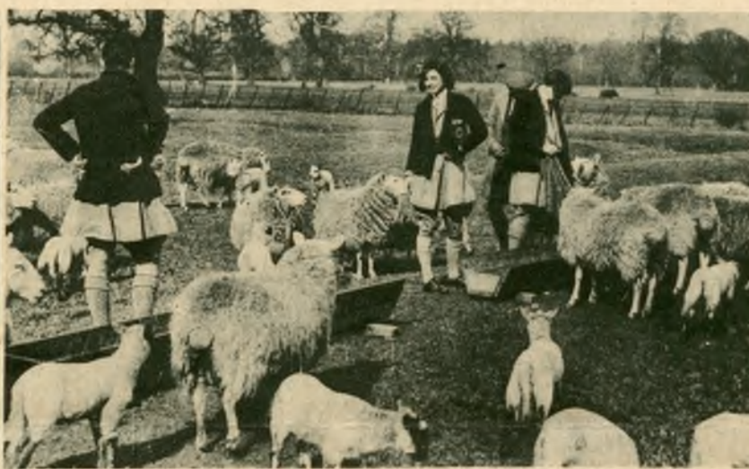
Scena z wzorowej farmy angielskiej, na której po ukończeniu studjów praktykują londyńskie studentki.