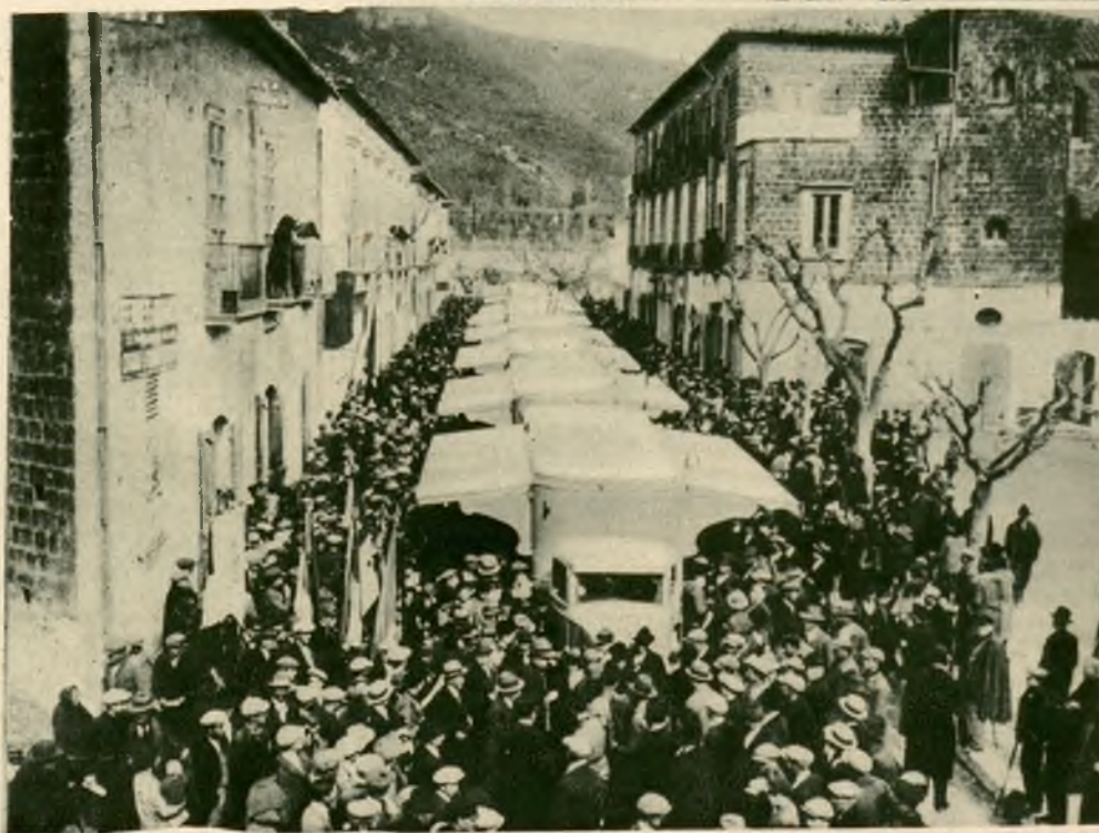
Lotna wystawa na samochodach zorganizowana przez Mussoliniego dla propagandy gospodarstwa wiejskiego a przede wszystkim uprawy zboża.