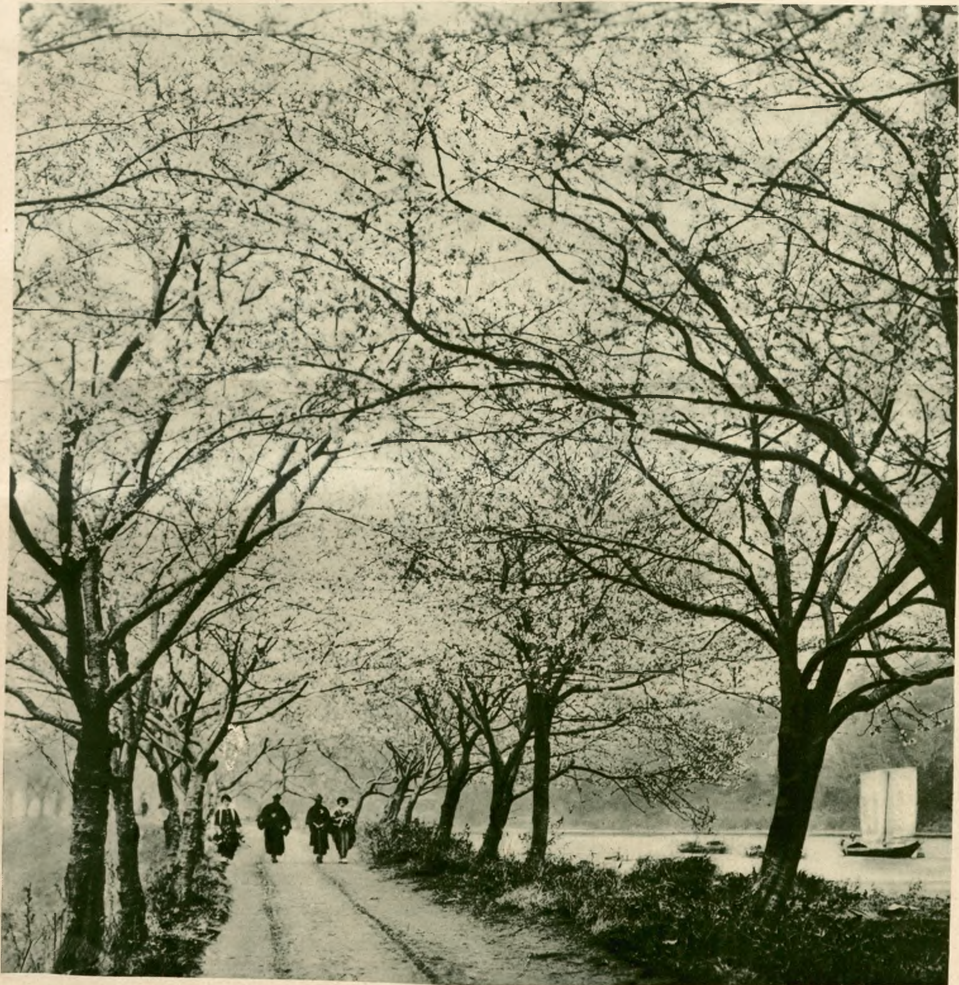
Wiosna w Japonji. Droga wiejska w pobliżu Tokio cała w krasie kwitnących wiśni.