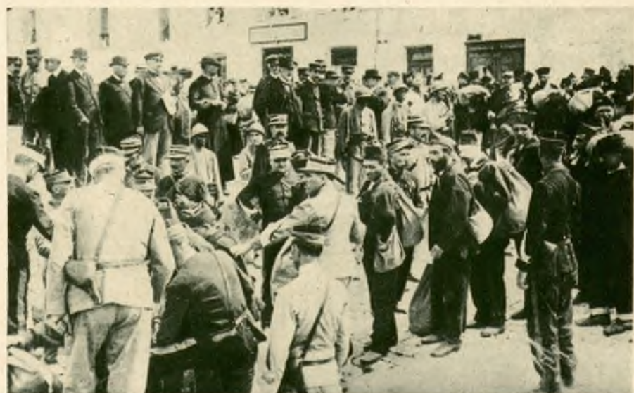
Transport przedstawców francuskich na słynną „wyspę potępionych” Ile de Ré.