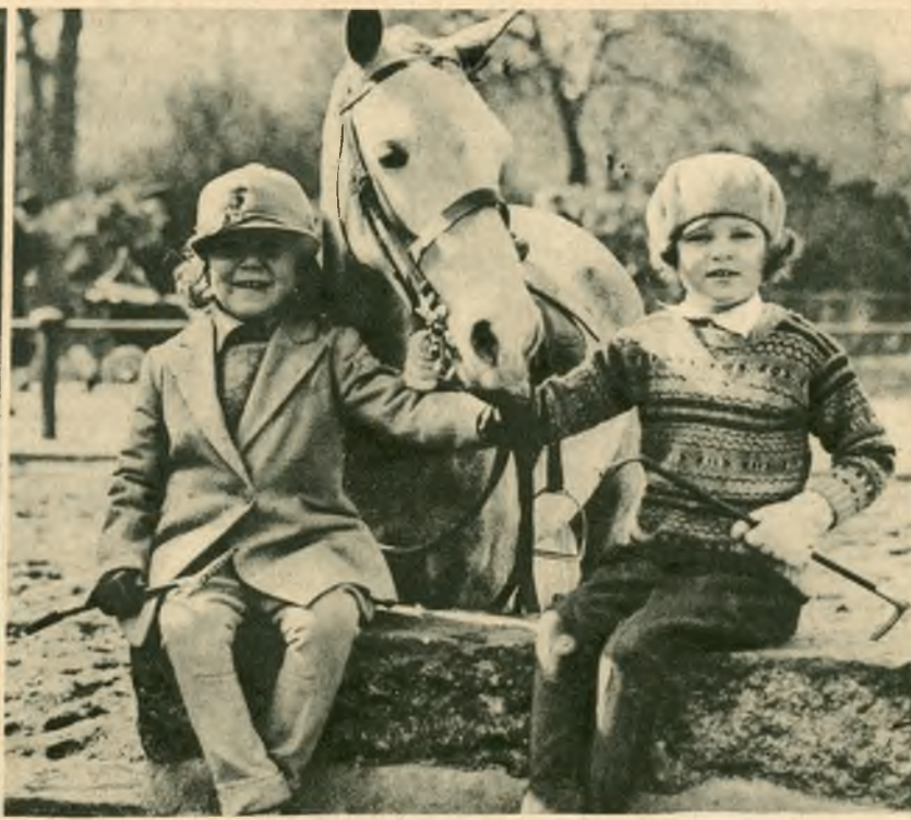
Jazda konna jest w Anglii uprawiana już od lat najmłodszych: oto dwoje młodzieńskich adeptów w ściśle przepisowym stroju.