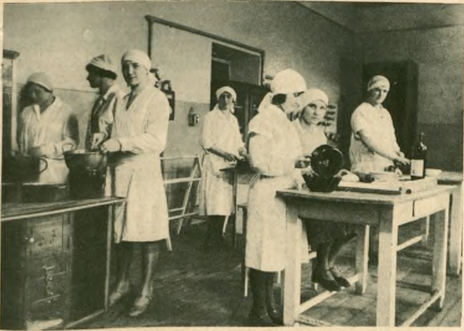
II-gi 3-ch miesięczny kurs gotowania dla pań przy Szkole Zawodowej Żeńskiej urządzony przez Stow. Służby Obywatelskiej.