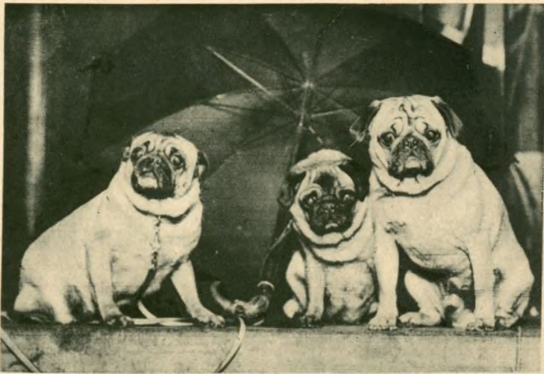
Kilka „miłych“ okazów z dorocznej wystawy psów w Londynie.