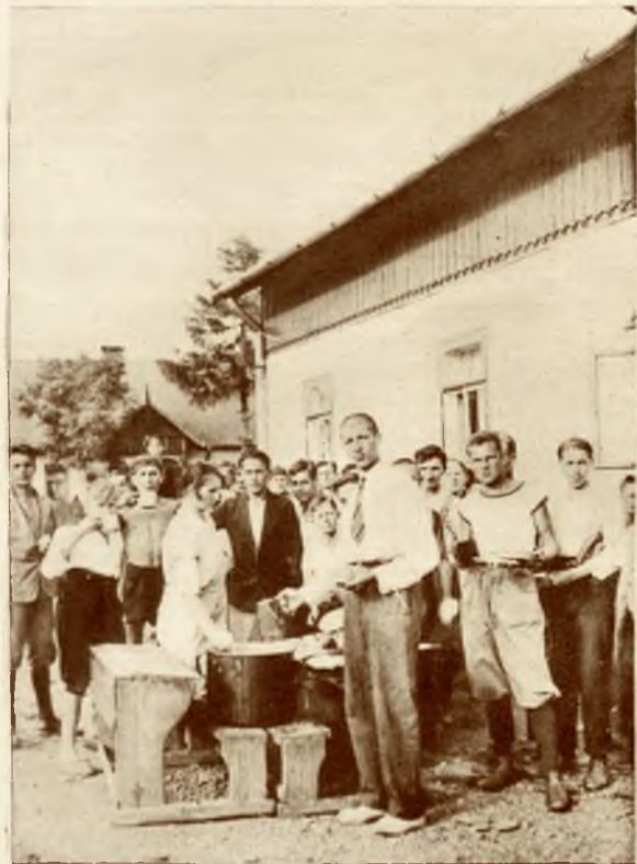
Kolonje lwowskiej młodzieży rzemieślniczej w Posadzce Olchowskiej. Wydawanie leguminy.