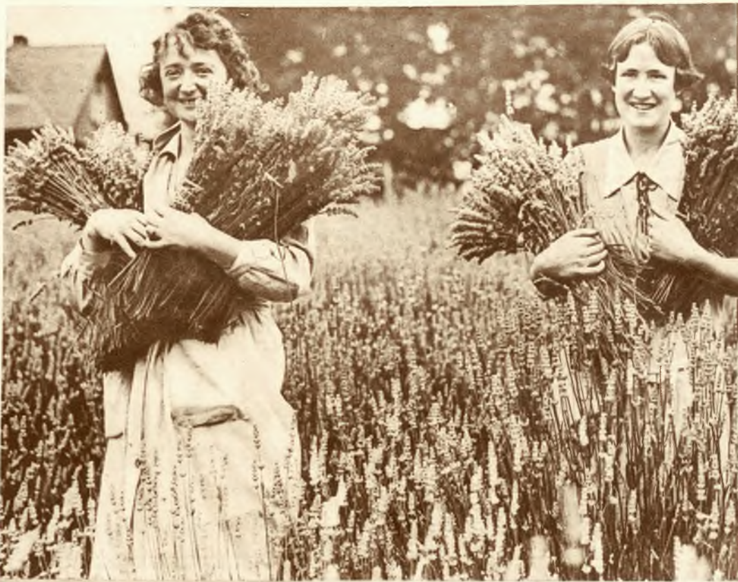
Rok bieżący jest rekordowym pod względem urodzaju na lawendę. Zdjęcie z farmy lawendowej w hrabstwie Kent (Anglja).