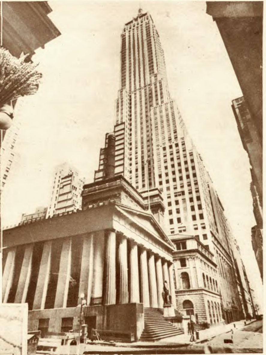
Na prawo: Klasyczny gmach skarbu Stanów Zjednoczonych dziwnie odcina się na tle nowoczesnego drapacza chmur przy Wall Street w New Jorku.