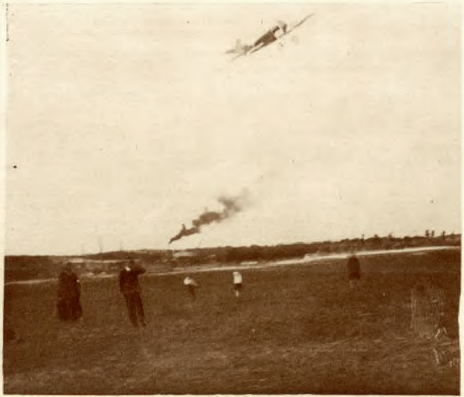
Model kadłubowy, który zdobył pierwszą nagrodę.