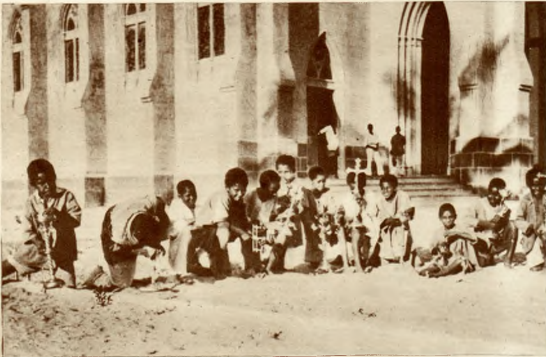
Oryginalny obraz wsch. afrykańskiego miasta Beira. Dzieci Kaffrów czyszczą gorliwie utensylia kościelne.