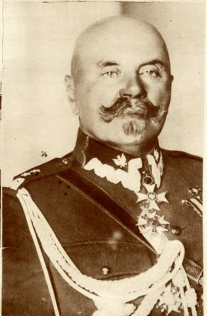
Na prawo: Wicemin. gen. D. Konarzewski został mianowany kierownikiem Minist. Spraw Wojskowych.