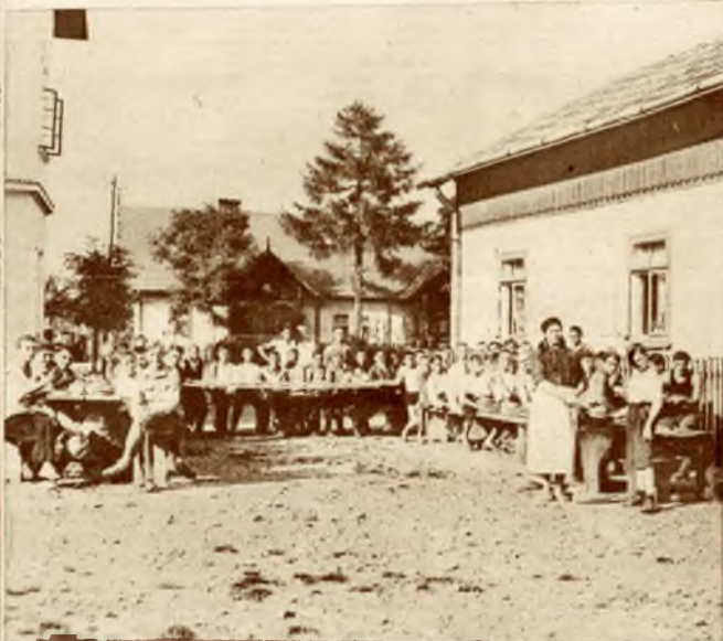
Kolonja lwowskiej młodzieży rzemieślniczej (do kształcające szkoły zawodowe) w Posadzce Olchowskiej pod Sanokiem. Obiad.