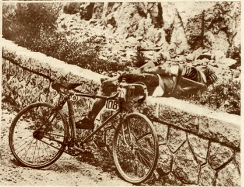
Obrazek z „Tour de France”: zawodnik wyczerpany trudnościami górskiej szosy rezygnuje z wyniku i odpoczywa przy drodze.