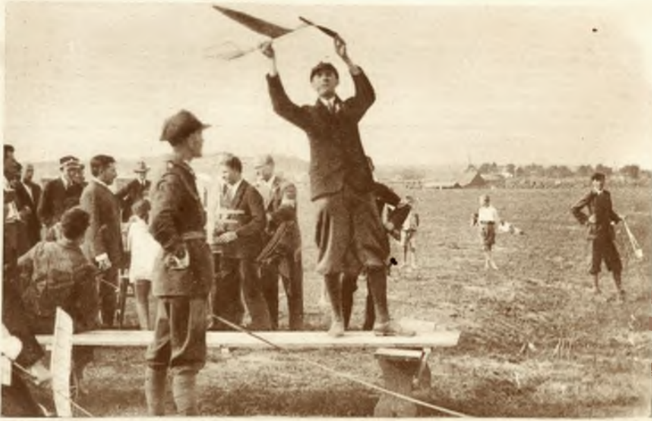
IV konkurs modeli latających we Lwowie Start modelu belkowego z ręki.