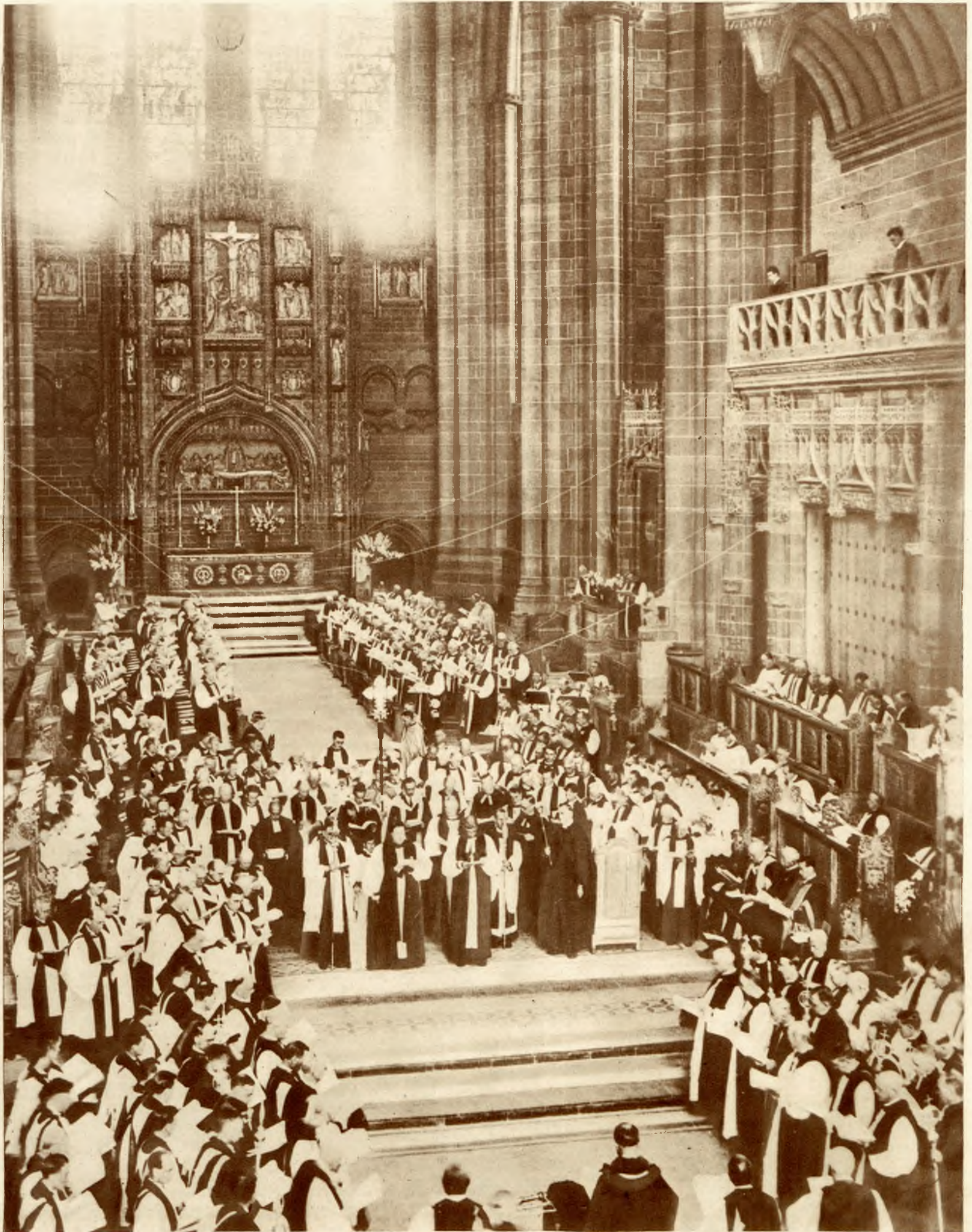
Zdjęcie z wspaniałej uroczystości kościelnej w czasie jubileuszu słynnej katedry Liverpool. Arcybiskup Jorku wita 200 biskupów przybyłych na uroczystość.