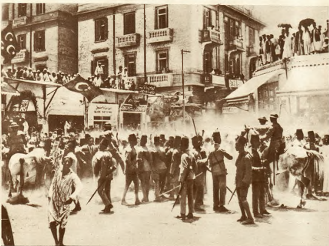
Niepokój w Egipcie. Dowódca antyrządowej partji „Wafd”, Nahas Pasza przybywa do Mansura, witany entuzjastycznie przez ludność. W związku z tem wybuchły krwawe utarczki z policją i wojskiem (na prawo).