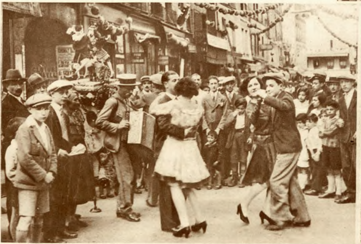
Zabawa ludowa na ulicy Paryża w dniu święta narodowego 14 lipca.