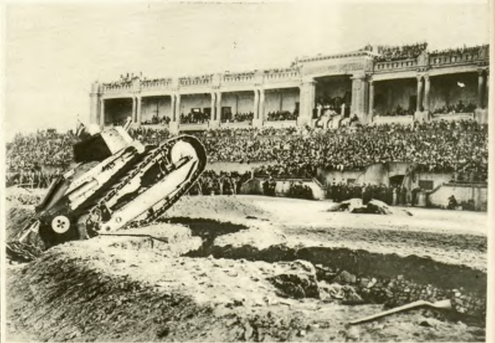
Popisy tanków przed królem belgijskim na stadionie w Namur. Na lewo: Sulejman, szejik arabski z Zanzibaru, przybył do Londynu.