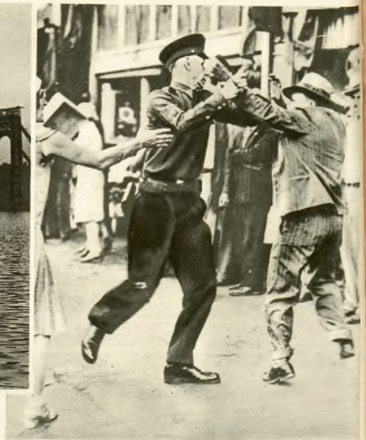
Na prawo: Aresztowanie demonstrantów w Los Angeles w czasie pochodu przeciwwojennego.