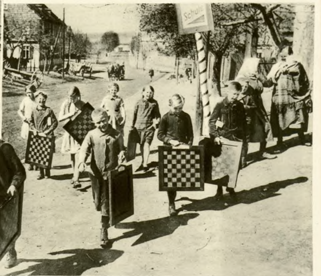
Na prawo: W miasteczku Strobeck w górach Harzu, dzieci pobierają w szkole naukę gry w szachy. Oto grupa dzieci wracająca ze szkoły.