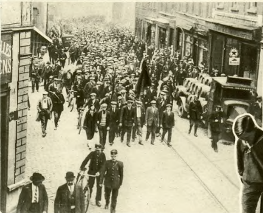
Demonstracja robotników przeciw wprowadzeniu przymusowych ubezpieczeń społecznych w Rubaix (Francja).