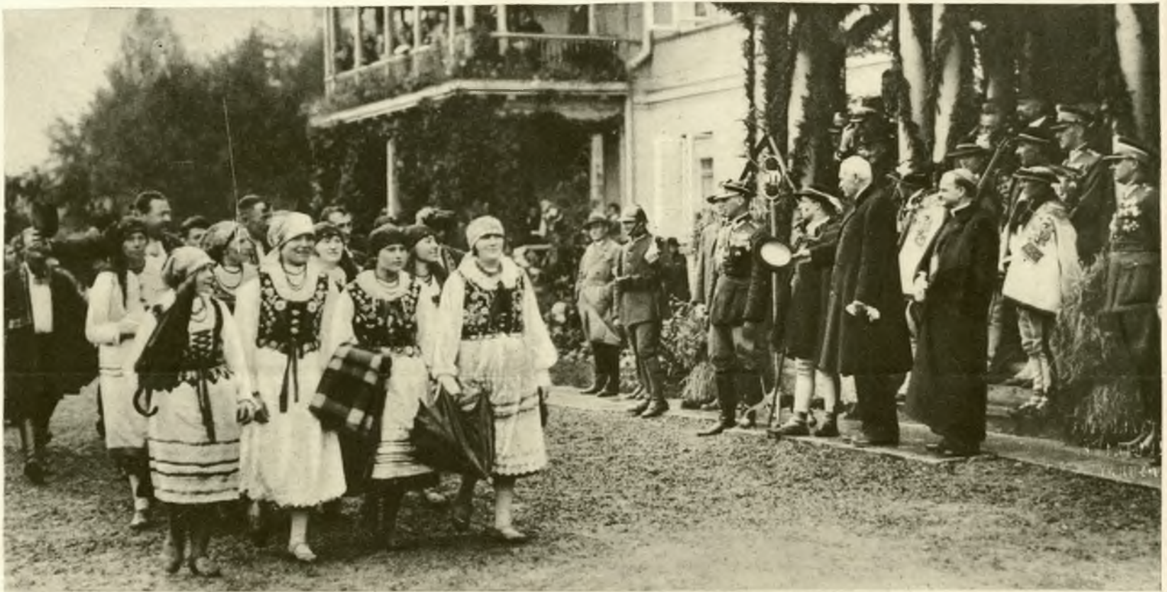
Na prawo: Uroczystości dożynkowe w Spale. Fragment korowodu, który przedefilował przed P. Prezydentem Rzplitej.