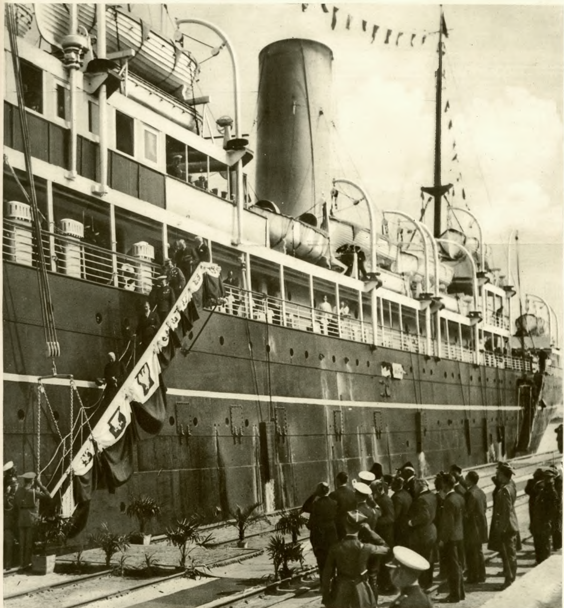
Z podróży p. Prezydenta Mościckiego do Estonji. P. Prezydent po powrocie z podróży opuszcza statek „Polonia“ w porcie gdyńskim.