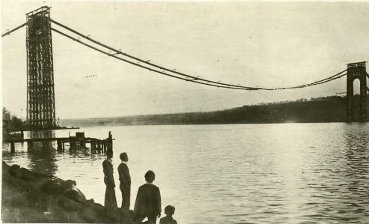
Ogólny widok znajdującego się w budowie olbrzymiego mostu wiszącego między Nowym Jorkiem i Hudsonem.