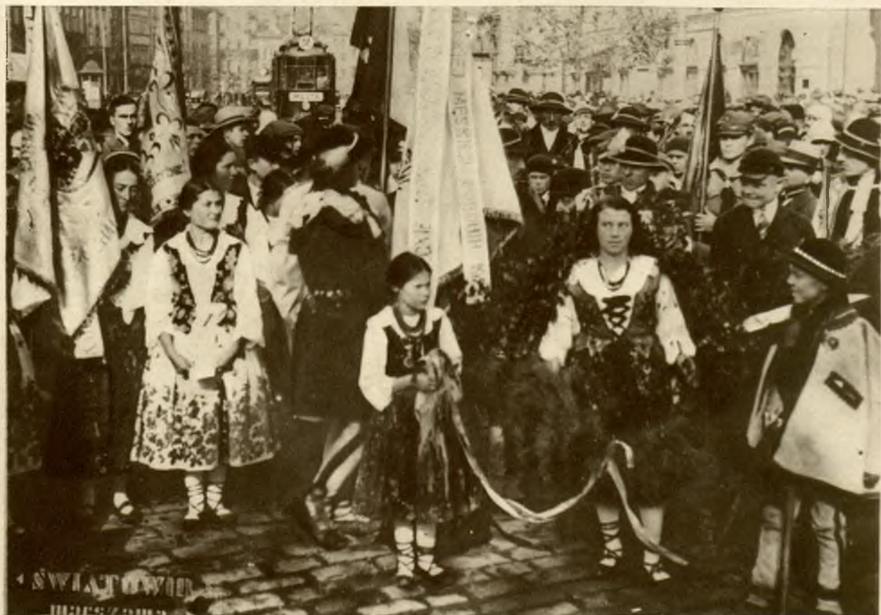
Zespół artystów-górali z Poronina na obchodzie Spisko-Orawskim w Warszawie.