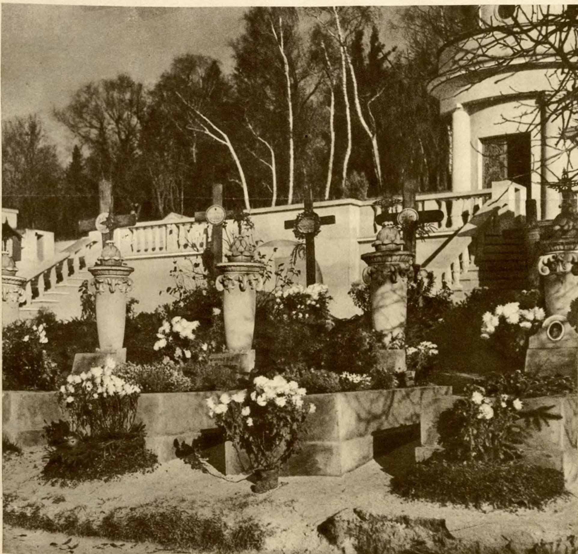
Mogiły poległych pod Zadwórzem.