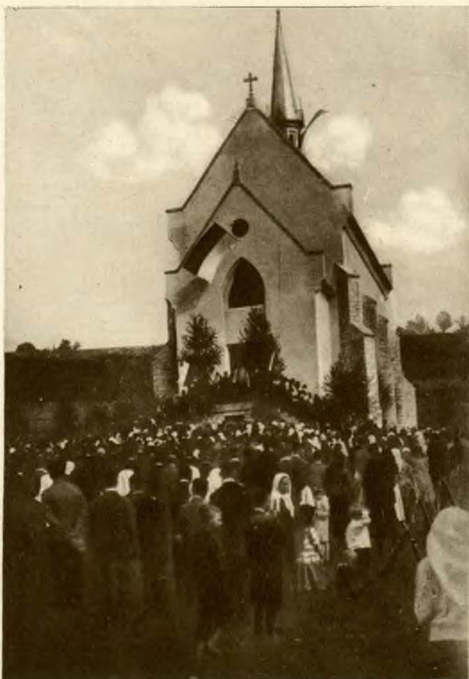
Kościół w Rohaczynie gminie należącej do parafji Narajów, powiat Brzeżany. Uroczystość poświęcenia w dniu 28. IX. 1930 r.