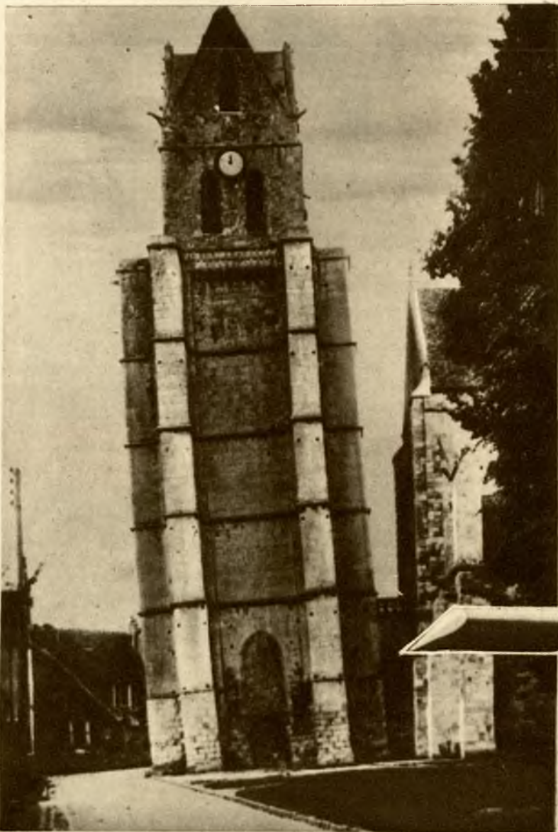
Nietylko w Pizie (Italja) ale także w Etampes pod Paryżem stoi krzywa wieża.