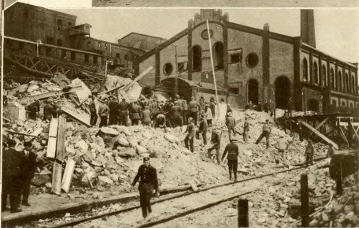
Widok ruin po katastrofie w Aisdorf w której 231 osób straciło życie.