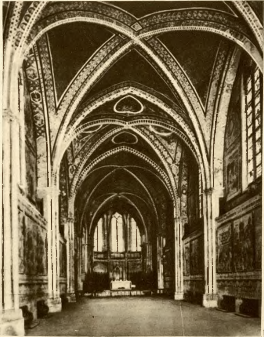
Wnętrze bazyliki św. Franciszka w Assyżu, gdzie odbędzie się ślub króla Bułgarii Borysa z księżniczką włoską Giovanną.