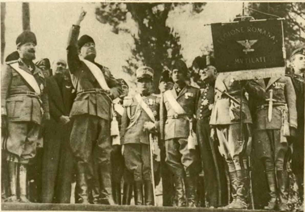
Mussolini wygłasza swą sensacyjną mowę w dzień dziewiątej rocznicy marszu na Rzym.