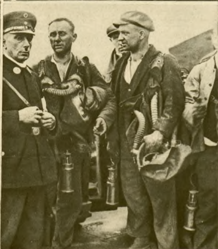
Pozostali przy życiu członkowie grupy ratowniczej, której 12-stu członków zginęło w czasie akcji ratunkowej w kopalni Maybach.