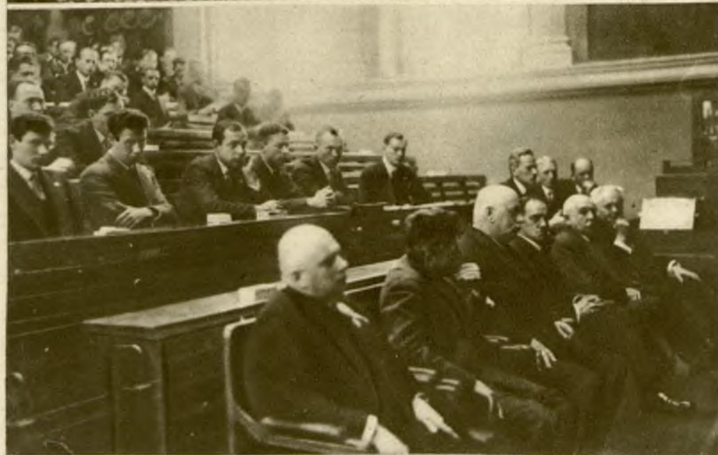
Na lewo: Zjazd Kół chemicznych studentów wyższych uczelní w Polsce we Lwowie. Sala obrad. W I rzędzie grono wyższych profesorów.