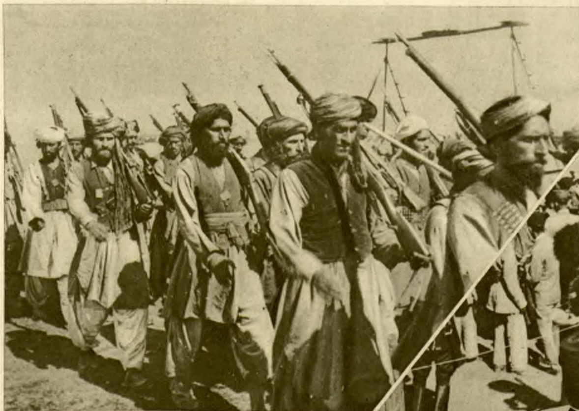
Obrazki z oficjalnego objęcia władzy przez nowego władcę Afganistanu Nadir Khana. U góry członkowie najwierniejszego królowi szczepu Waziri. Na prawo wysocy oficerowie afgańscy siedzący w kuczki na ziemi w czasie uroczystości.