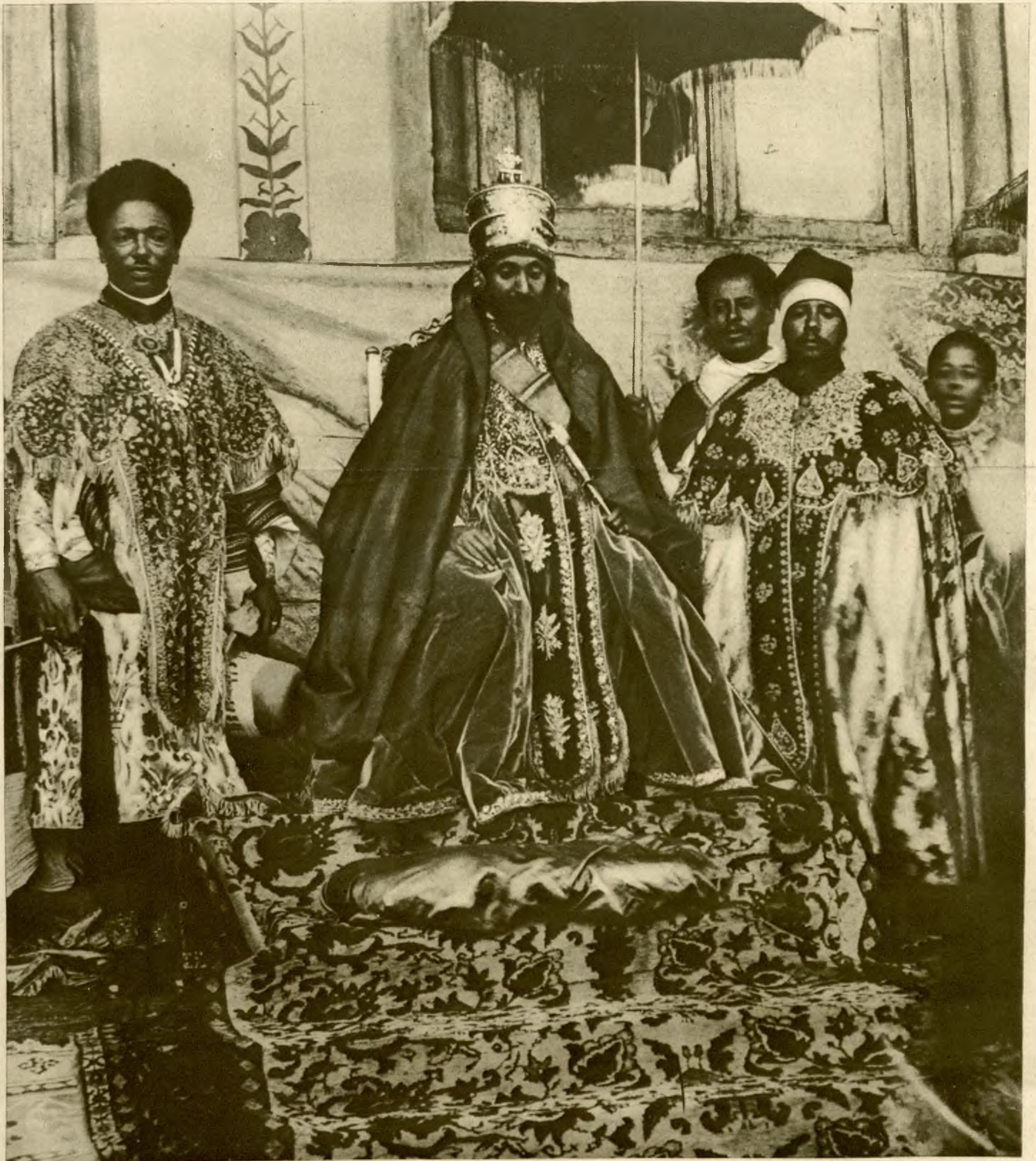
Ras Tafari, regent Abisynji, koronował się na cesarza Etjopji.