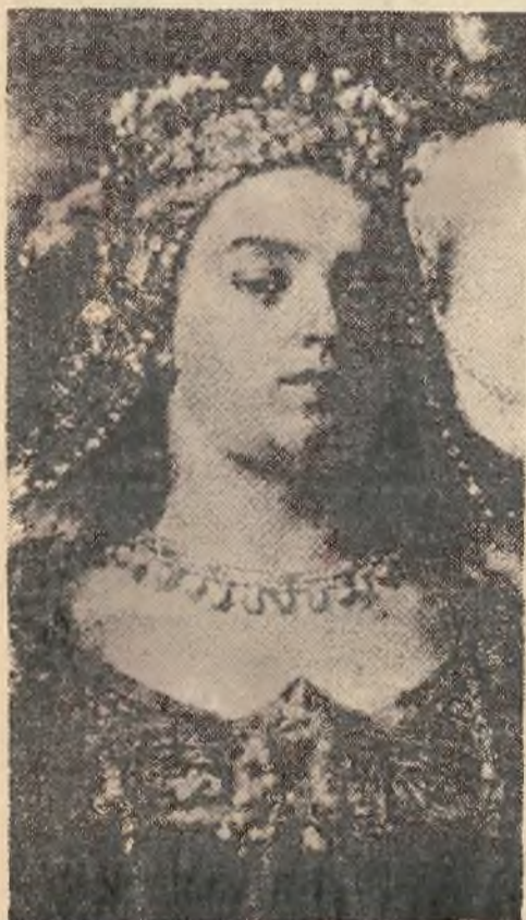
Królowa Bona (według obrazu J. Matejki).

Jak Małopolska, tak i Wielkopolska wzbierała się uznać Barbarę, to też król zamierzał osobiście poskromić opozycję i postanowił z żoną jechać do Poznania. Przeszkodził temu Mikołaj Czarny Radziwiłł, przewidując, „ze Barbary panowie witać nie będą, pani żadna u niej nie będzie, i przyjdzie jeszcze na to, że będą błotem ciskać.”