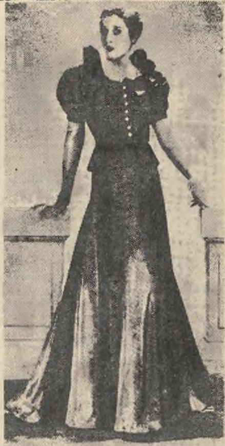
Suknia wieczorowa z tafty w drobny kratkę; rękawy bufiaste.

Schiaparelli natomiast pozostaje wierną hinduskiej „Sari“, które drapuje w najrozmaitsze, bardzo oryginalne sposoby. Daje to ładne efekty, zwłaszcza przy czarnych, gładko rozczesanych włosach.