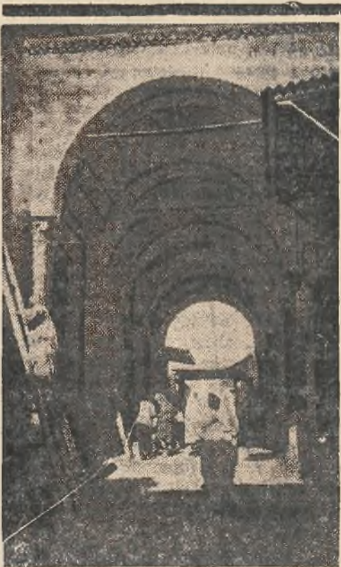
Charakterystyczna uliczka w Tunisie.