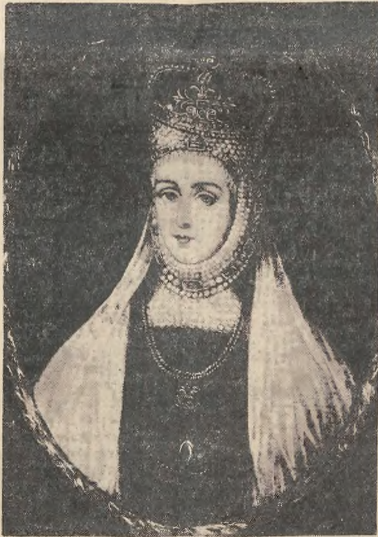
KROLOWA BARBARA RADZIWIŁŁOWNA