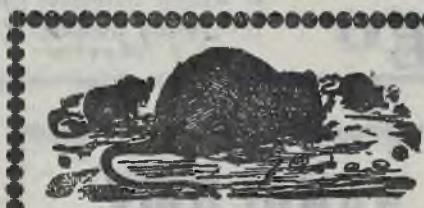
Szczury i myszy

część Marszałka Focha, na powitalne przemówienie wojewody odpowiedział Marszałek między innymi: „Mogę ponownie oświadczyć w imieniu rządu francuskiego, którego jestem przedstawicielem, że Francja będzie zawsze gotowa udzielić Polsce pomocy dla obrony jej praw i utrzymania istniejących traktatów oraz że Francja liczy również na Polskę”. Po przemówieniu Marszałka Focha odbył się raut przy udziale przedstawicieli władz, duchowieństwa, literatury, sztuki, prasy i t.p.