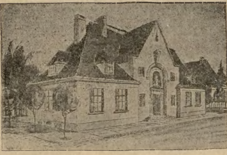
DOM DLA URZĘDNIKÓW KAWALERÓW

Opowiadano mi przykład uchwalcenia tego opryska przed wojną. Było tak: Pewnego dnia „sprawnik” święciański otrzymał list: „Jeśliście ciekawi mnie zoba-