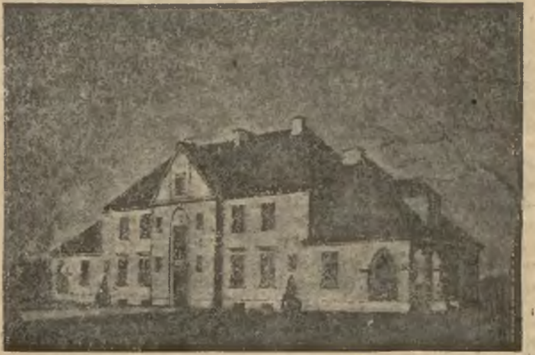
DOM DLA URZĘDNIKÓW SĄDOWYCH W SMORGONJACH

wie, może i obecnie Rysiuw na nich skup one—miasteczko.