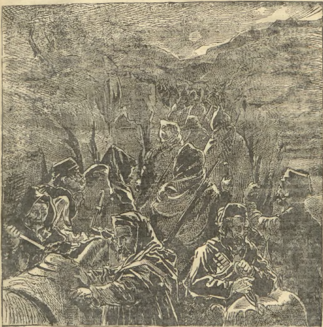
Macedończycy po nocy w górach bałkańskich, ciągnący przeciwko Turkom.

W piątek w znanej restauracji Naftuly Toepfera