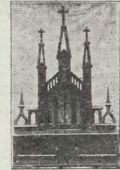
Zegar p. K. Sobolewskiego.

przed ołtarzem. Zaczynają grać organy. Książd odprawia mszę. Na podniesienie milkną organy — jak podczas najprawdopodobniejszego nabożeństwa. Książd odwraca się i podniósłszy rękę błogosławi. «Tyle tylko, że nie przemówi!», «Ite, Missa est!»