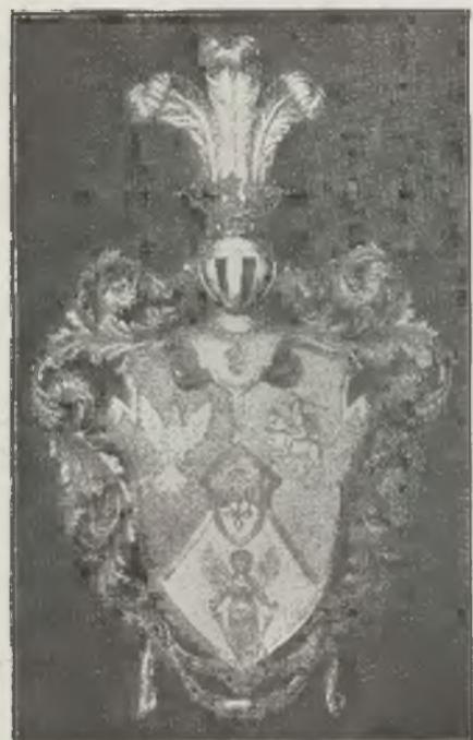
Herb Konwentu Polonia.