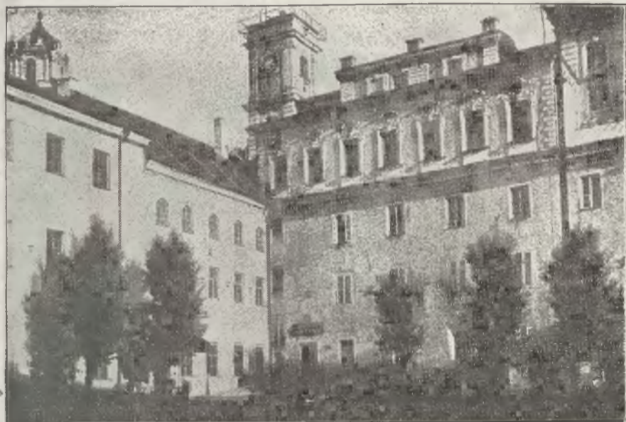
Uniwersytet wileński. Widok na obserwatorium.