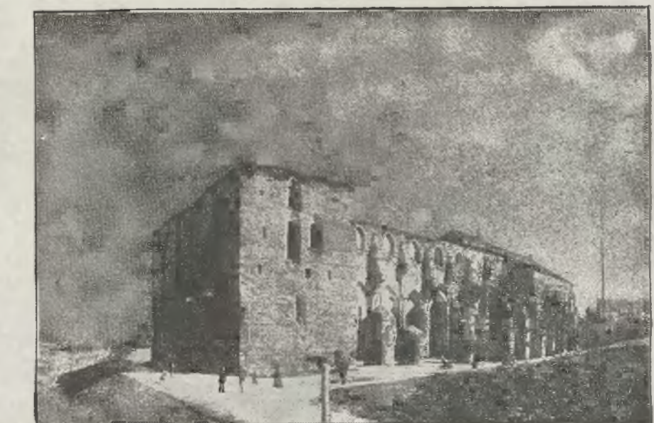
Zwaliska temu gotyckiego w Dorpacie

Wracał tam, skąd jego założyciele musieli uchodzić lub byli deportowani przed wielu, wielu laty... Dnia 3 maja 1919 roku Senat wileńskikiej Almae Matris zatwierdził statut Konwentu „Polonia” przyjmując ją na łono naszej wszechnicy w poczet 7-miu innych korporacji istniejących w murach uniwersyteckich podjązwennicą Świętojańska.