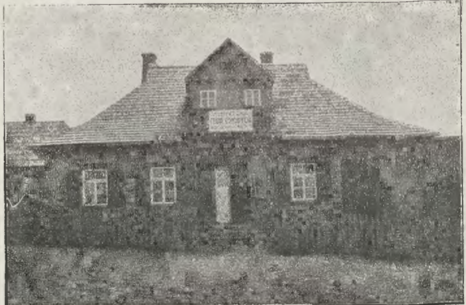
Sejmikowa Izba Chorych w Brasławiu.