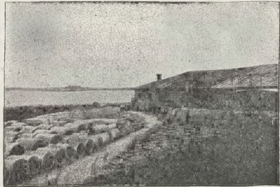
Betoniarnia Sejmikowa w Brasławiu.