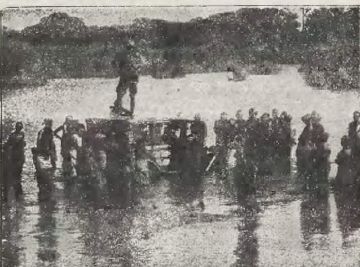
Równina Bahora pod wodą. (Południowa Tanganika). Na dachu sedanu stoi kpt. Lacey, komandor Ekspedycji Chevroletowej, kierując przeprawą. Jeziora takie powstałe wskutek powodzi ekspedycja spotykała prawie na każdym kroku podczas podróży przez Tanganikę.

kańskich, gdyż droga do Moshi prowa-dziła przez równiny, porośnięte wysoką trawą. Miejscami ślad drogi był znaczny, lecz w niektórych miejscach by-