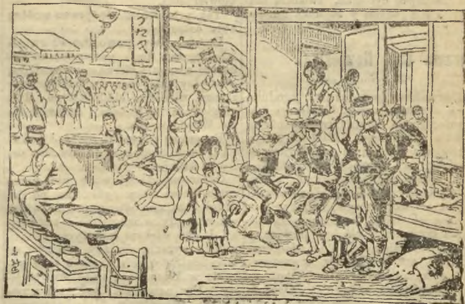
Japońska piechota na biwaku.