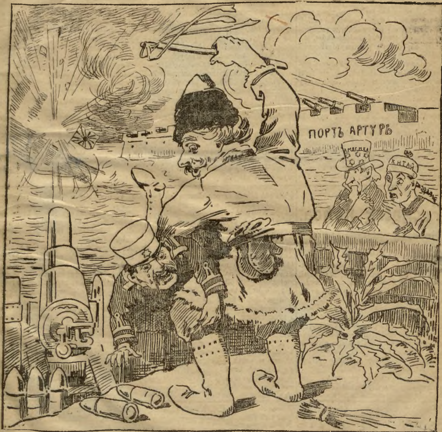
Rysunek rosyjski, do którego tekst podaliśmy wczoraj, którego oryginał znajduje się w naszym oknie wystawowom.