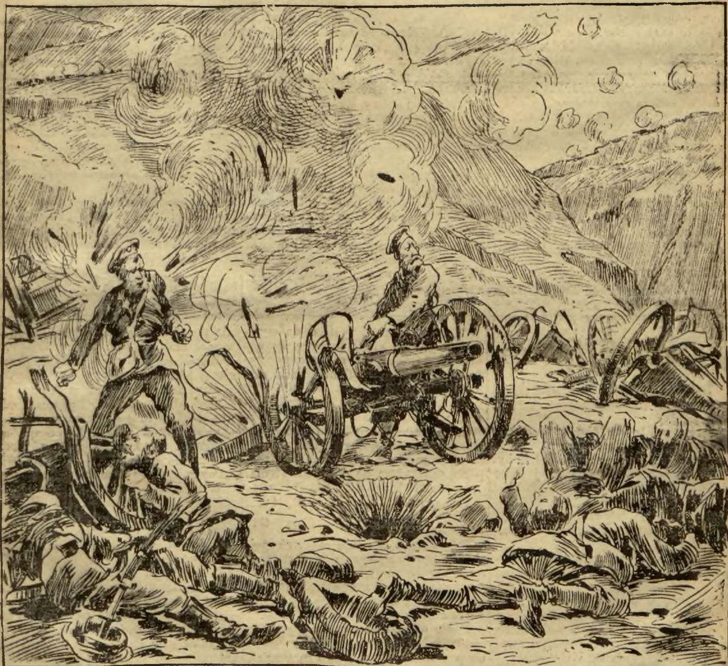
Artylerya rosyjska broniąca fortu pod Portem Artura.