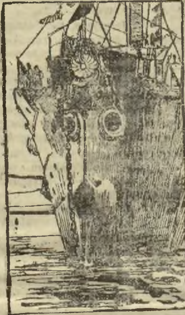
Okret japoński, posiadający na czubie podobiznę twarzy ludzkiej.

Trzeba bowiem zrozumieć niewesołe położenie tej biednej młodzieży