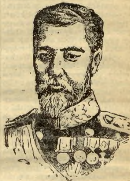
Heihachiwo, komendant floty japońskiej na morzu Żółtem.

na lekarzy całego Królestwa; tylko że o ilości lekarzy pobranych z okolicy i ich nazwisk dowiedzieć się tu wprost nie sposób. Władze wojskowe trzymają wszystko w jak najściślejszej tajemnicy. To jednak faktem jest niezaprzeczonem, iż rząd rosyjski powołuje lekarzy nawet z tych okolic, które mają na wielkiej przestrzeni ledwie jednego lekarza, a straciwszy go „dla celów wojennych“,