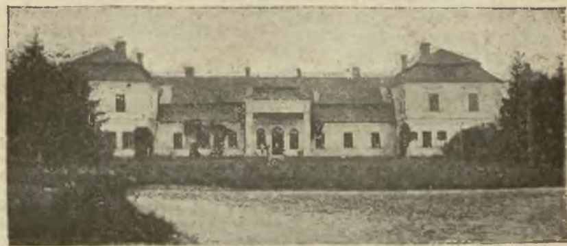
Były pałacyk rezydencjonalny w Opsie

Województwo atoli Brasławskie utworzone zostało dopiero na lat parę przed upadkiem Rzeczypospolitej, w 1793 cim i mianowany był w tymże roku «z nowego prawa» wojewodą brasławskim Michał Kossakowski. Jednocześnie utworzone nawet kasztelanje Brasławską, bodaj czy nie specjalnie dla ks. Michała Ogińskiego.