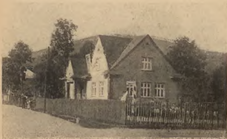
Dom Ludowy T. S. L. im. Marszałka J. Piłsudskiego w Buczkowicach (pow. Biała).