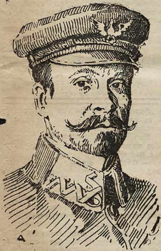
Generał broni Józef Haller

został zawieszony z urlopu, celem objęcia wybitnego stanowiska na froncie wschodnim.