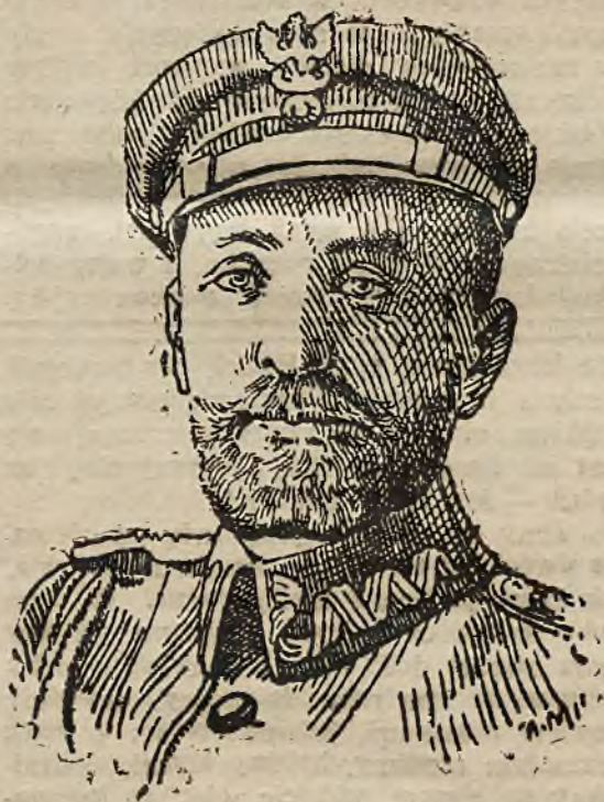
Gen. por. Tadeusz Rozwadowski

Mieszkańcy i kuracyusze, przebywający w Krynicy, urządzili udającemu się na nowy posterunek generałowi owacyjną pożegnanie.