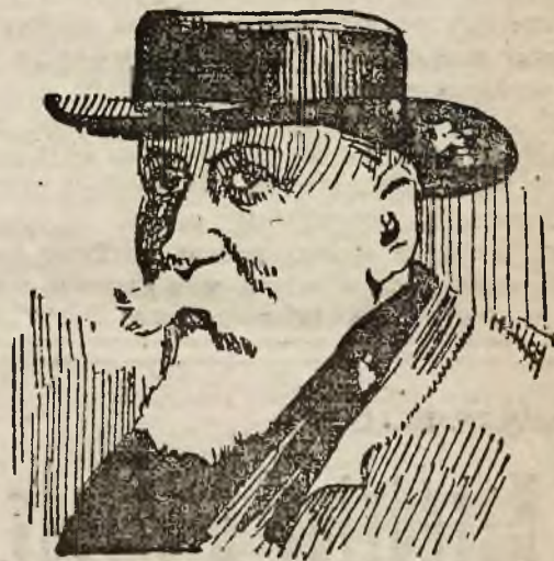
(Opis wewnątrz numeru).