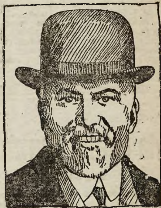
M. Raymond Poincaré

b. prezydent Francji, położył znaczne zasługi jako prezes Komisji reparacyjnej.