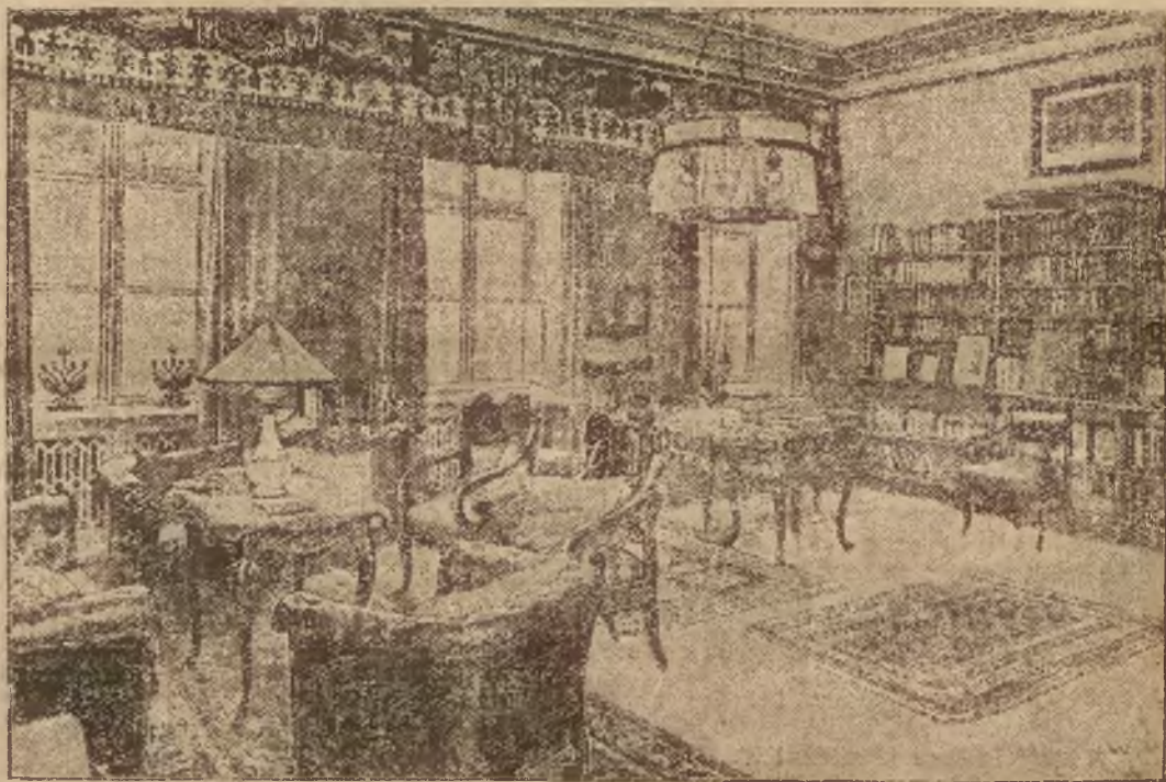
Wnętrze jednego z salonów niemieckiego poselstwa w Warszawie.

stując żołnierzy mlekiem i chlebem. Policja w komplecie odmaszerowała do Wilna.