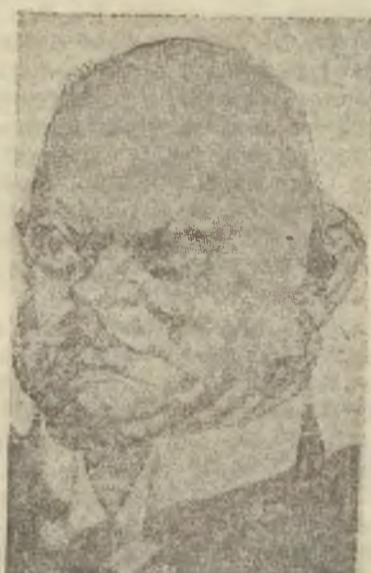
Dr. Stresemann, niemiecki minister spraw zagranicznych. Według rysunku z natury wykonanego przez karykaturzystę francuskiego.