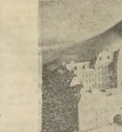
Wygląd szkoły technicznej po wykonczeniu budowy.