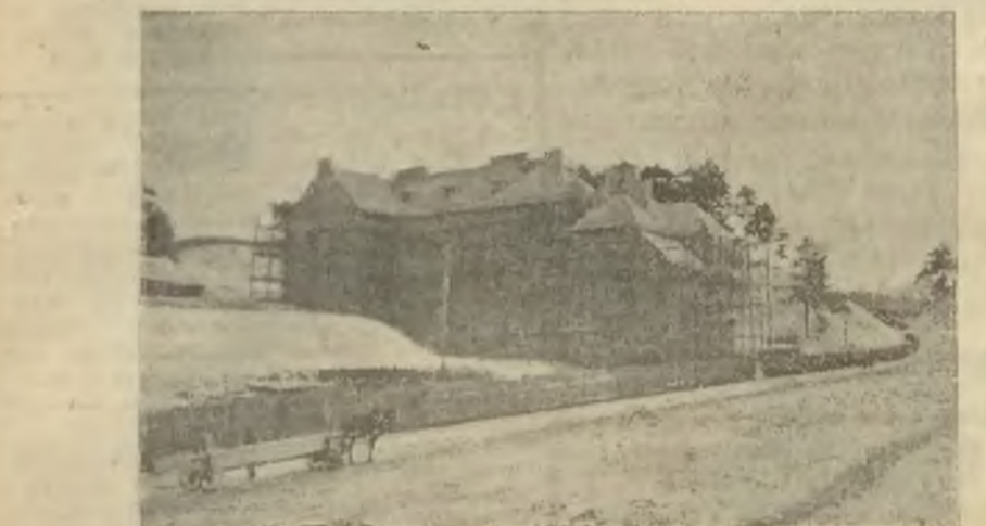
Gmach szkół technicznej zimą roku bieżącego.

Dziś pod tym względem nastąpiła wyraźna zmiana. Po kilku latach wma-