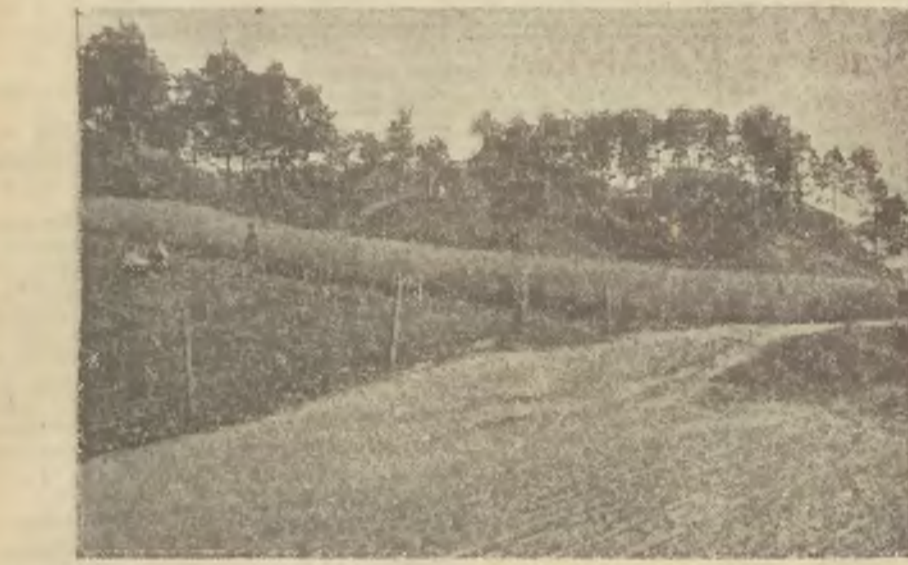
Przed dwoma laty.

Udało mi się temi dniami uchylić rąbką tajemnicy... nie! — sekretu, który kryją wzgórza Antokolskie. O to gdy się starym Antokolem ku kościołowi św. św. Anstolów Piotra i Pawła zmierzają, dyskretnie z górki wyrasta gmach jak się po stronie prawej. Niewiadomego przechodnia, nadzieją nowych mieszkańcików... i na ten właśnie polega ten sekret, com o nim wyżej wspomniałem, że mało kto wie co tam, wśród u-