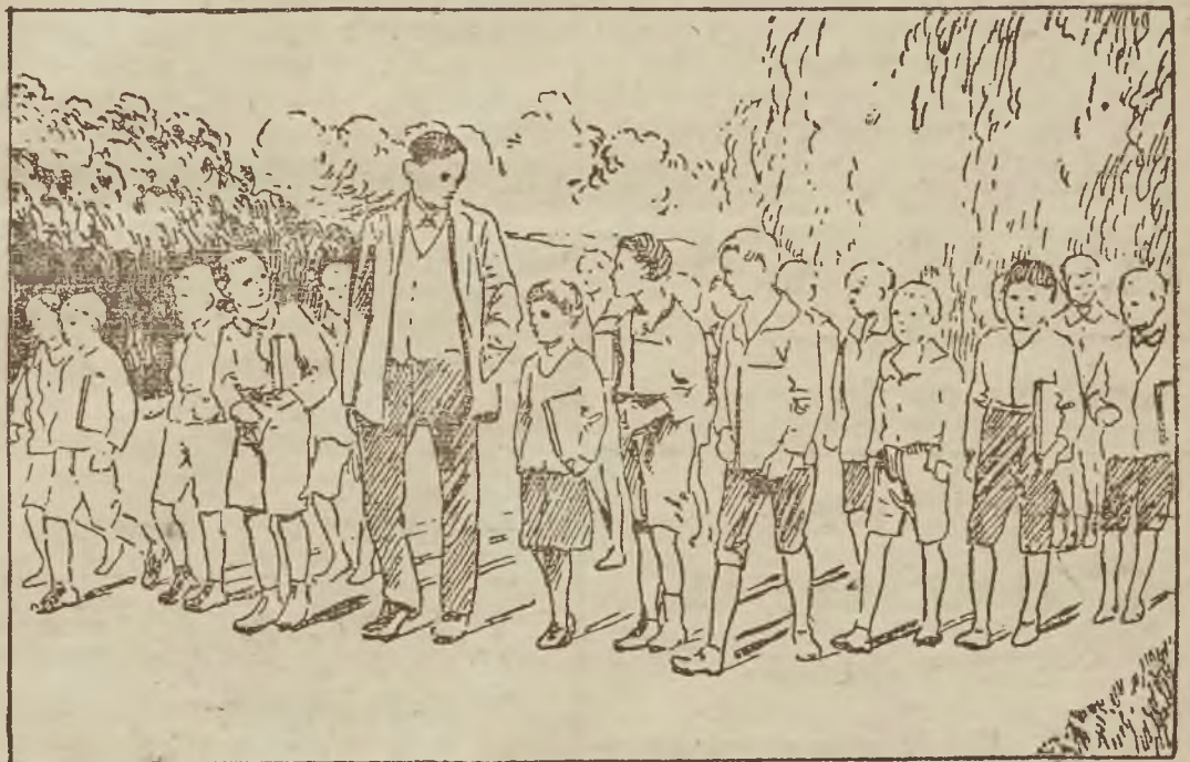
(Opis wewnątrz numeru.)