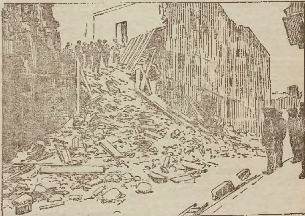
Prace ratunkowe w pierwszym dniu po zawałeniu się kamienicy — według zdjęcia, dokonanego przez zakład fotograficzny Münza.

Kino „WANDA” ul. Trzebiągo Maja 11. Kino „WANDA” Pożar cyrku pełen sensacji dramat amerykański w 6 wielkich akt., w roli gł. słynny artysta MARYO GUAISKA AUSONIO 14885