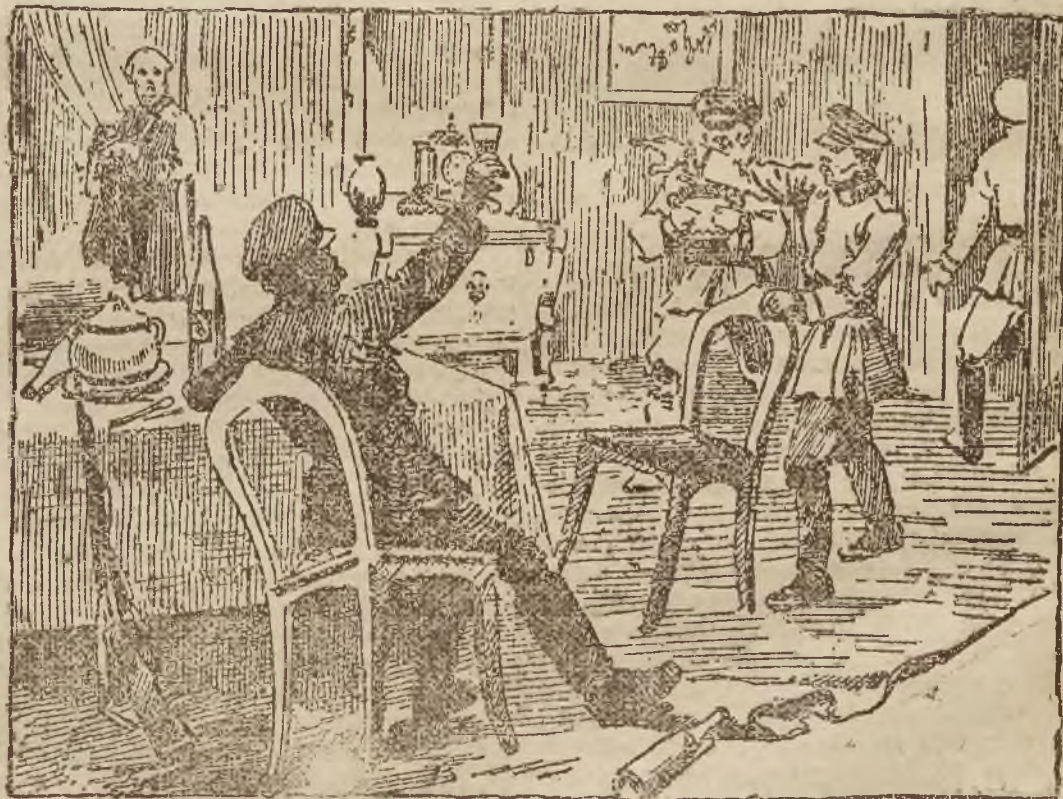
Krasnoarmiejcy „urzędują“ w zajętem mieszkaniu „burżuazji“