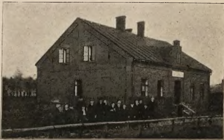
Bursa polska im. Królowej Jadwigi w Białe.

Wbrew powszechnemu mniemaniu, że żywioł polski na Rusi Czerwonej koncentruje się w miastach,