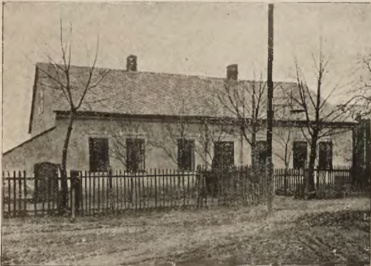
Szkola T. S. L. w Przywozie na Morawach (stan dzisiejszy).

Wiec ten wywarł głębokie wrażenie na zebranych masach ludności polskiej i zaważył nader poważnie na szali uświadomienia narodowego szerokich mas polskiej ludności robotniczej. Na wiecu tym ujawniła się w całej pełni perfidya czeska, a fałszywa struna słowiańska pękła ze zgrzytem.